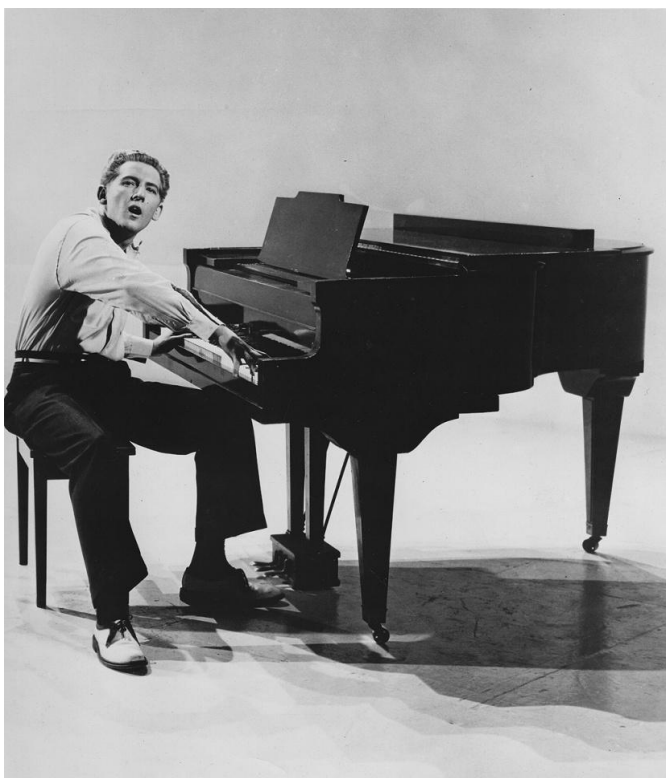
Jerry Lee Lewis (29. 9. 1935 – dodnes) 109