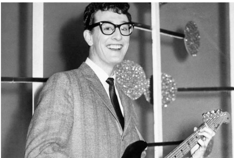
Buddy Holly (7. 9. 1936 – 3. 2. 1959) 108