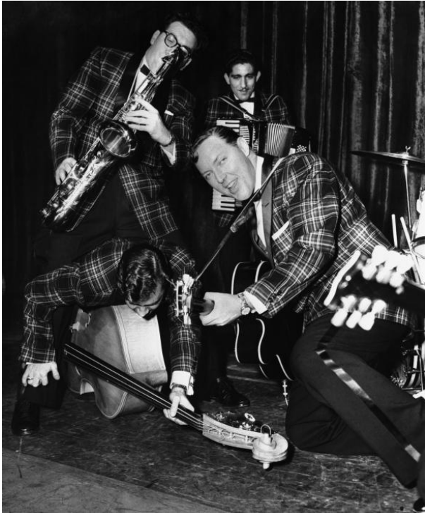
Bill Haley (6. 7. 1925 – 9. 2. 1981) 105