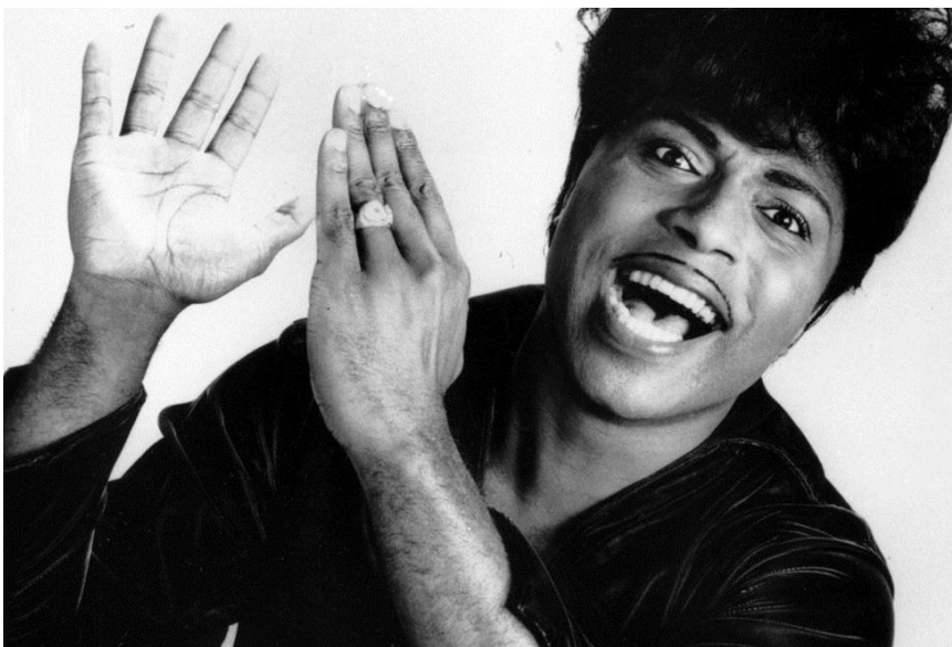
Little Richard (5. 12. 1932 – dodnes) 106