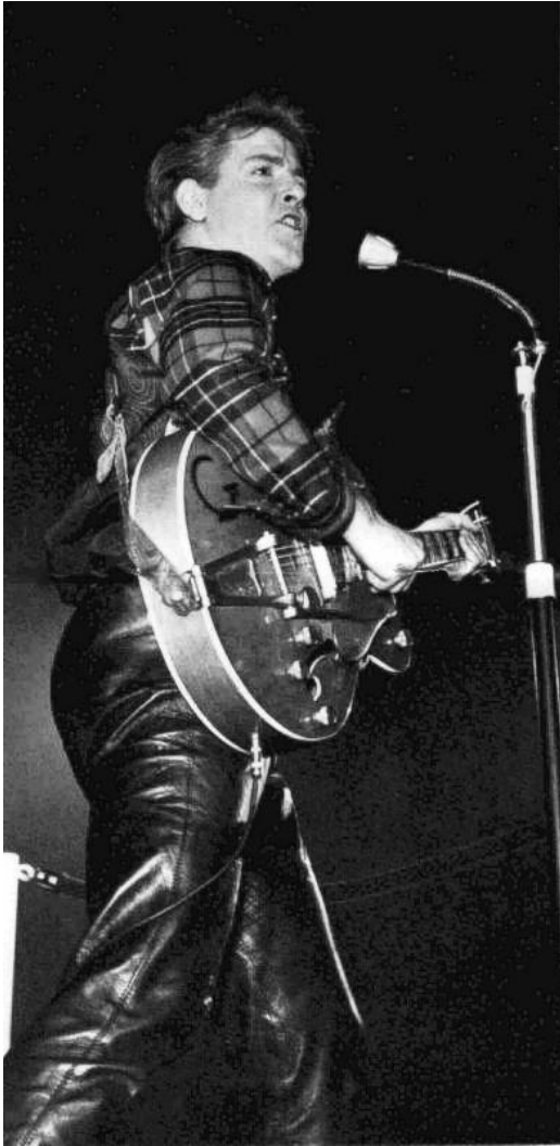
Eddie Cochran (3. 10. 1938 – 17. 4. 1960) 113