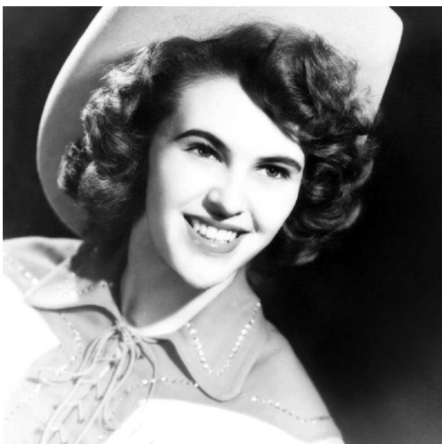
Wanda Jackson (20. 10. 1938 – dodnes) 110