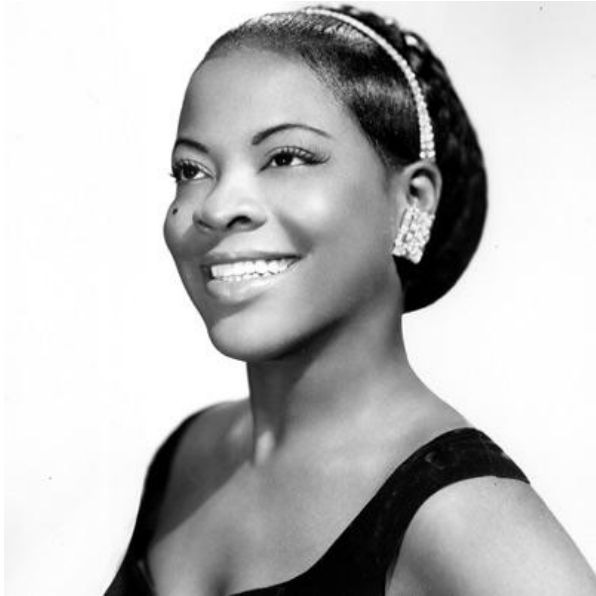
Lavern Baker (11. 11. 1929 – 10. 3. 1997) 111