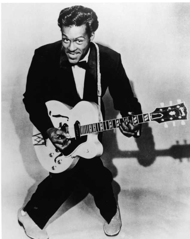
Chuck Berry (18. 10. 1926 – dodnes) 107