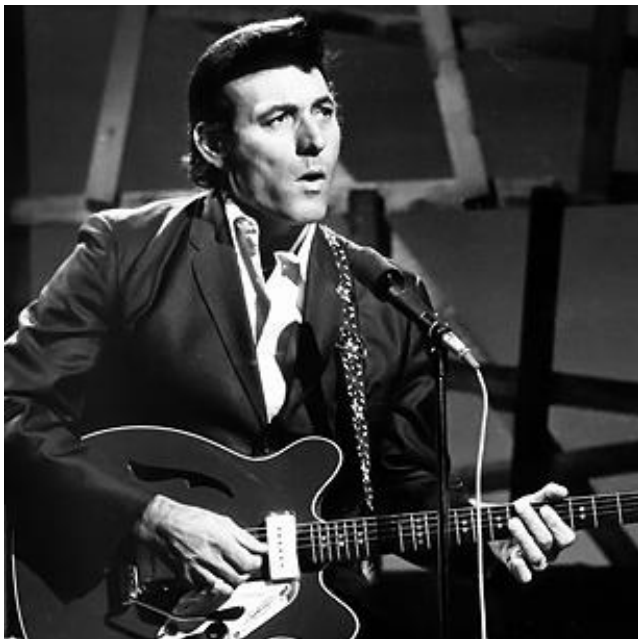
Carl Perkins (9. 4. 1932 – 19. 1. 1998) 112