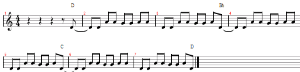
Obrázek č. 1 - Riff skupiny Iron Maiden , skladba Fear of the Dark .

první začali používat postup tří akordů na prvním, šestém a sedmém stupni v aiolské moll.