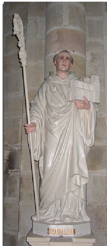
Obrázek 5 Opat Odilo z Cluny 561