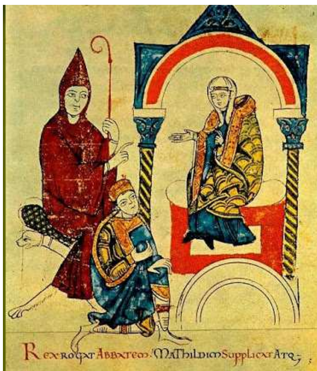
Obrázek 6 Opat Hugo z Cluny s hraběnkou Matyldou Toskánskou, před nimi klečí Jindřich IV. 562