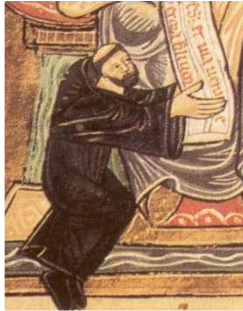
Obrázek 3 Odo z Cluny 559