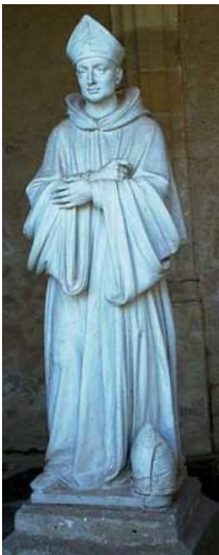
Obrázek 4 Opat Majolus z Cluny 560