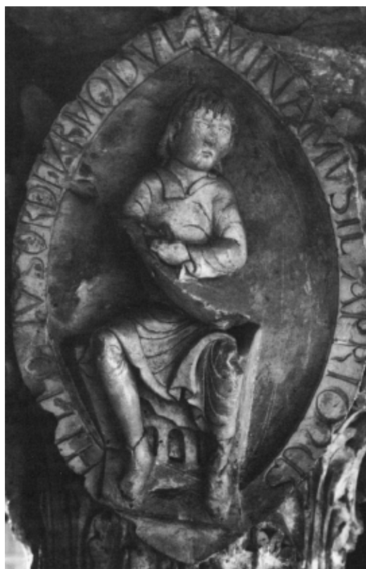
Obrázek 9 figurální výzdoba v Cluny III. 565