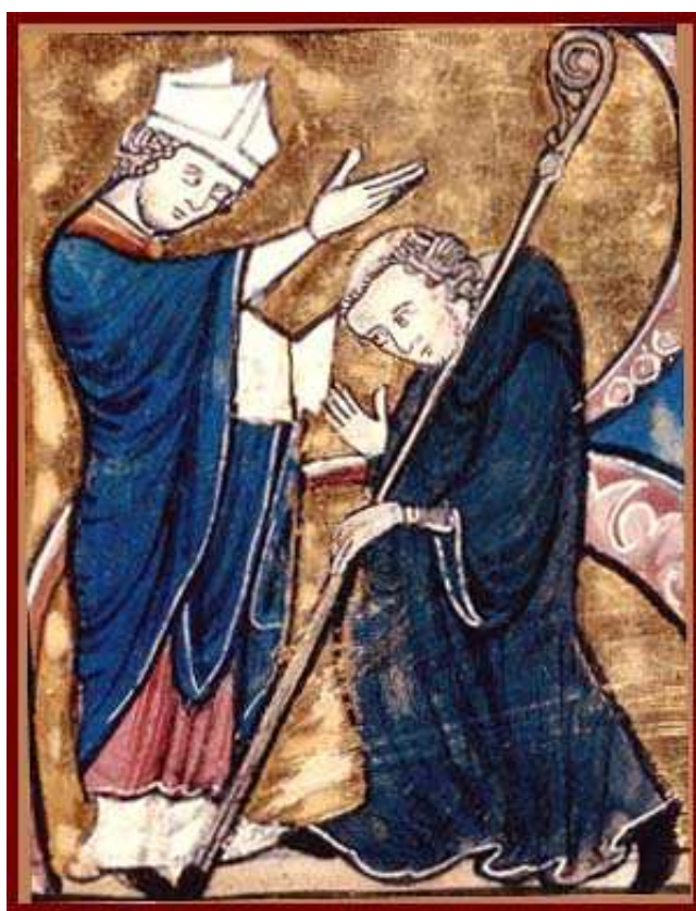
Obrázek 7 Opat Petr Ctíhodný (klečící) 563