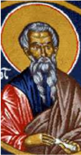
Obrázek 2 Opat Berno z Baume 558