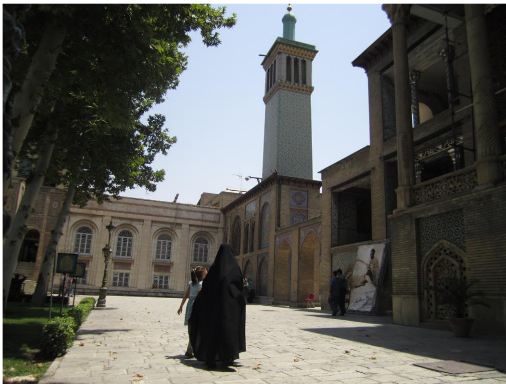
Obrázek 26 – Teherán 2011