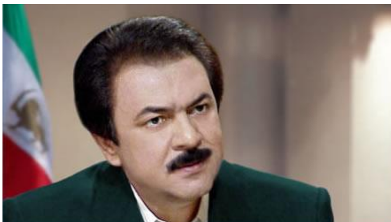
Obrázek 4 – Masúd Radžaví 455