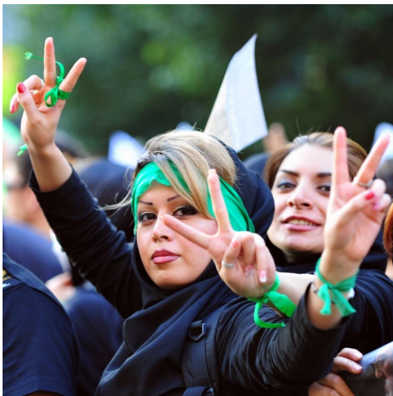
Obrázek 21 – záběry ze zelené revoluce 471