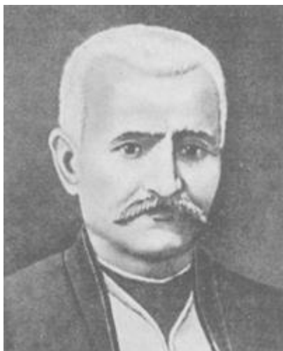
Obrázek 6 - Mírzá Fath Alí Áchóndzáde 457