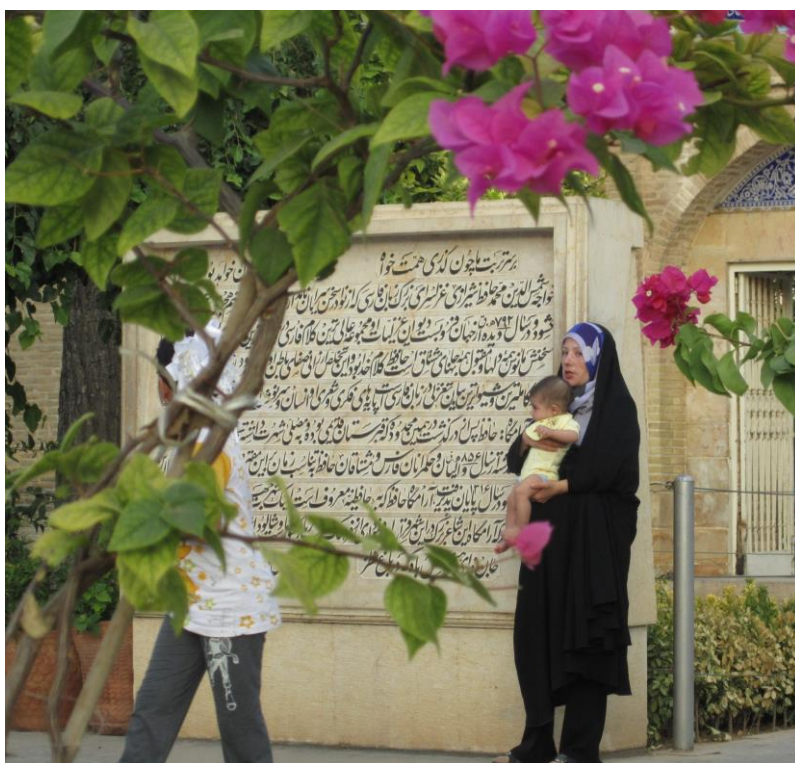
Obrázek 28 – Šíráz 2011