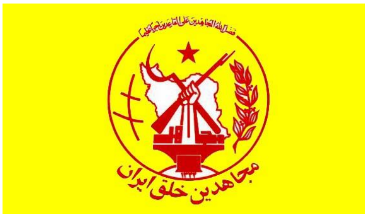
Obrázek 3 – logo Modžáhedín-e Chalq-e Írán (PMOI) 454