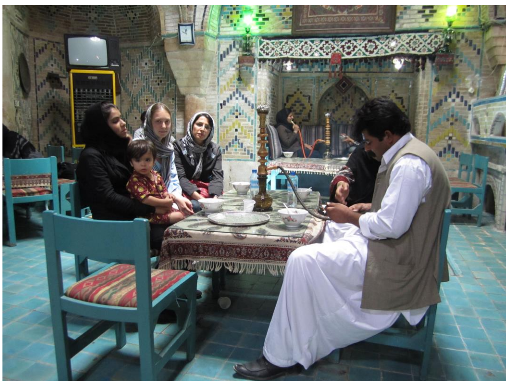
Obrázek 30 – Kermán 2011