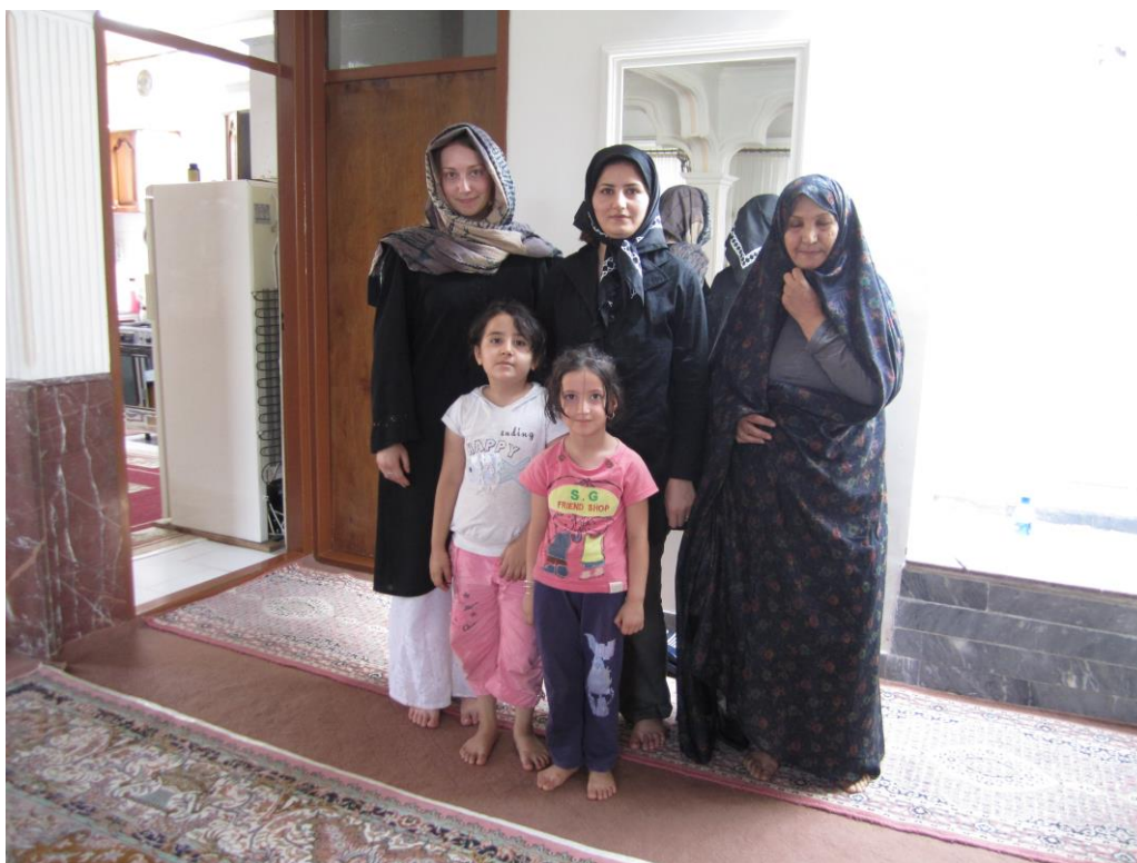
Obrázek 35 – Marand 2011 (z mého osobního archivu)