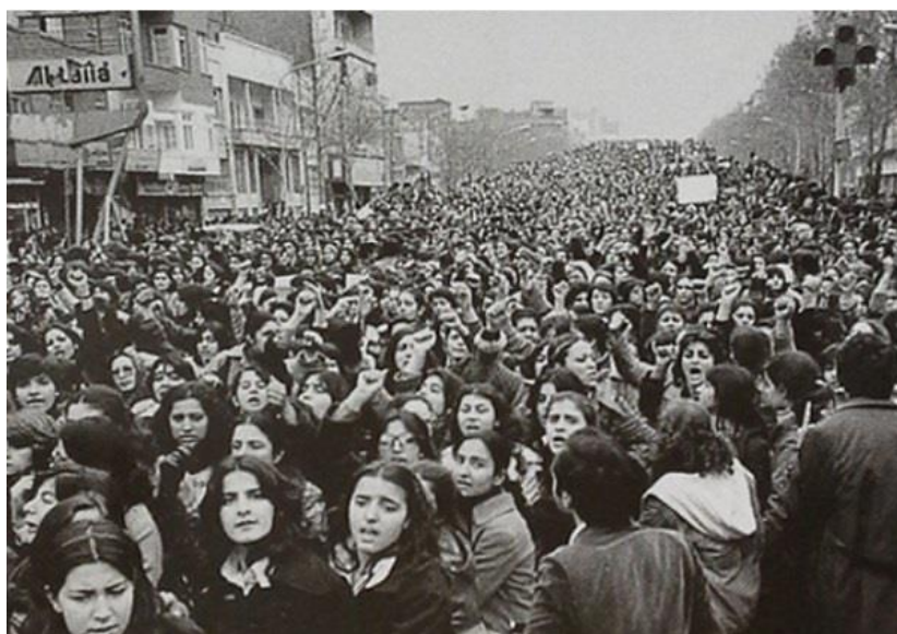
Obrázek 17 – demonstrace 1979 proti povinnému nošení hedžábu 467