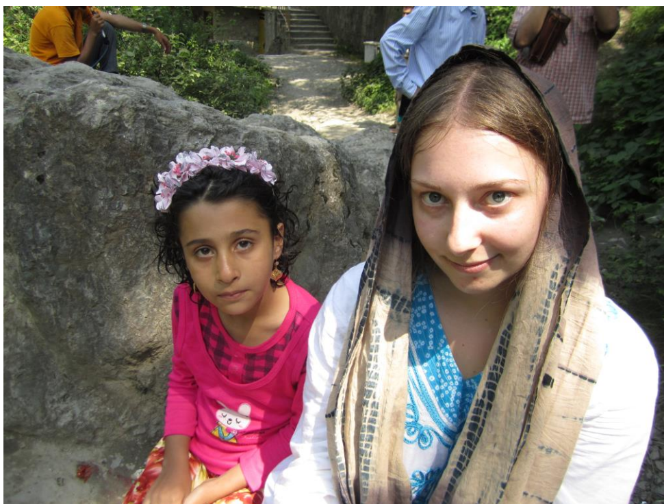
Obrázek 33 – vesnice Másúle 2011