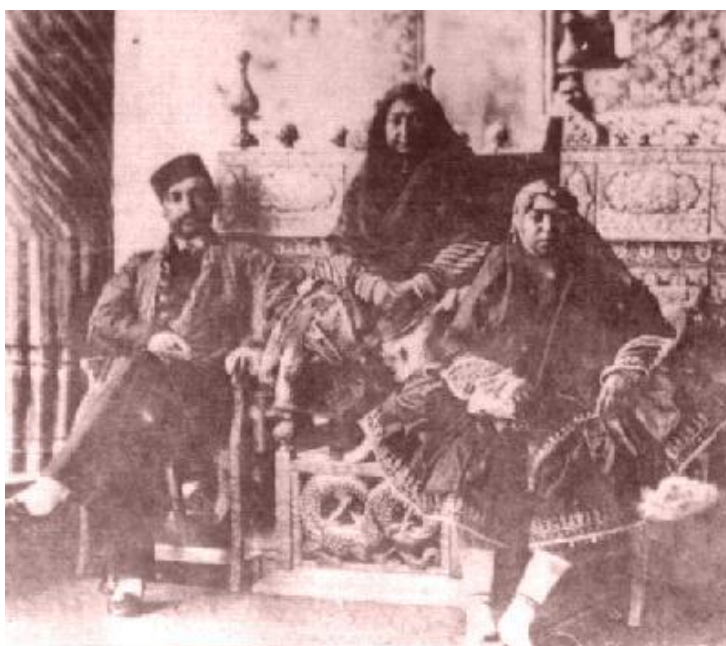
Obrázek 12 - Mahd-e Olijá na trůně vedle svého syna šáha Náséroddína 462