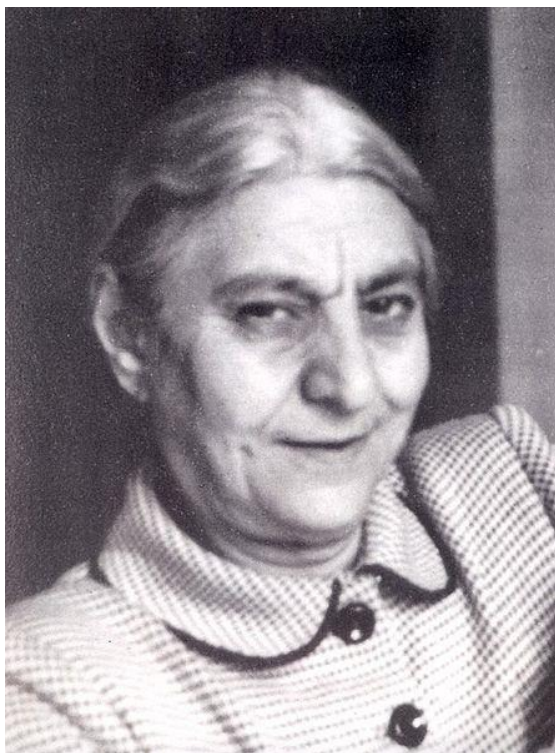
Obrázek 13 - Fachr ad-Doule 463