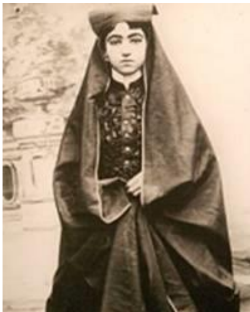
Obrázek 14 - Tádž as-Saltana 464