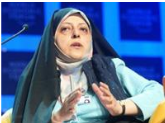
Obrázek 18 - Másúme Ebtekár 468