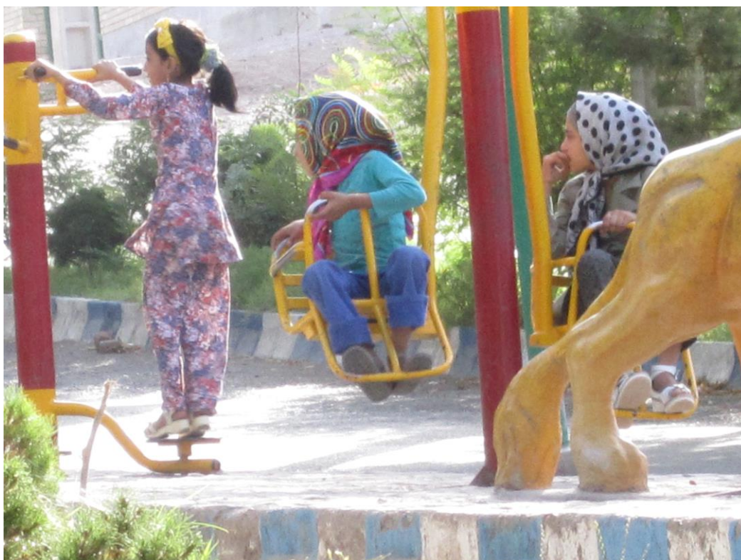
Obrázek 31 – Bam 2011