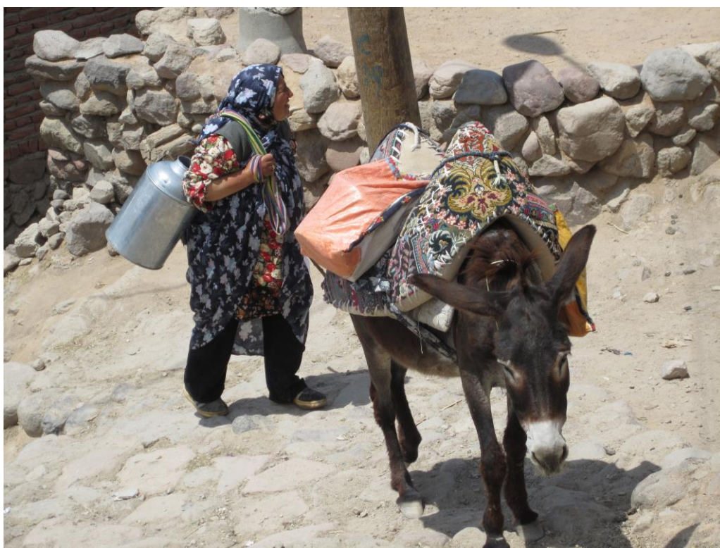
Obrázek 34 - Kandován 2011