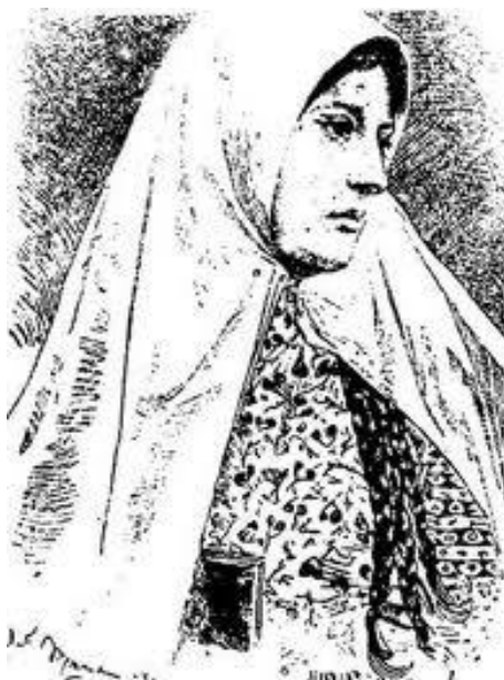
Obrázek 8 - Qurratulajn 459