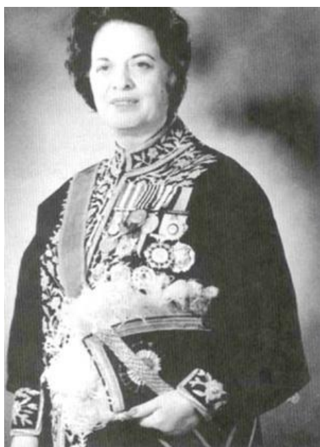
Dr. Farrokh Roo Parsa Minister of Education