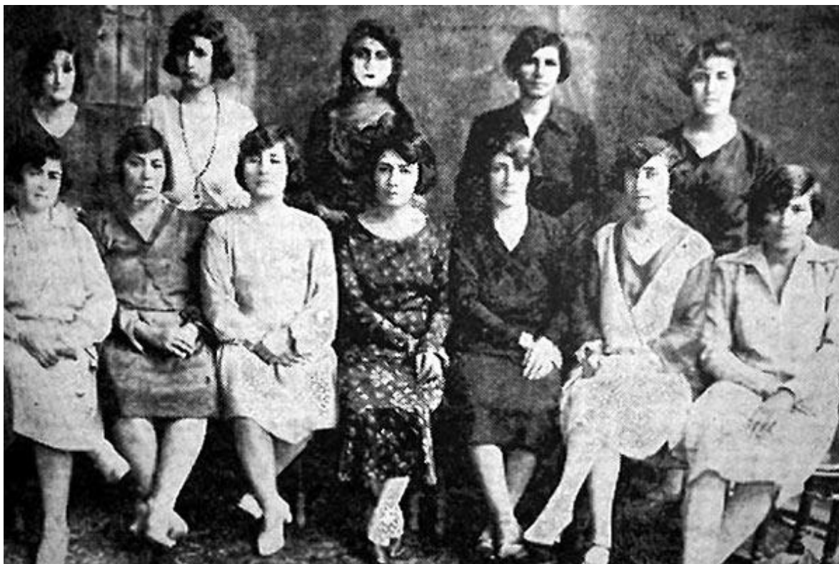
Obrázek 15 – ženy z Andžoman-e mochaddarát-e vatan 465