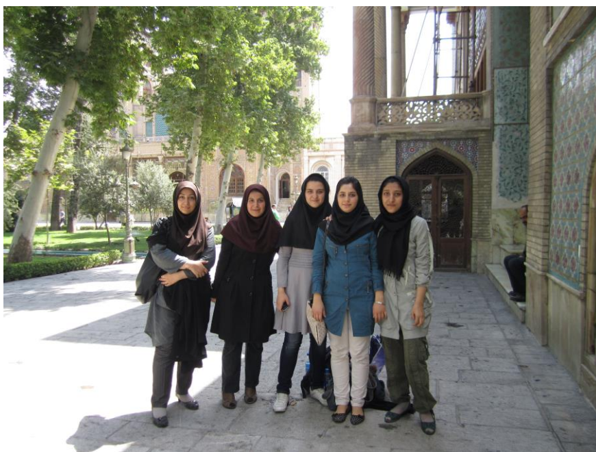
Obrázek 23 – Teherán 2011