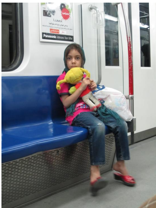
Obrázek 27 – holčička v teheránském metru, 2011