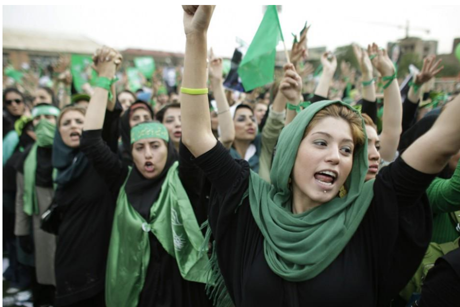
Obrázek 20 – demonstrace z tzv. zelené revoluce 2009, která následovala po prezidentských volbách 470