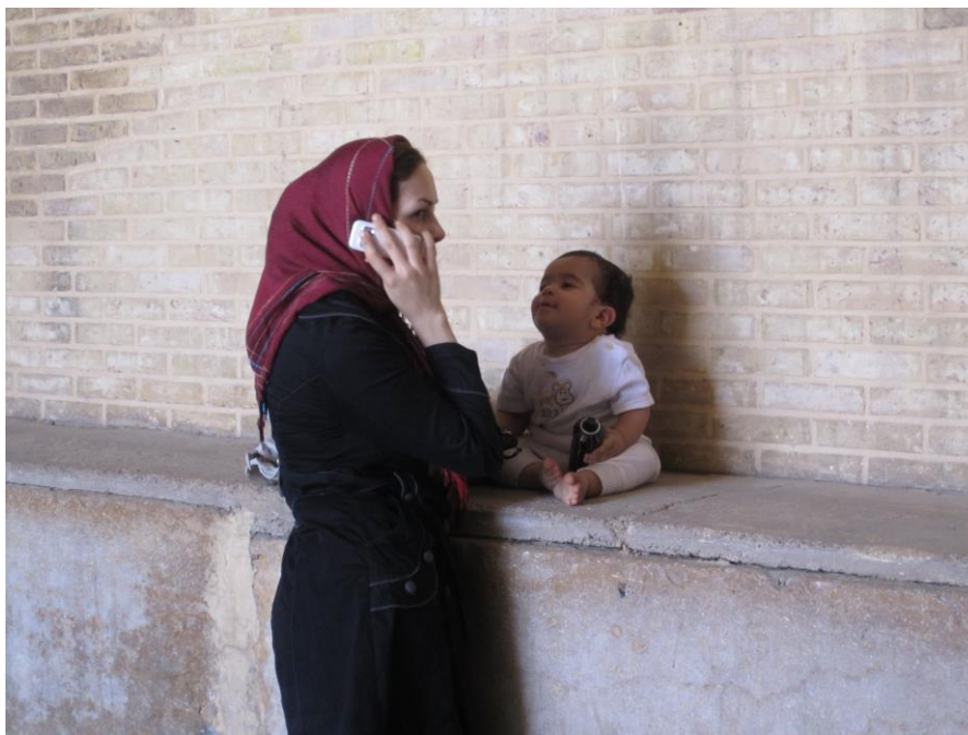
Obrázek 29 – Šíráz 2011