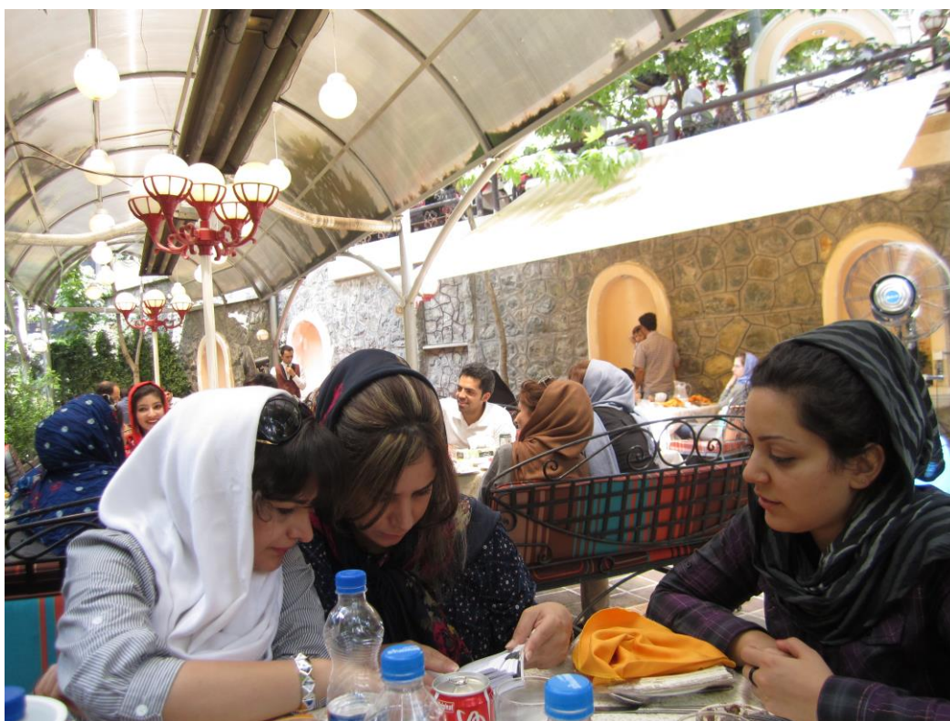
Obrázky 24, 25 – fotografie mých kamarádek, Teherán 2011