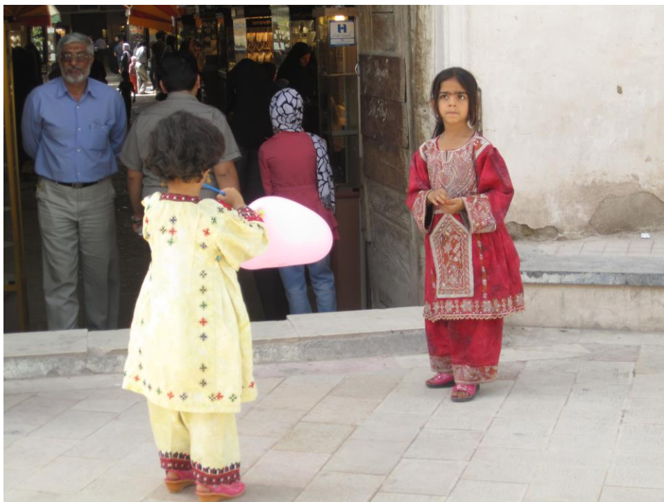
Obrázek 32 – Kermán 2011