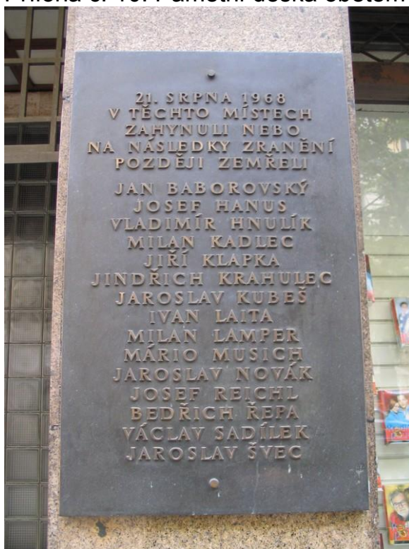
Příloha č. 10: Pamětní deska obětem v roce 1968