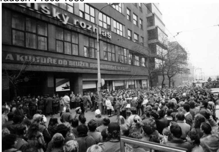
Příloha č.11: Demonstrace před budovou Československého rozhlasu na Vinohradech v roce 1989