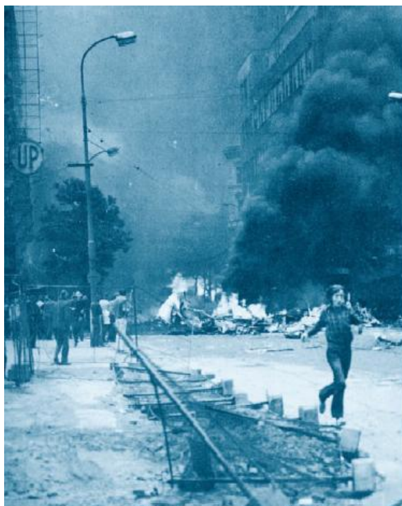
Příloha č.9: Náhled budovy rozhlasu při střetnutí s tanky