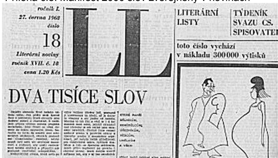
Příloha č.8: Manifest 2000 slov zveřejněný v novinách