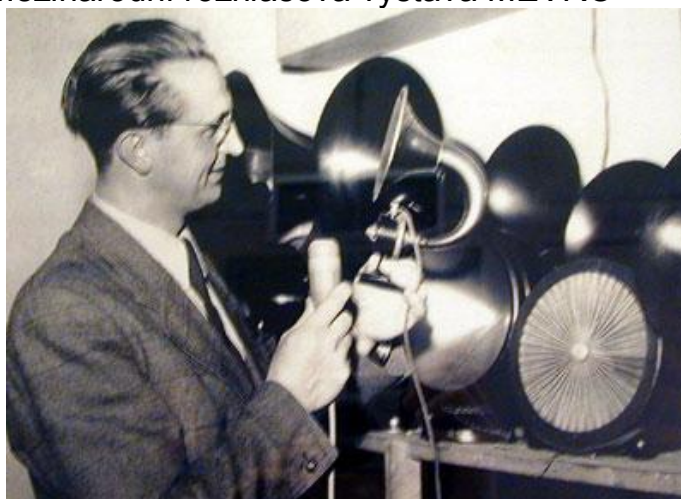
Příloha č. 7: Mezinárodní rozhlasová výstava MEVRO