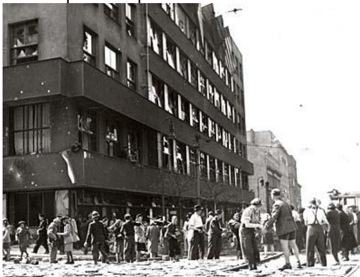
Příloha č.6: Květnové povstání před budovou Československého rozhlasu