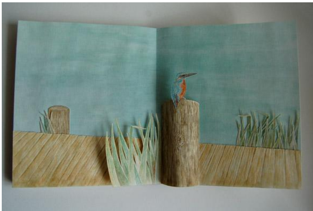
Příloha 10 - Ledňáček, 2014