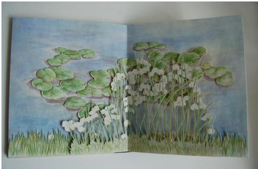
Příloha 7 - Plovoucí lekníny, 2014