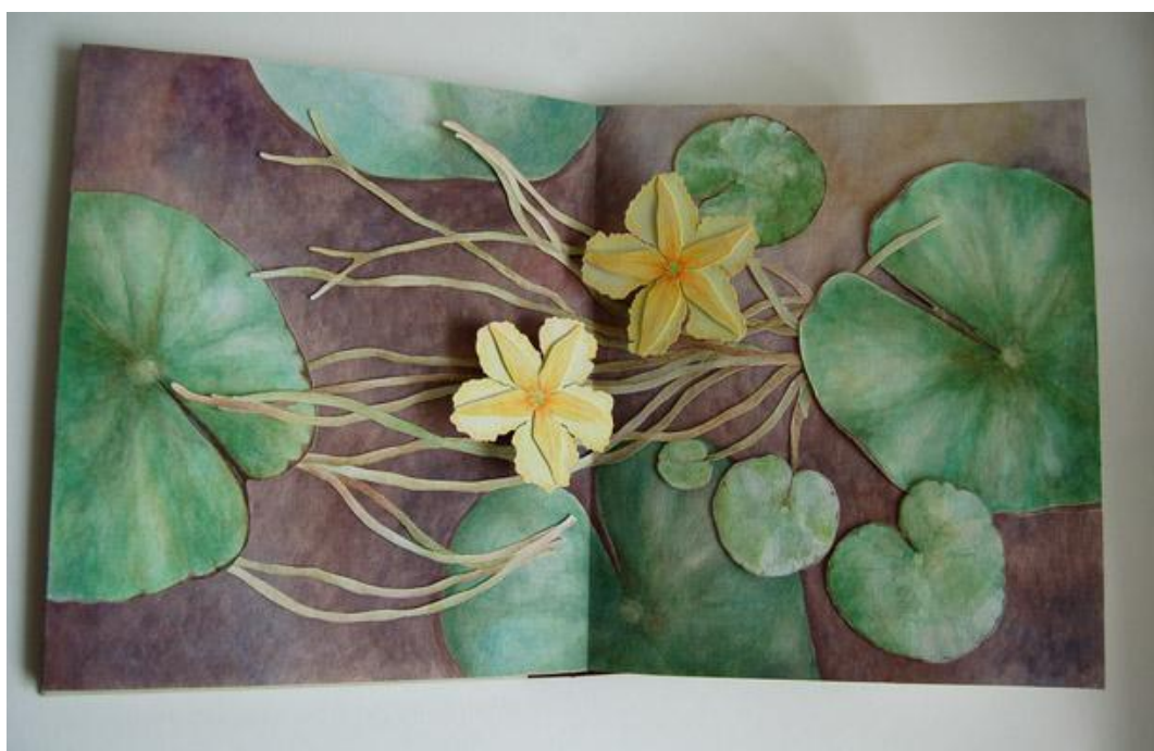
Příloha 8 - Kvetoucí lekníny, 2014