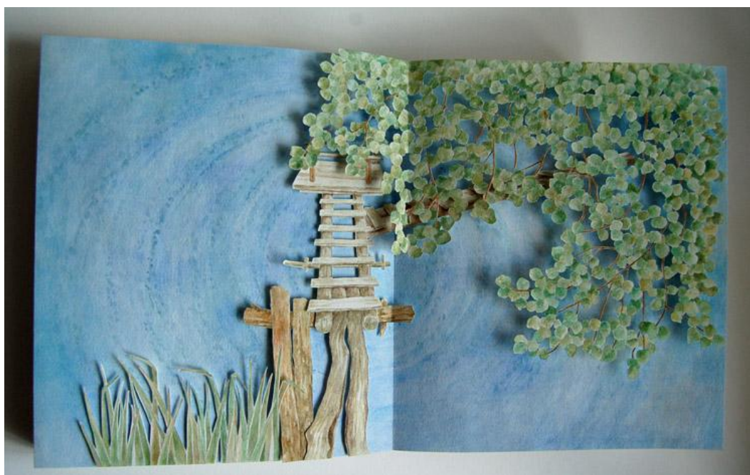
Příloha 14 - Lávka, 2014