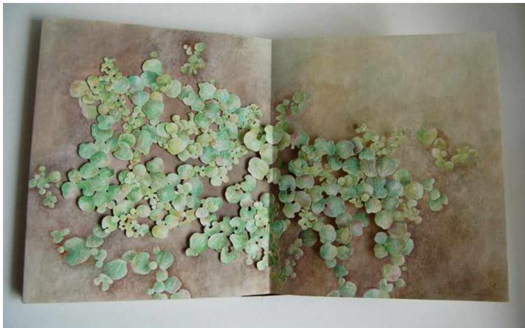
Příloha 9 - Na hladině, 2014