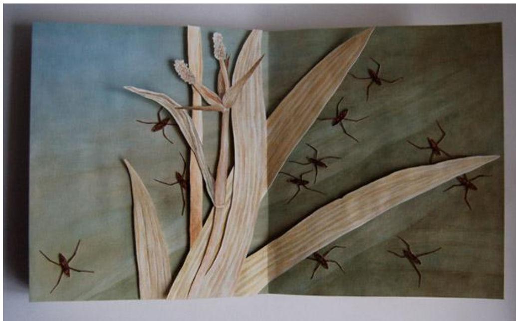
Příloha 13 - Vodoměrky, vlastní foto, 2014