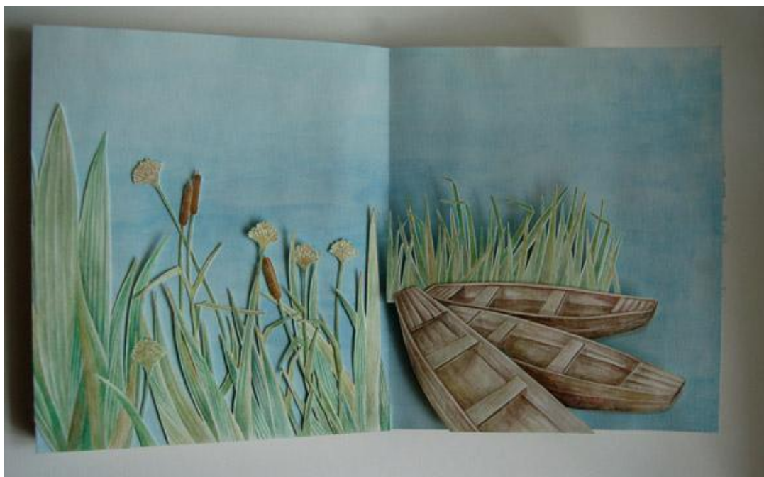
Příloha 11 - Lodky v rákosí, vlastní foto, 2014