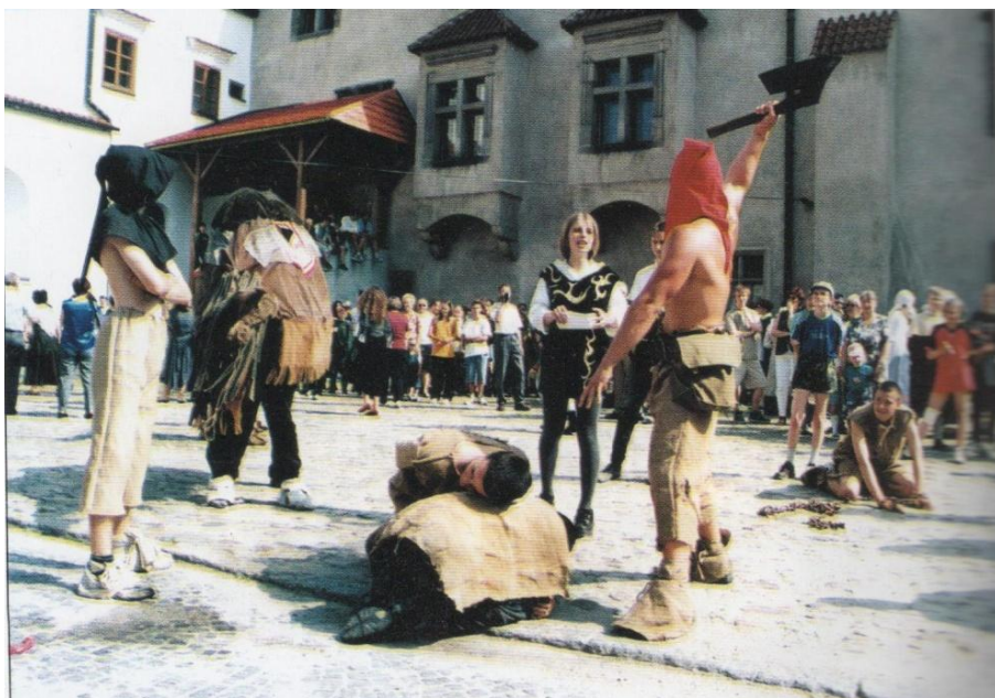
Příloha č. 20: Majáles z roku 2000 260