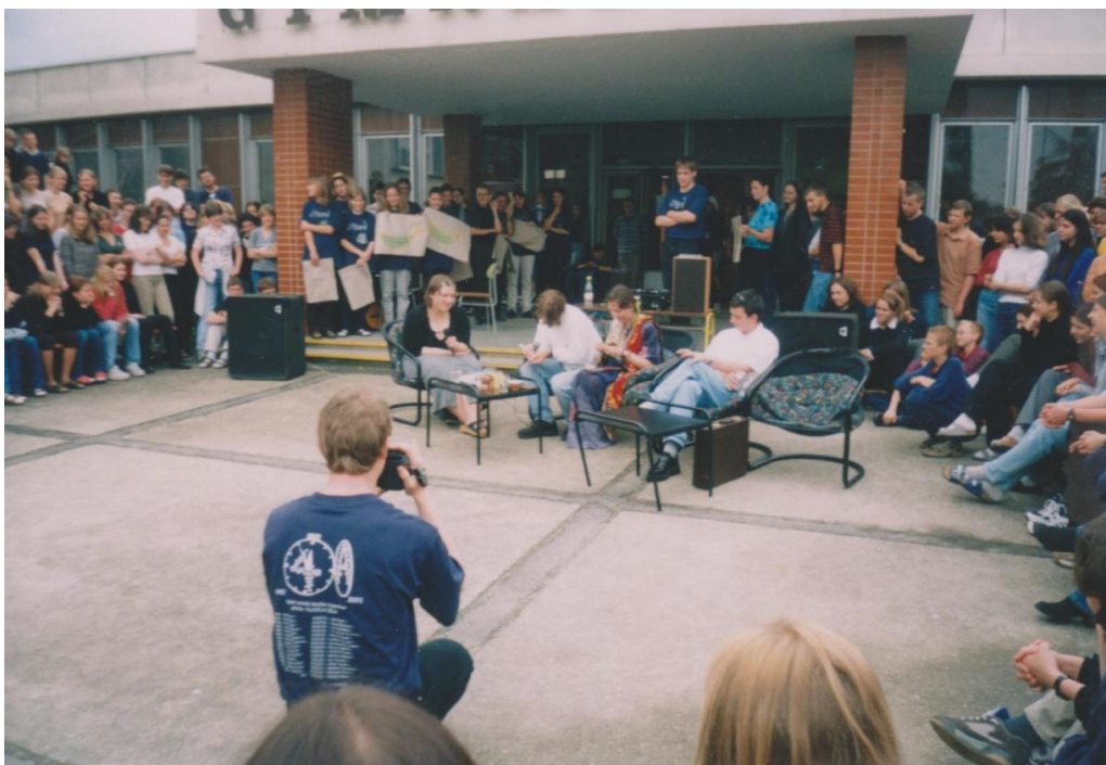
Příloha č. 16: Tzv. mazání třetích ročníků v roce 2010 256