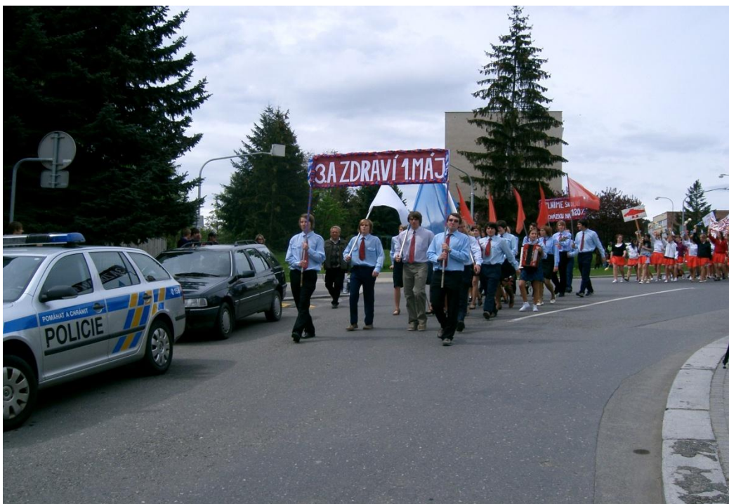
Příloha č. 22: Memento 262