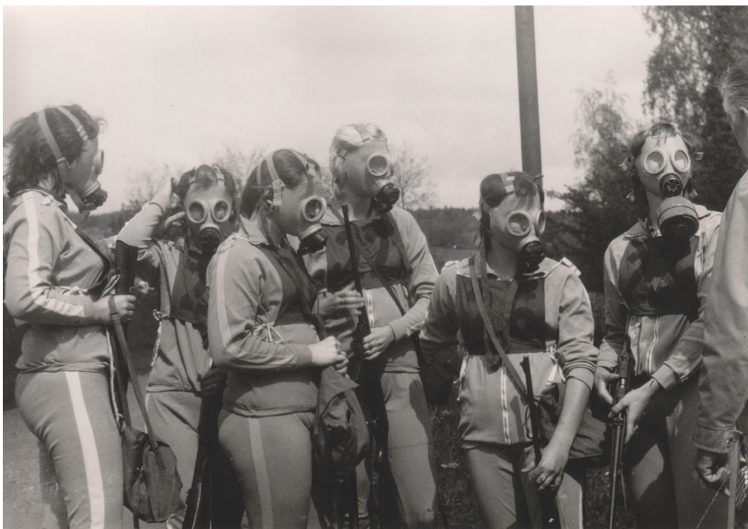
Příloha č. 10: Závod branné všestrannosti 250