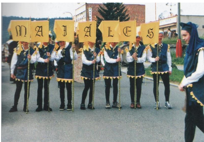
Příloha č. 19: Pozvánka na majáles z roku 2000 259

Šlicné panny, ctěné paní, ctihodní páni strakoničtí!