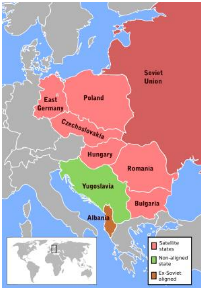
Příloha č. 1: Mapa států východního bloku [6]