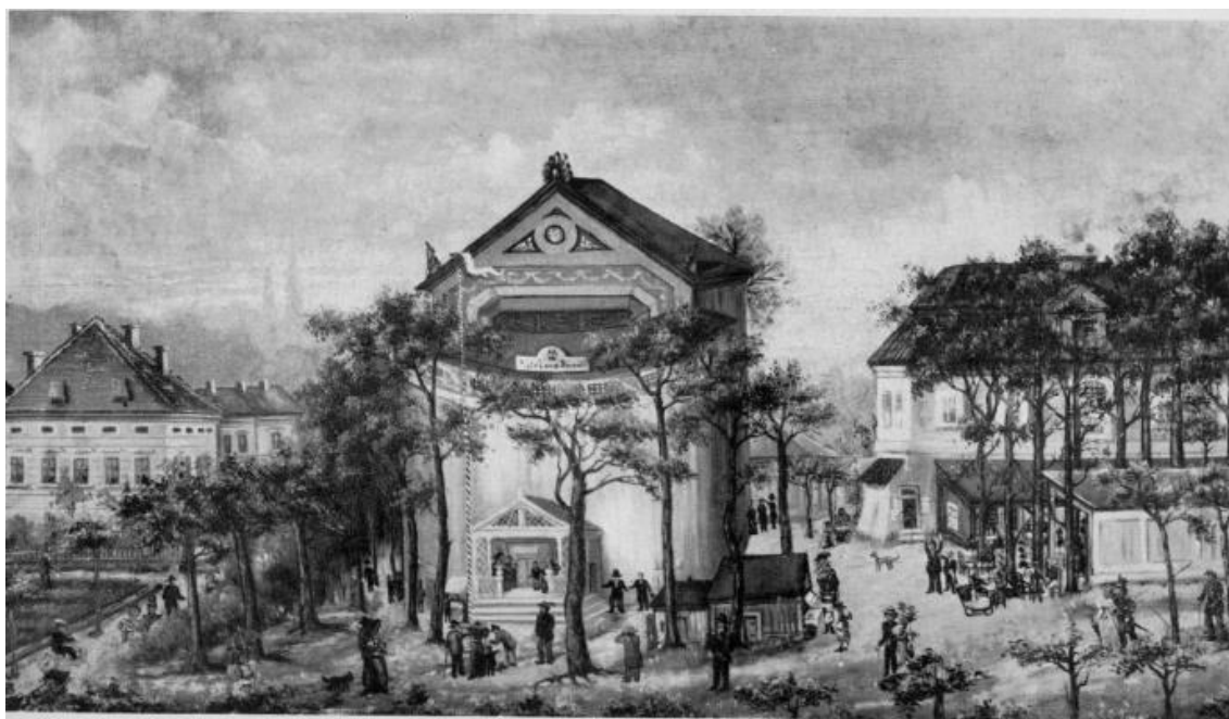
Obr. 7 Pištěkovo Letní divadlo na Královských Vinohradech