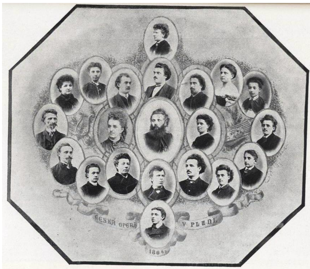
Obr. 4 Tablo souboru první české opery v Plzni