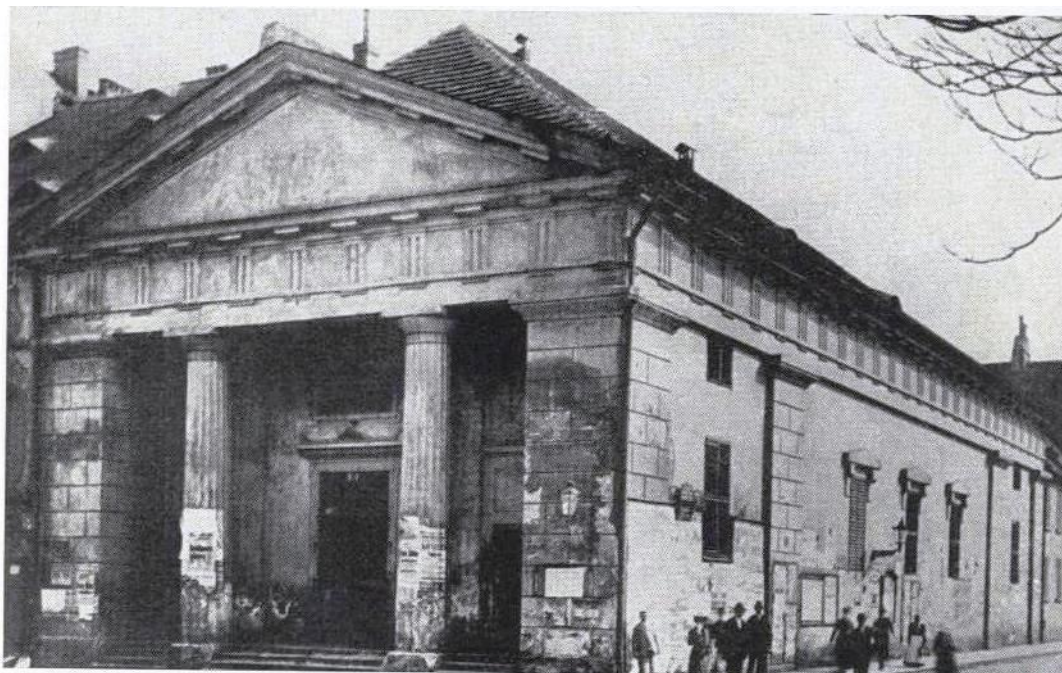
Obr. 1 Staré městské divadlo v Plzni