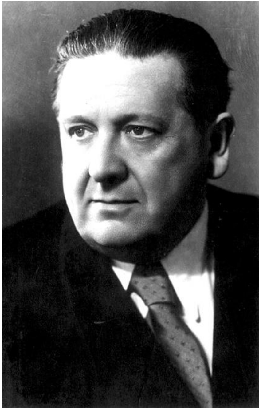
Obr. 6 Theodor Pištěk