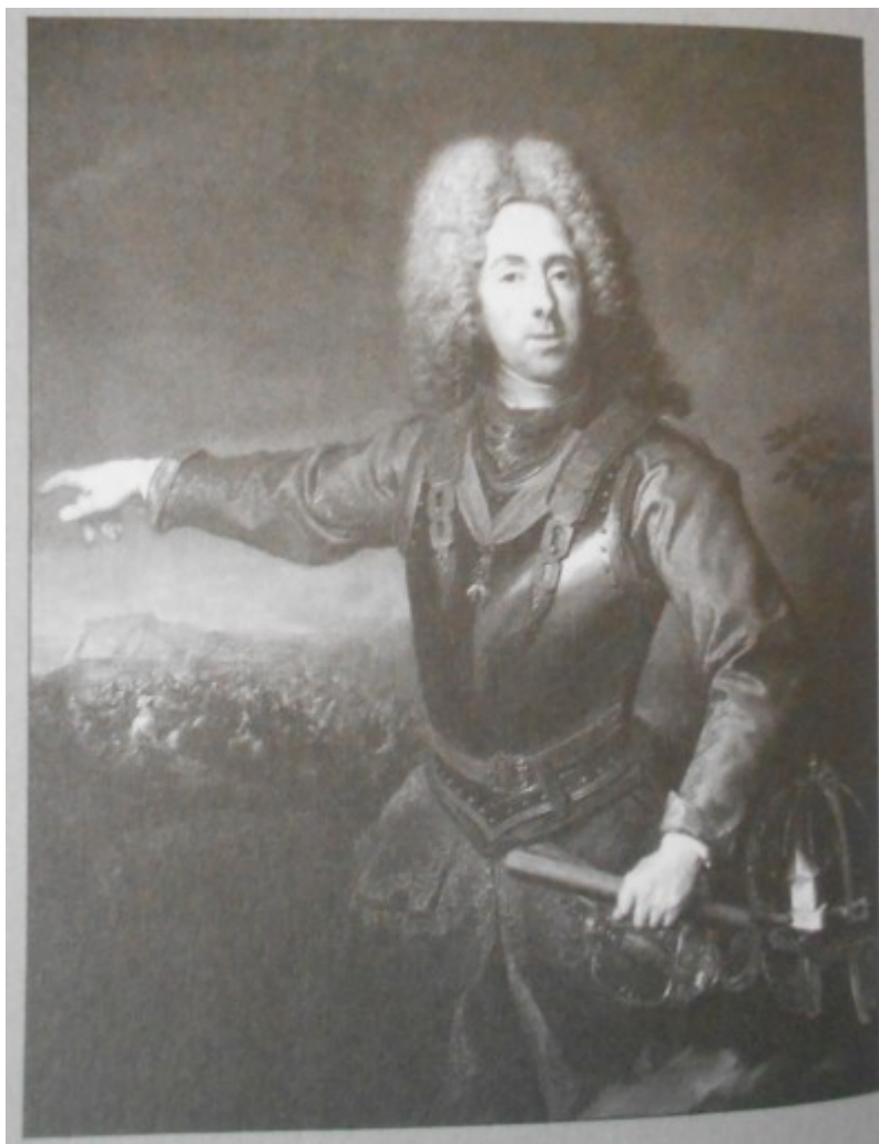
Kovařík. J., Ludvík XIV. : Život, doba a války krále Slunce , s. 484.