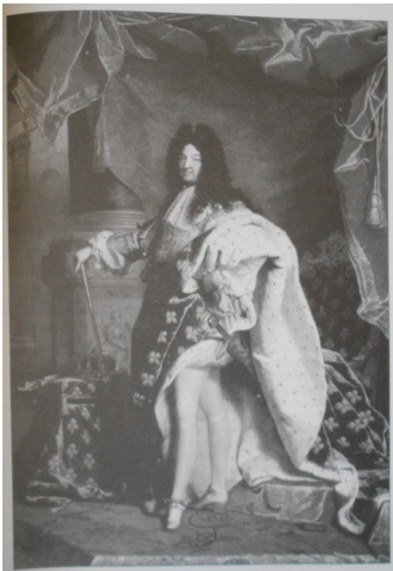
Kovařík. J., Ludvík XIV. : Život, doba a války krále Slunce , s. 535.