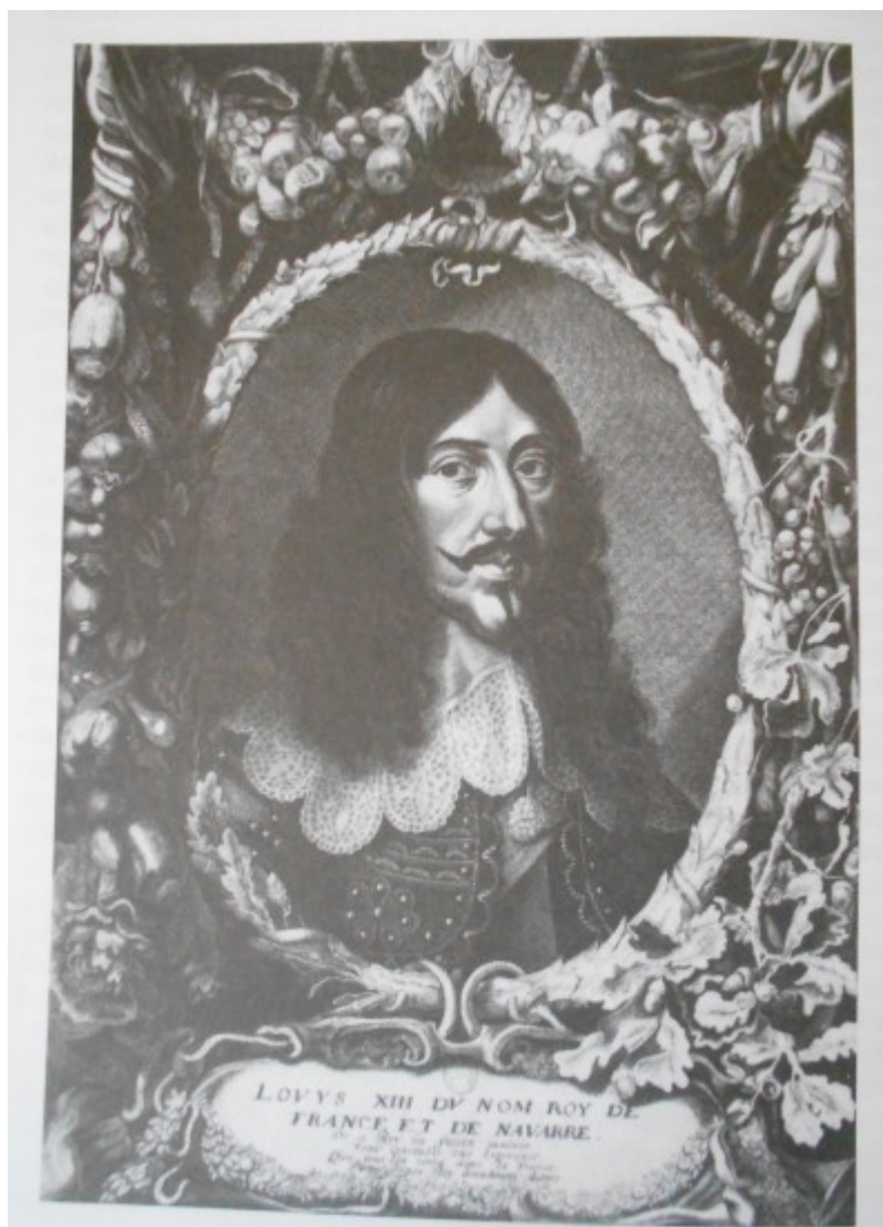
Hartmann, P. C., Francouzští králové a císaři v novověku , s. 164.