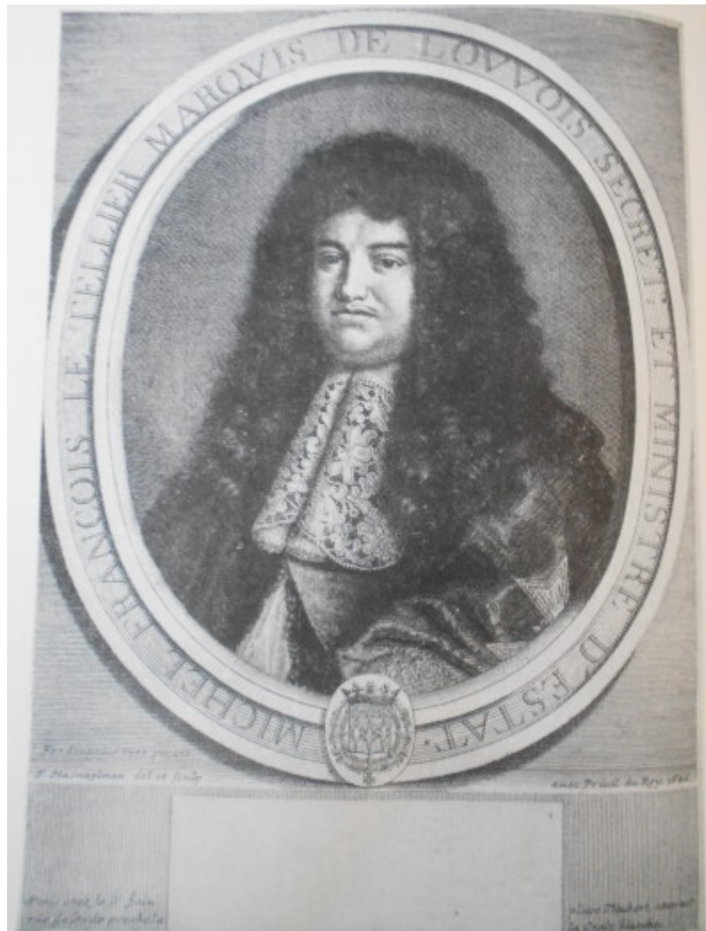
De Rouvroy, L., Memoirs on the Reign of Louis XIV, and the Regency.