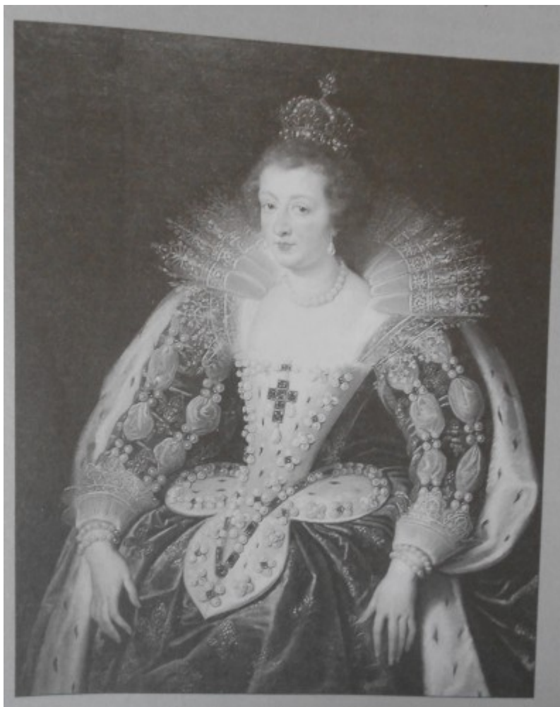
Kovařík, J., Ludvík XIV. : Život, doba a války krále Slunce , s. 33.