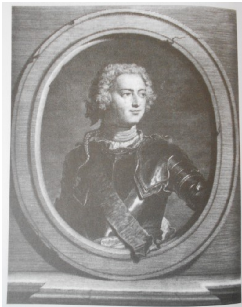
Kovařík. J., Ludvík XIV. : Život, doba a války krále Slunce , s. 224.