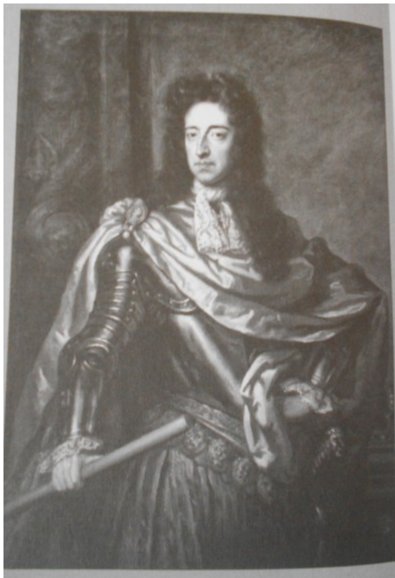
Kovařík. J., Ludvík XIV. : Život, doba a války krále Slunce , s. 262.