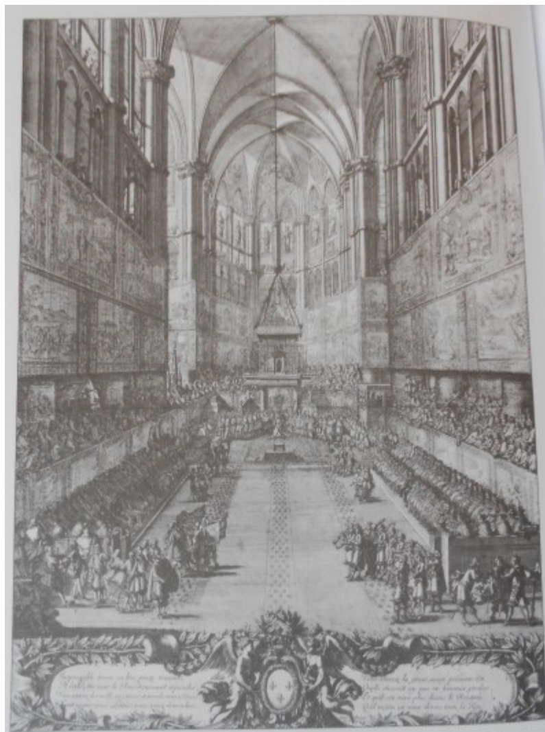
Kovařík. J., Ludvík XIV. : Život, doba a války krále Slunce , s. 128.