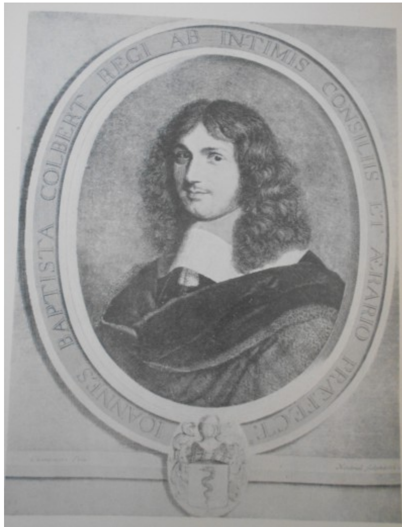
De Rouvroy, L., Memoirs on the Reign of Louis XIV, and the Regency.