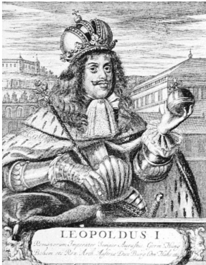
Woods, F. A., Mental and Moral Heredity in Royalty II. In: Popular Science Monthly Volume 61, s. 456.