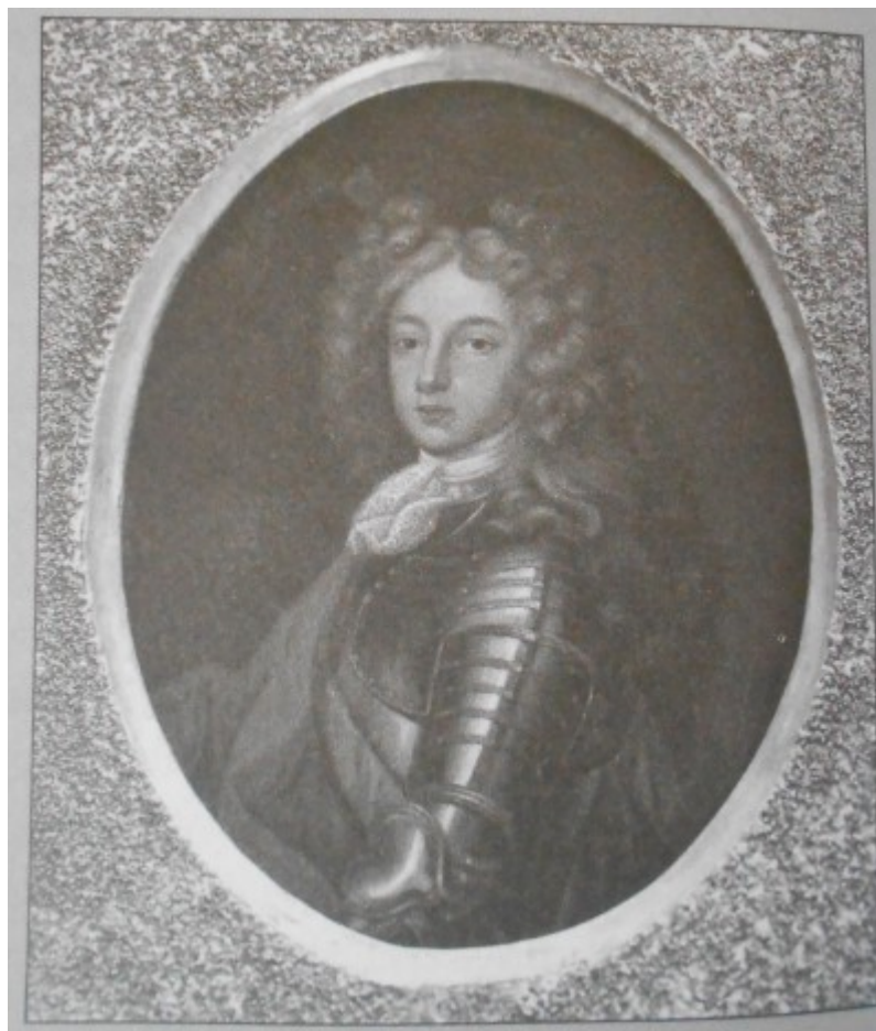
Kovařík. J., Ludvík XIV. : Život, doba a války krále Slunce , s. 440.