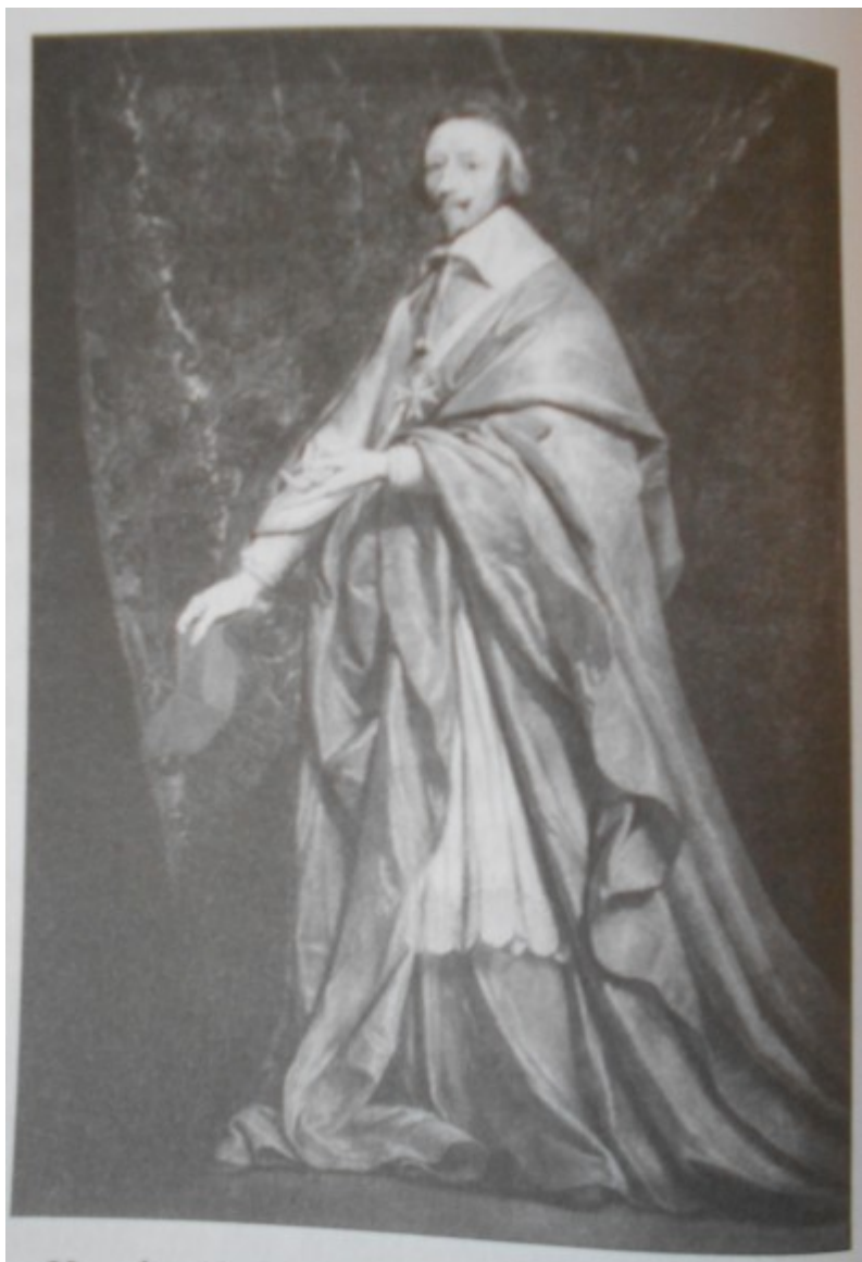
Kovařík. J., Ludvík XIV. : Život, doba a války krále Slunce , s. 24.