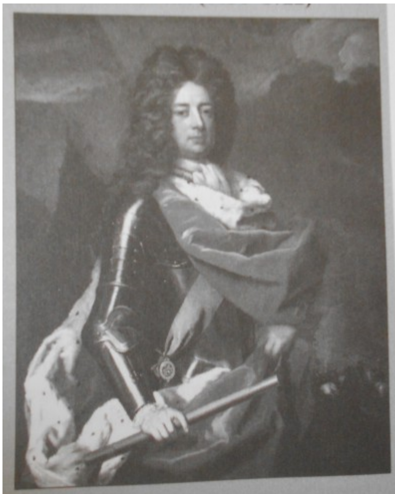
Kovařík. J., Ludvík XIV. : Život, doba a války krále Slunce , s. 457.