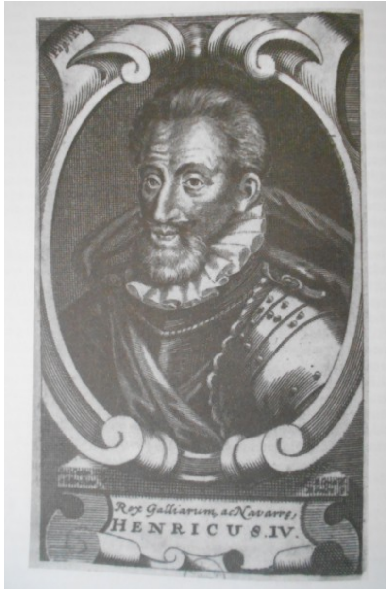
Hartmann, P. C., Francouzští králové a císaři v novověku , s. 136.