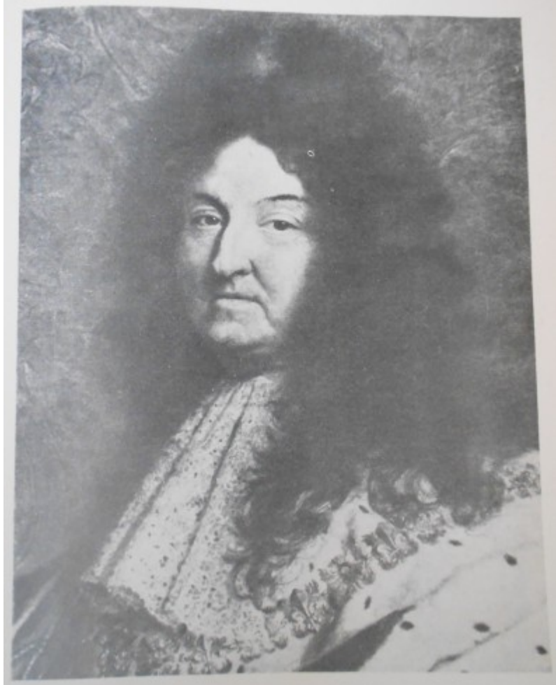
De Rouvroy, L., Memoirs on the Reign of Louis XIV, and the Regency.