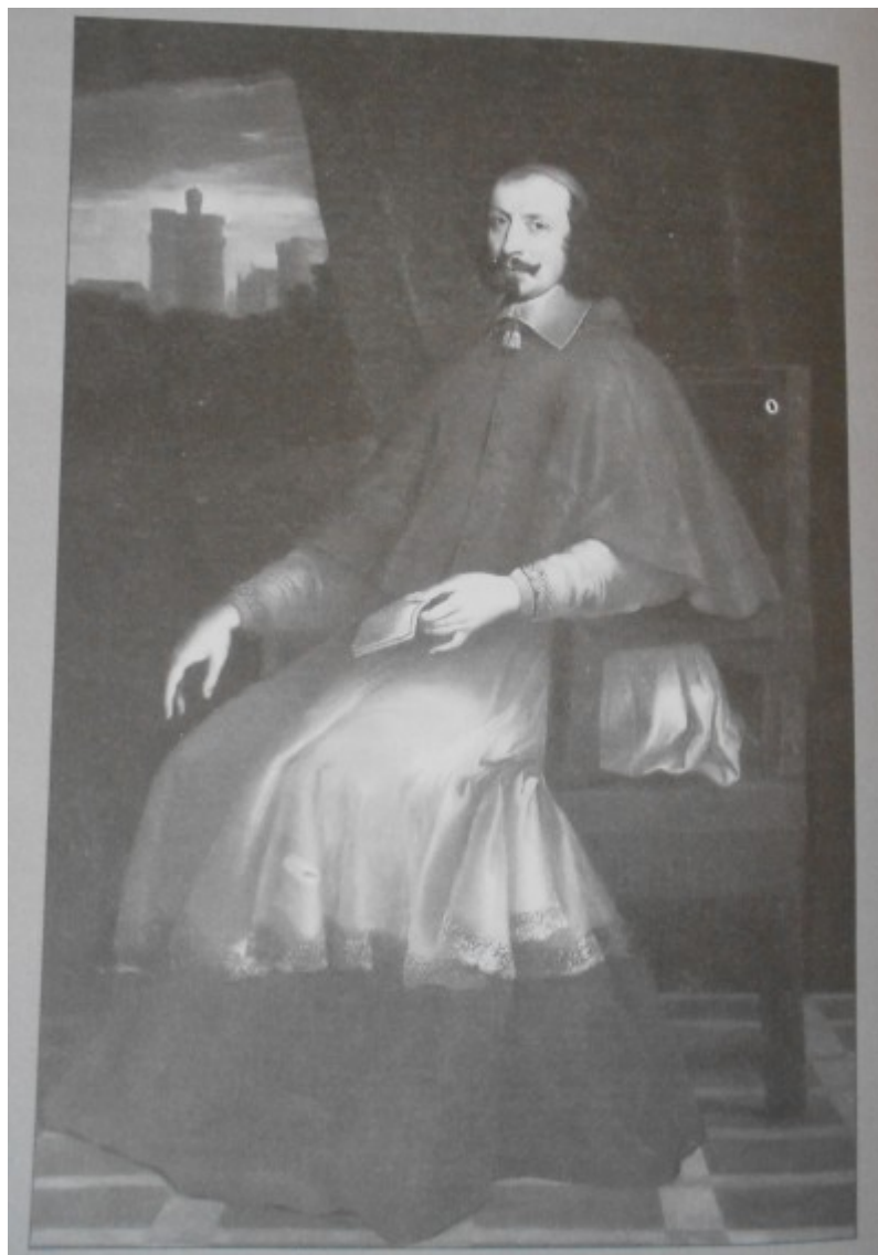
Kovařík. J., Ludvík XIV. : Život, doba a války krále Slunce , s. 128.