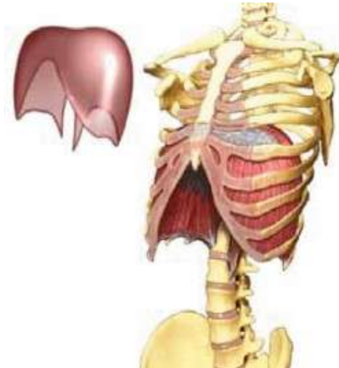
Obr.1: Uložení bránice v lidském těle

Plíce jsou orgánem, ve kterém dochází k výměně dýchacích plynů. Nadechujeme se do plic, ale pro správný nádech je důležitý nádech pomocí bránice. Její uložení v těle vidíte na obrázku č. 1.