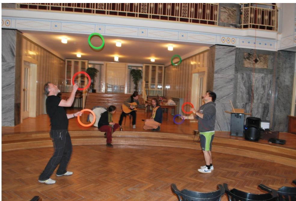
Obrázek 2 – Během otevřených cirkusových dílen pacienti zkoušejí žonglování i hudbu

v případě dobrého počasí snažíme umístit do venkovního prostoru v místě, kde se pacienti během vycházek nejvíce pohybují. Během cirkusových dílen mají pacienti možnost vyzkoušet si veškeré cirkusové náčiní, půjčit si hudební nástroje, naučit se kouzlo. Není neobvyklé, když pacienti nějakou disciplínu zvládají lépe než cirkusový tým. Konkrétně využíváme žonglovací míčky, šátky, kruhy, roztáčecí talíře, diabola, flowersticky, poi-poi a další žonglérské disciplíny. Dále využíváme kouzelnických triku jako je mizení, přeměna apod. Na cirkusových dílnách je také prostor pro přípravu čísel dramatických, většinou sehrání komické scény za využití velkých loutek zvířat. Důležitá jsou interně pojmenovaná tzv. 'quick success' čísla. Jedná se jednodušší triky, které pacientům ukážou, že efektní a zajímavé neznamena pokaždé měsíce tréninku. Skrze tyto triky se pak pacient často dostane k složitějším žonglérským technikám. Mezi taková čísla řadíme především žonglérské talíře, jejichž zvládnutí průměrně trvá v rozmezí pěti minut až jedné hodiny. Každému, kdo o nějaké cirkusové číslo projeví zájem, je dán prostor, aby s ním vystoupil v závěrečném představení. Zároveň se snažíme připravit příležitosti pro pacienty, kteří vědí pouze to, že chtějí vystoupit. Kromě tréninku a stavby jednotlivých čísel si během cirkusových dílen pacienti volí kostýmy z našeho kostýmového fondu. Cirkusová dílna je také prostorem k sociálnímu kontaktu, kdy si pacienti mohou povídat s někým, kdo je mimo léčebnu.