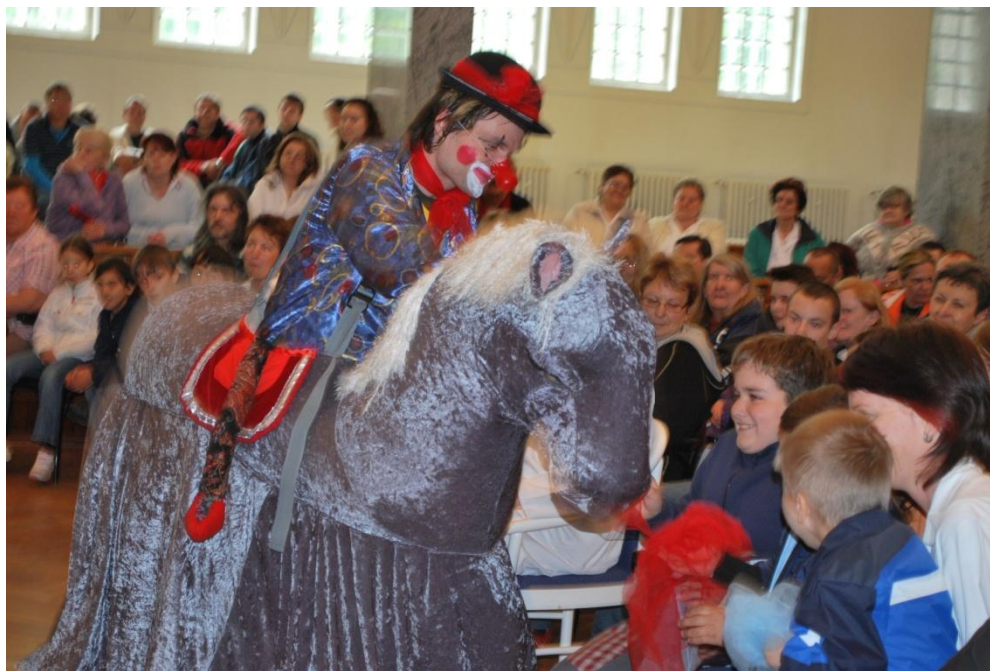
Obrázek 3 – Závěrečné představení se hraje pro publikum z léčebny i mimo ni. Účinkující v loutce koně při kontaktu s publikem.