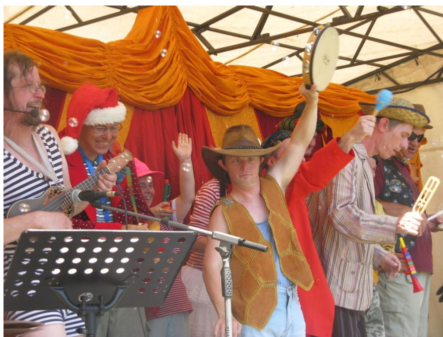
Obrázek 4 – Během závěrečné písně má možnost dostat se na pódium každý pacient.