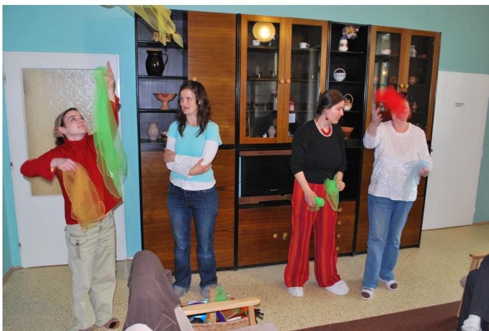
Obrázek 1 - Sociální pracovnice z týmu Cirkusu Paciento ukazuje pacientkám žonglování s šátkami přímo na oddělení během motivační návštěvy

V každé léčebně tým cirkusu navštíví co největší počet oddělení. Motivační návštěvu představuje přibližně hodinová cirkusová dílna pro přítomné pacienty z jednoho oddělení (výjimečně dochází ke spojení více oddělení). Během motivačních návštěv pacientům představujeme koncept cirkusu a možnost zapojit se do přípravy a realizace představení. Důraz klademe na dobrovolnost a na motivaci prostřednictvím vzbuzení zájmu o nabízené aktivity. Těmi jsou jednotlivé cirkusové prvky. Pacientům předvádíme různé žonglovací techniky (například cirkusové talíře, žonglovací šátky, míčky), kouzelnické triky a návštěvu zakončujeme hudbou, společným zpěvem. Pacienti dostávají prostor k vyzkoušení si všech cirkusových aktivit (v rámci toho, co jsme schopni unést a na oddělení přinést), vybírají si skladby v hudebním bloku, jsou jim rozdány nástroje apod.