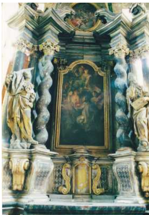
Hlavní oltář se sochami sv. Vojtěcha (vpravo) a sv. Václava (vlevo) v zámecké kapli sv. Jana Nepomuckého