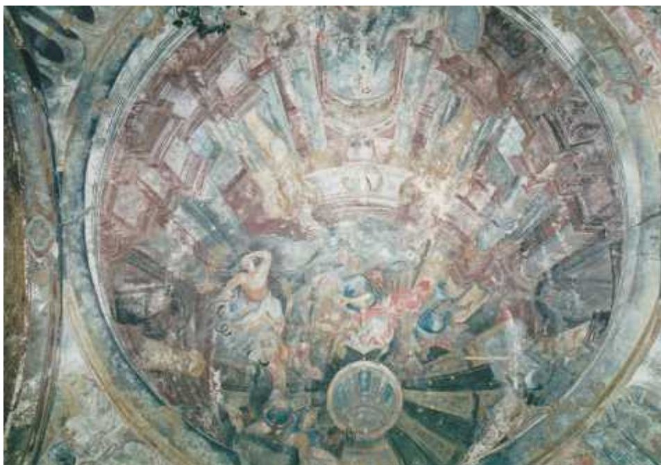
Freska „Apoteóza sv. Jana Nepomuckého“