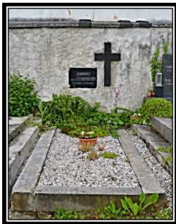
Hrobka rodu Schönborn