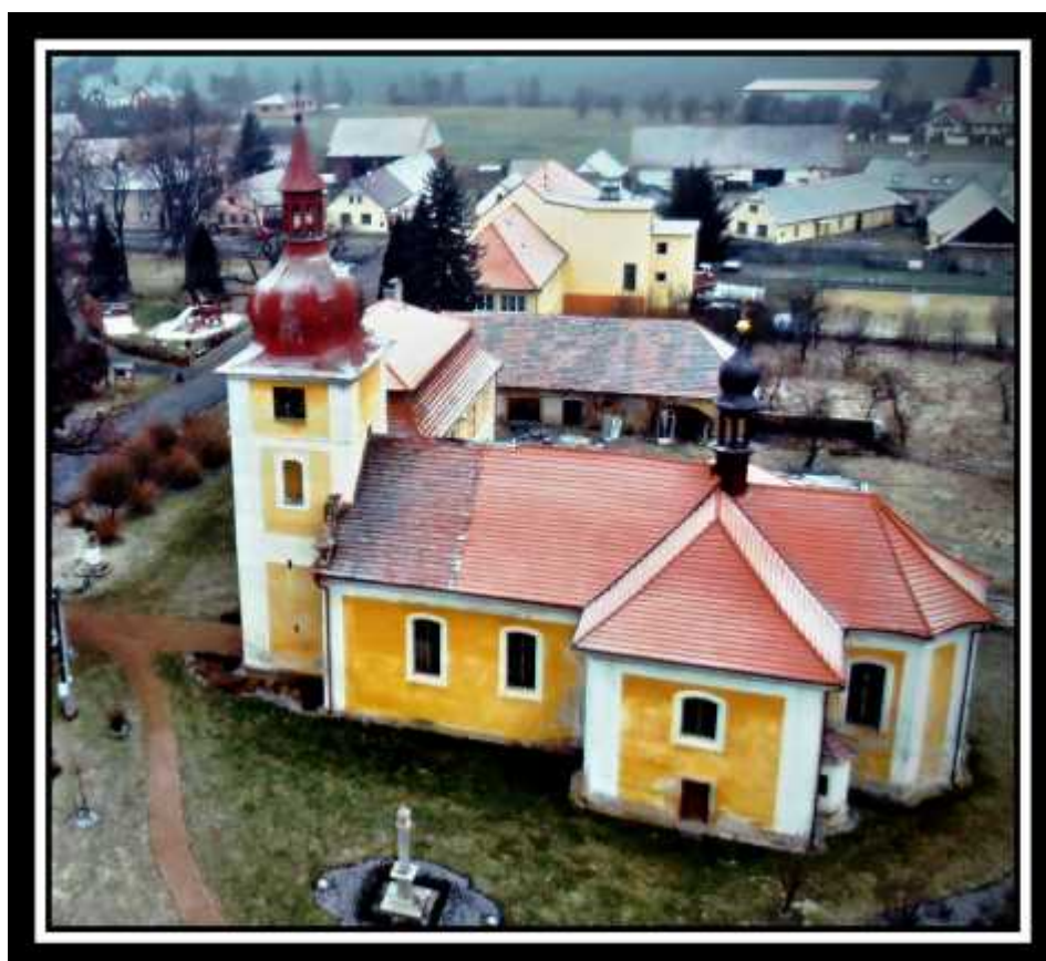
Kostel sv. Petra a Pavla v Dolní Lukavici