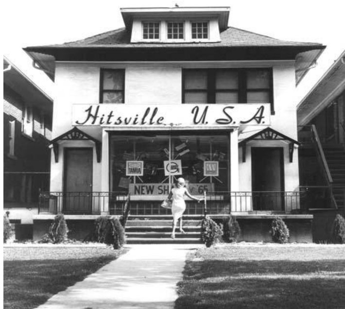
Obrázek č. 1: Hitsville U.S.A.