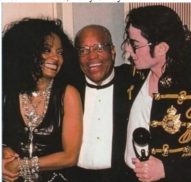
Obrázek č. 10: Diana Ross, Berry Gordy a Michael Jackson, rok 2005