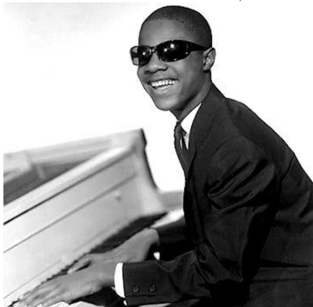
Obrázek č. 4: Little Stevie Wonder, rok 1963

(Zdroj: http://www.steviewonder.org.uk/ )