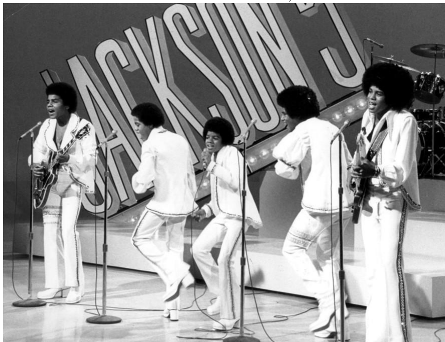
Obrázek č. 9: The Jackson 5, rok 1972