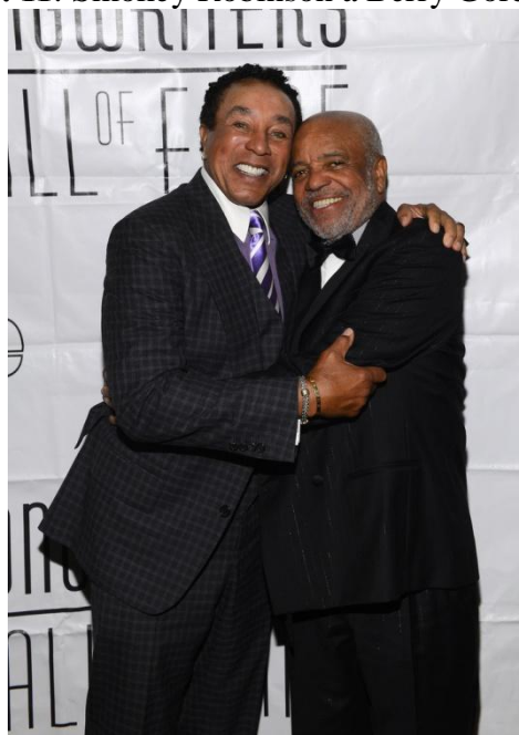
Obrázek č. 11: Smokey Robinson a Berry Gordy, rok 2013