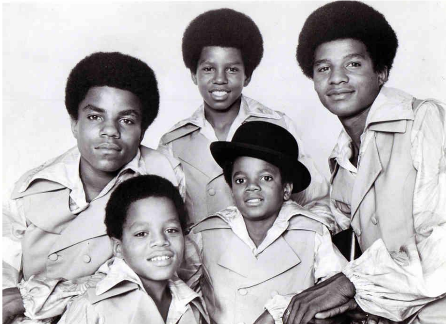
Obrázek č. 7: The Jackson 5 ve studiu, rok 1969