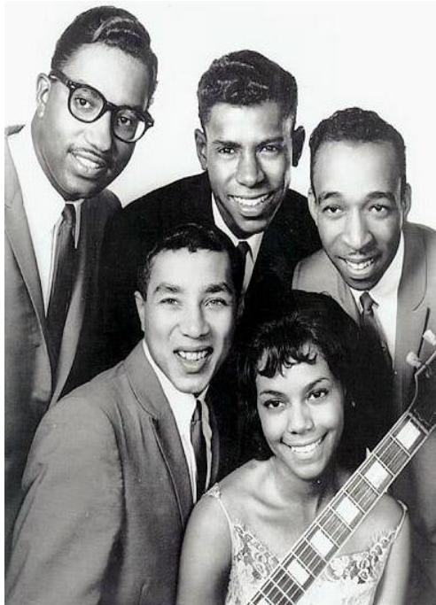
Obrázek č. 3: The Miracles, rok 1962