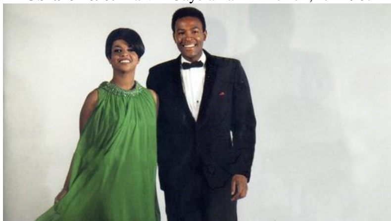
Obrázek č. 6: Marvin Gaye a Tammi Terrell, rok 1967