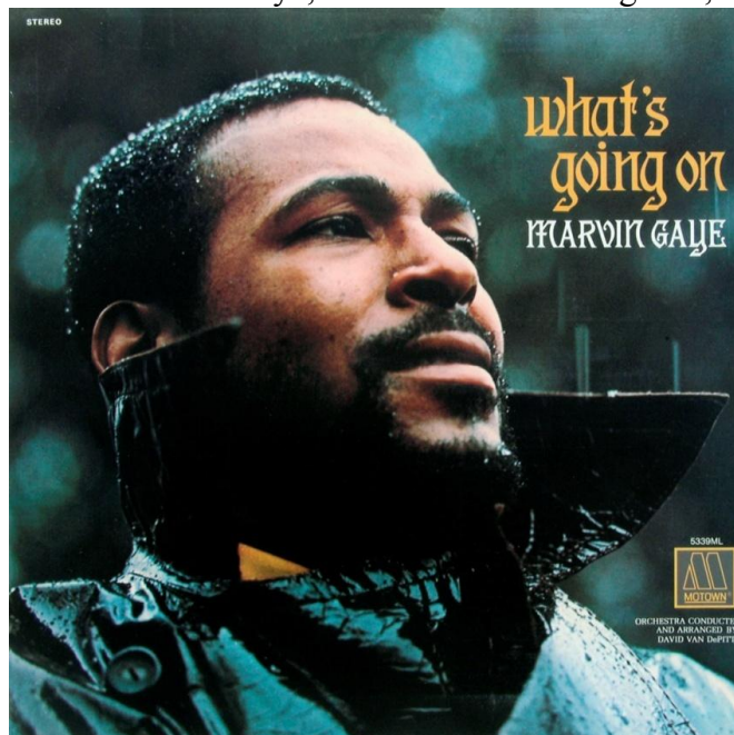
Obrázek č. 8: Marvin Gaye, album "What's Going On", rok 1971