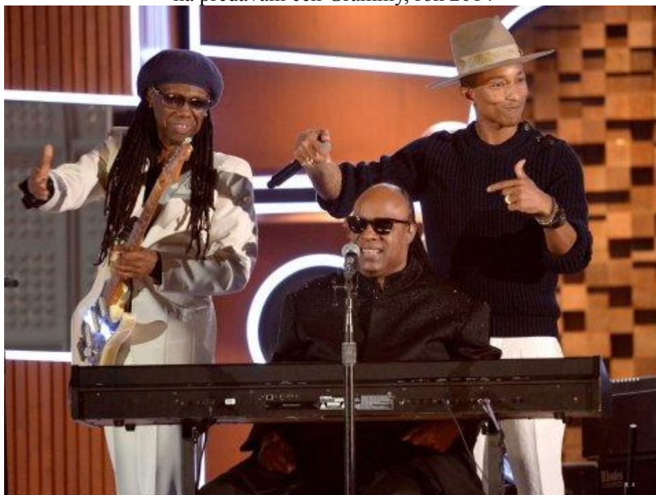
Obrázek č. 12: Stevie Wonder, Pharrell Williams a Nile Rodgers při společném vystoupení na předávání cen Grammy, rok 2014