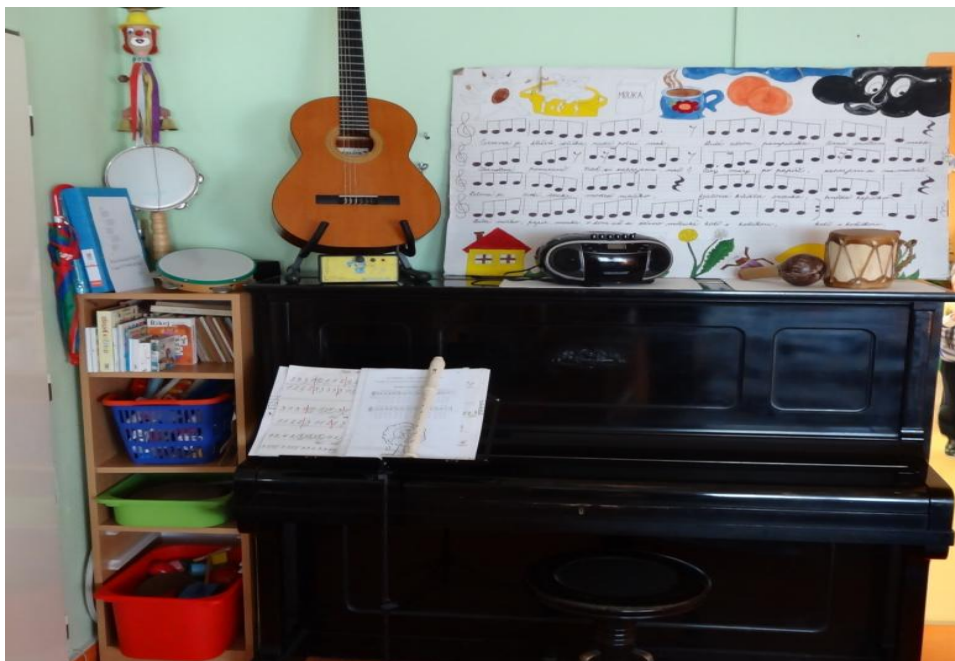
Obrázek 01 Hudební koutek ve třídě Berušek