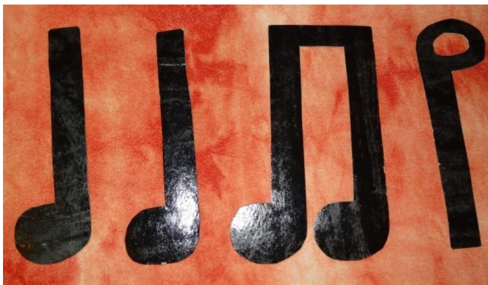
Obrázek 03 Rytmický model ke hře Naše rodina, k příloze A/01