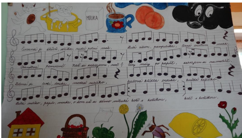
Obrázek 02 Grafické znázornění k písni Barvičky