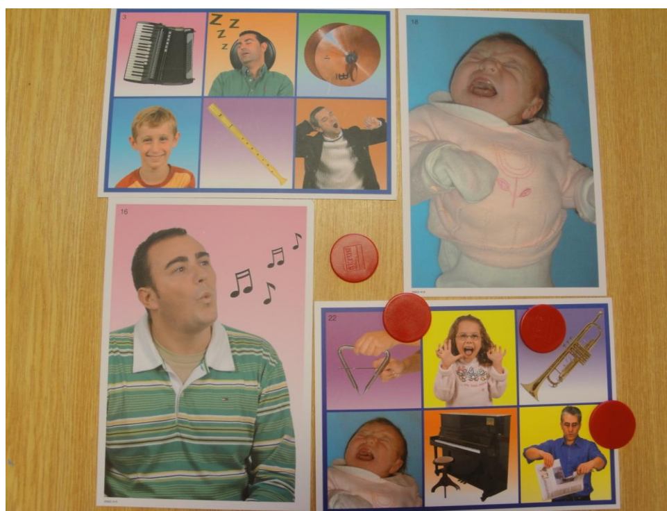
Obrázek 04 Hra Bingo, archiv I.U.