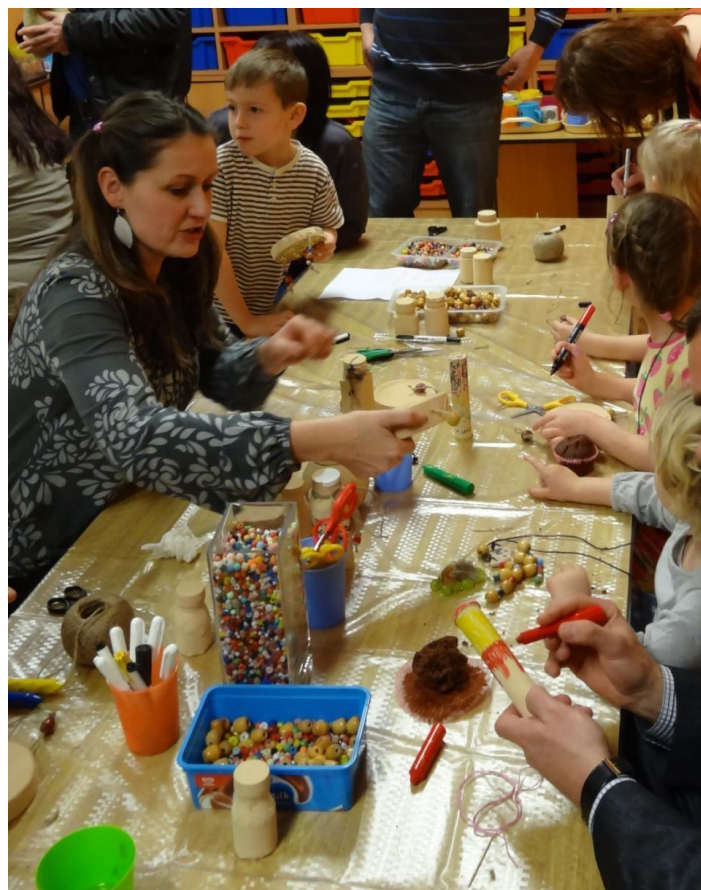
Obrázek 06 Společné setkání s rodiči, výroba rytmických nástrojů, leden 2014, archiv I.U.