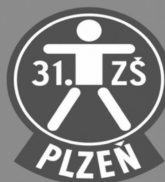
Obr. 4. Pavlův projekt

odpovědět na otázky týkající se základních znalostí a dovedností vektorové grafiky. Byl schopen využít předchozích znalostí z učiva informatiky pro správné odpovědi v testových otázkách.