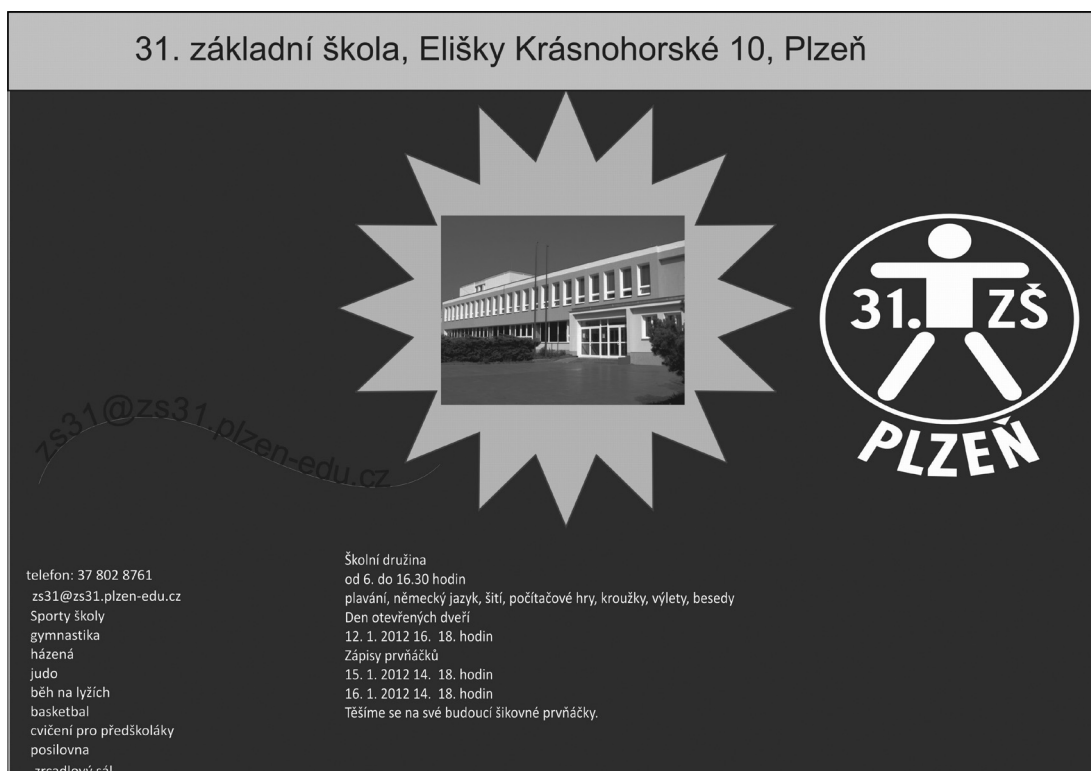
Obr. 5. Michalova závěrečná práce

pasivně. Nevěděla-li, jak řešit danou úlohu, vyčkávala na příchod pedagoga. Byla extrémně tichá, komunikovala jen na vyzvání.