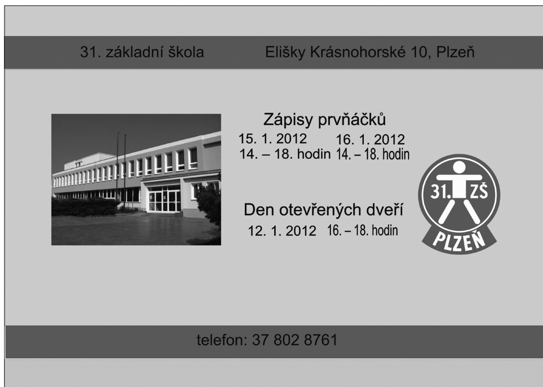
Obr. 6. Veroničina závěrečná práce

Závěrečný test: Veronika vypracovala test. Získala 17 bodů z 34 možných bodů. Byla schopna správně odpovědět na otázky týkající se základních znalostí vektorové grafiky. Nedokázala správně odpovědět