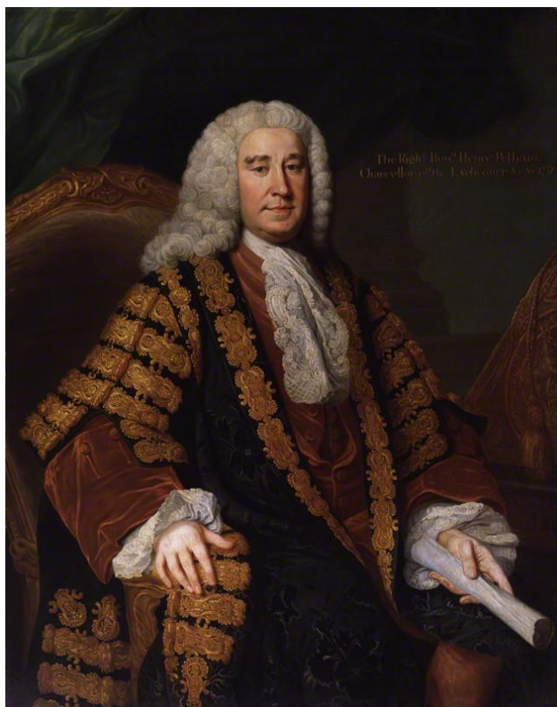
Henry Pelham (* 1694 † 1754)

http://www.bbc.co.uk/arts/yourpaintings/paintings/john-carteret-16901763-2nd-earl-granville-217145 [5. dubna 2015].