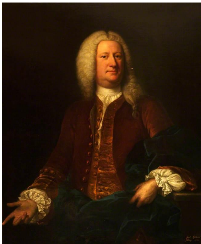
John Carteret (* 1690 † 1763)