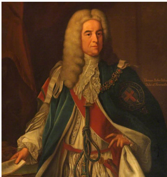
Thomas Pelham-Holles, vévoda z Newcastleu (*1693 † 1768)