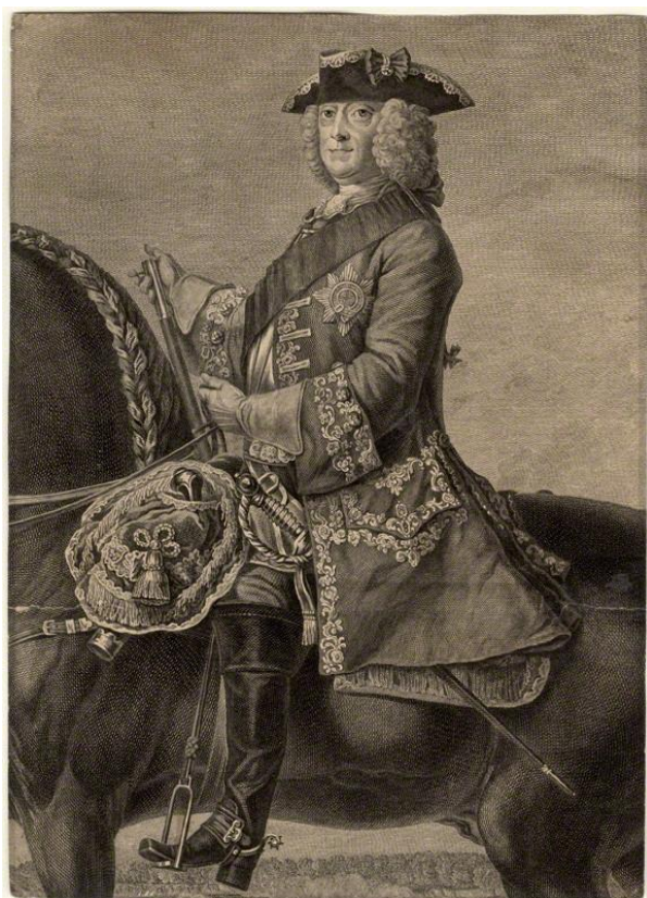
Jiří II. (*1683 † 1760)