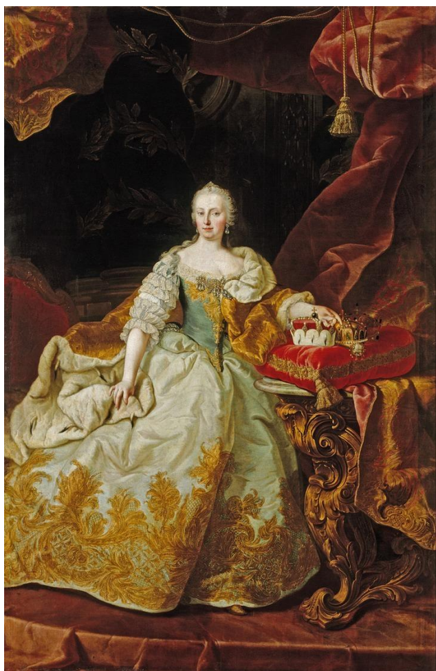
Marie Terezie (* 1717 † 1780)