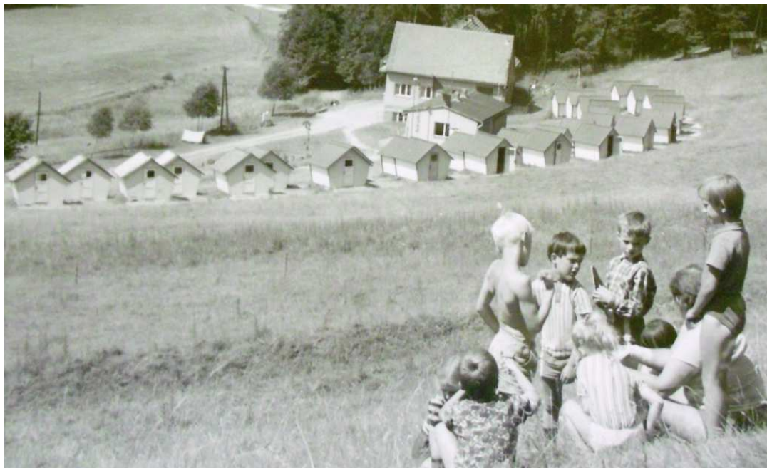
Příloha č. 24: Pionýrský tábor Spálený mlýn u Sedlečka 24