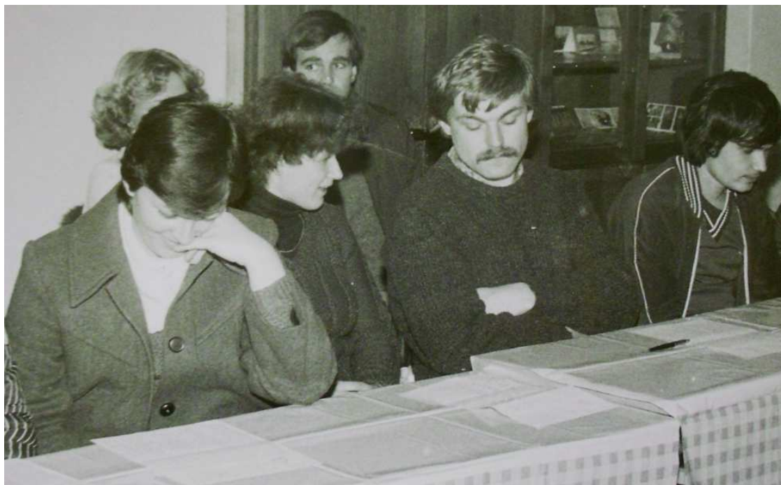
Příloha č. 26: Závod dvojic v rámci dne Pohádkový les 26