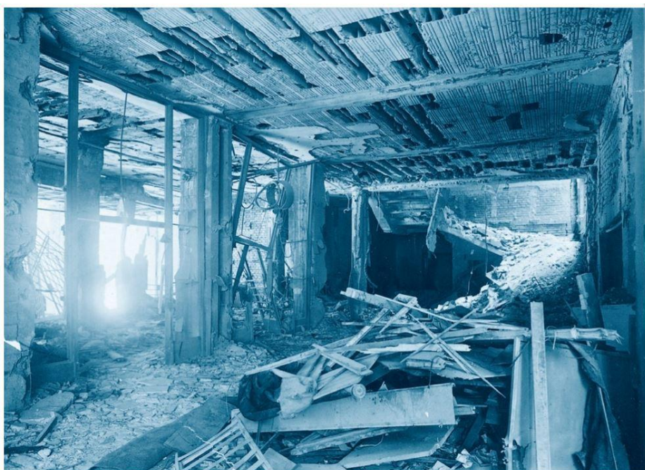
Hala rozhlasu po zásahu letecké pumy