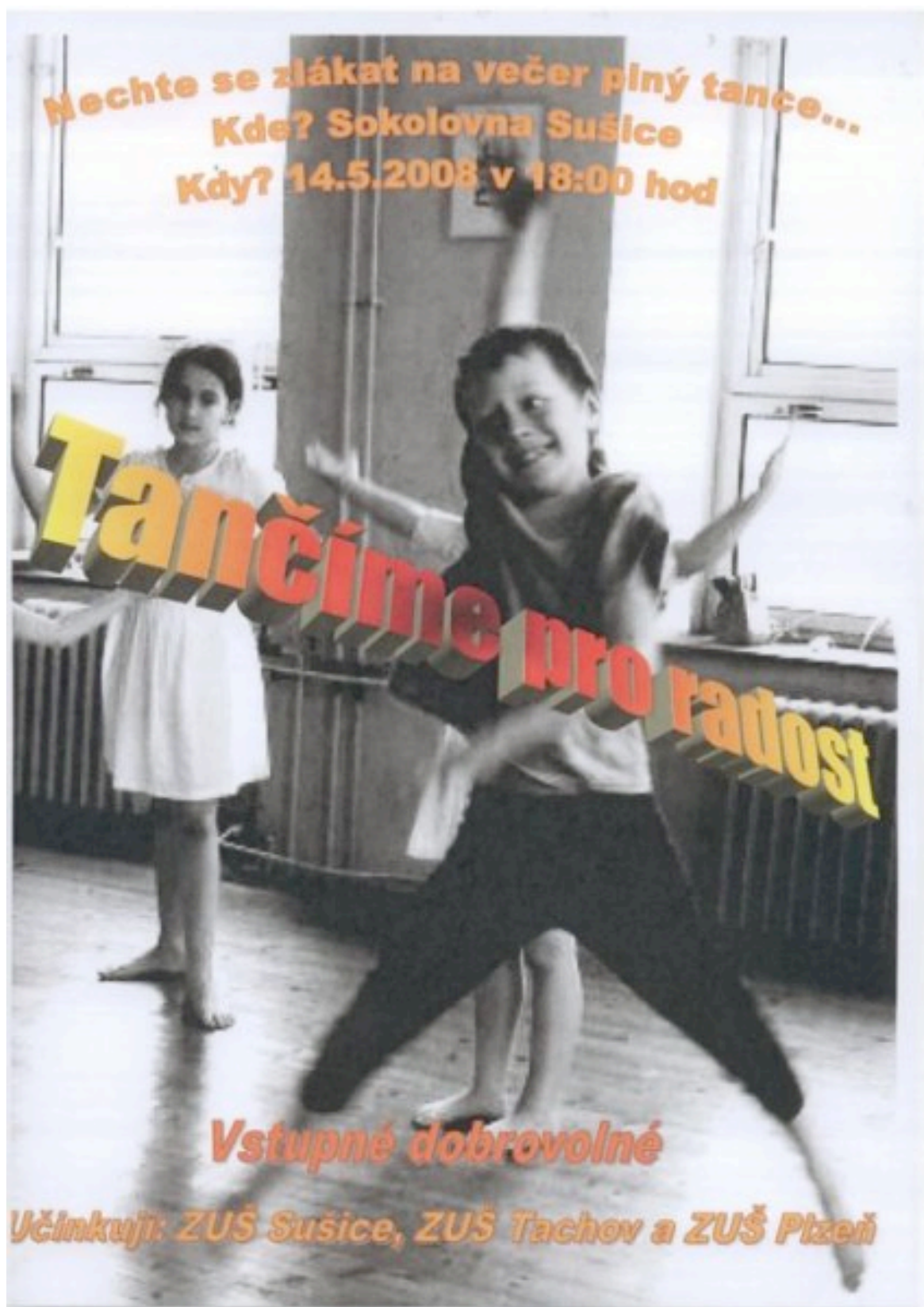
Příloha 5: Plakát – Tančíme pro radost 2008