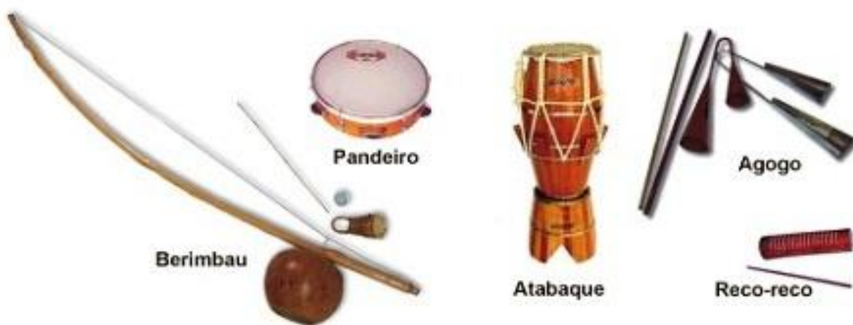
obr. 3 – Hudební nástroje používané v capoeiře