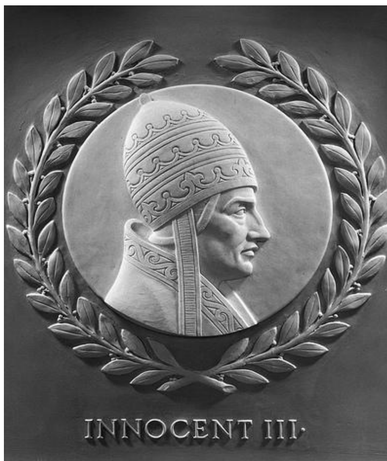
Obr.3 Portrét Inocence III.