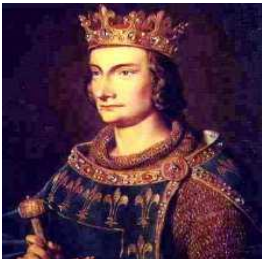
Obr.5 Filip IV. Sličný