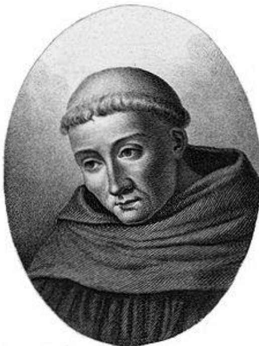
Obr.2 Bernard z Clairvaux