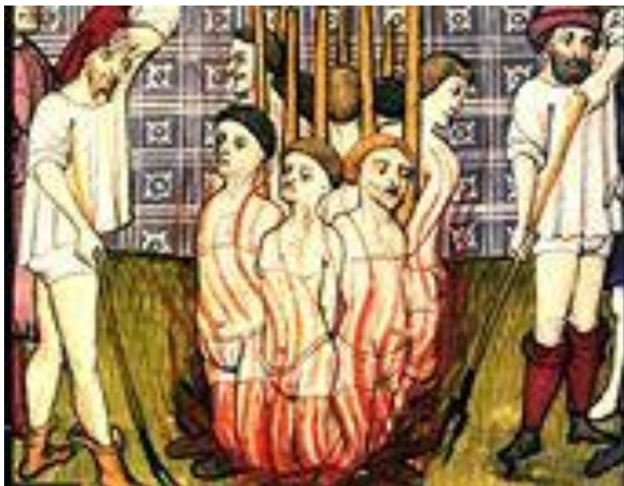
Obr.6 Upálení templářů, zdroj: Barber, Malcolm. Proces s templáři. Argo, Praha: 2008.