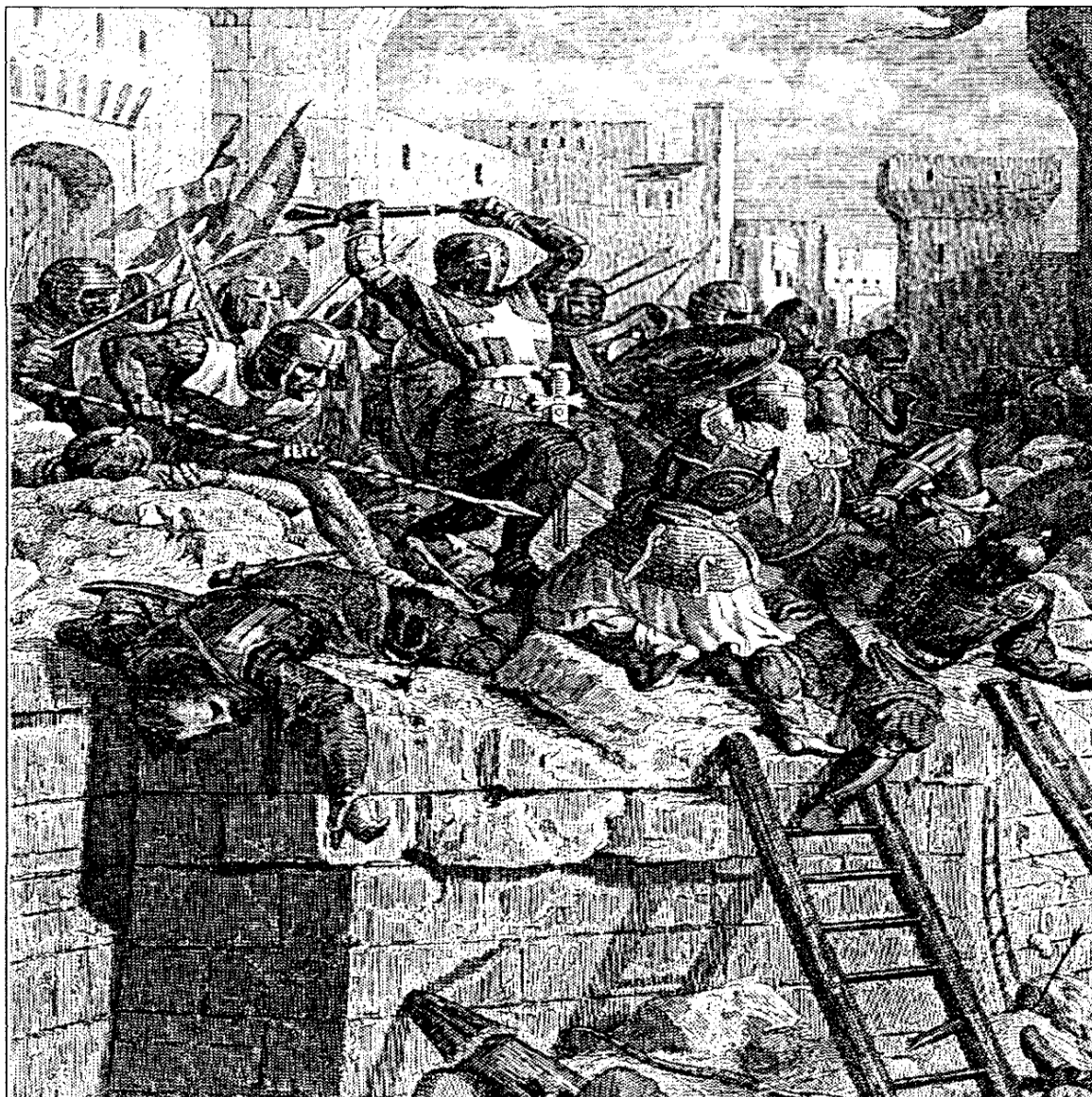
Obr.4 Obléhání Akkonu 129, zdroj: Šedivý, Jaroslav: Tajemství a hříchy rytířů templářského řádu. Volvox Globator, Praha: 2008.