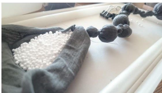
Obr. č. 7. Výroba