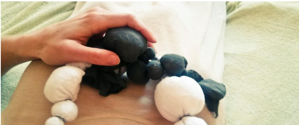
Obr. č. 14. Šperk