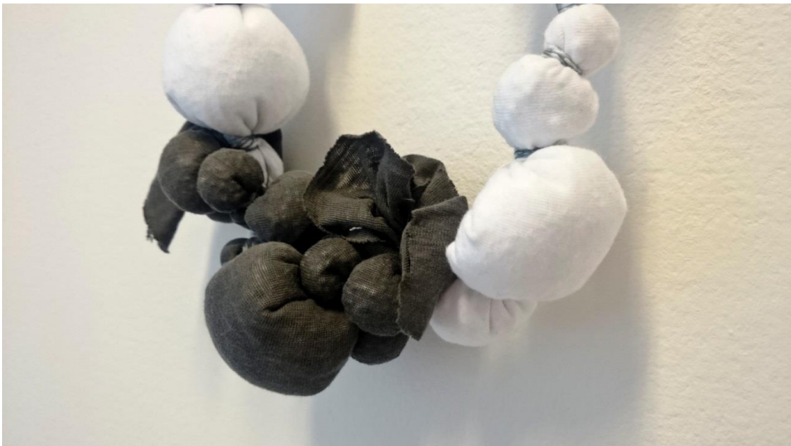
Obr. č. 11. Šperk