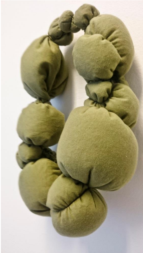
Obr. č. 9. Šperk