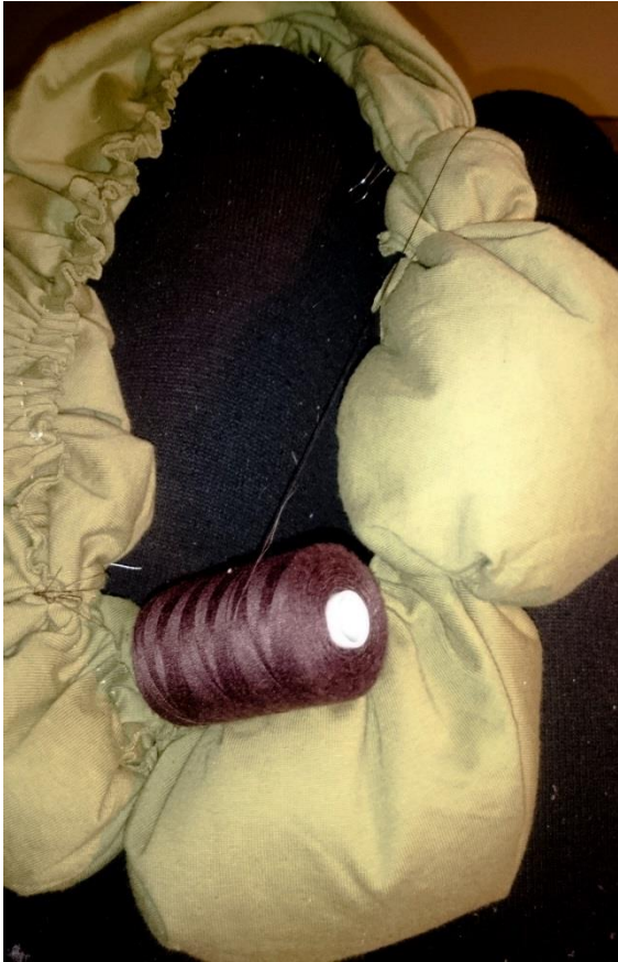
Obr. č. 9. Výroba