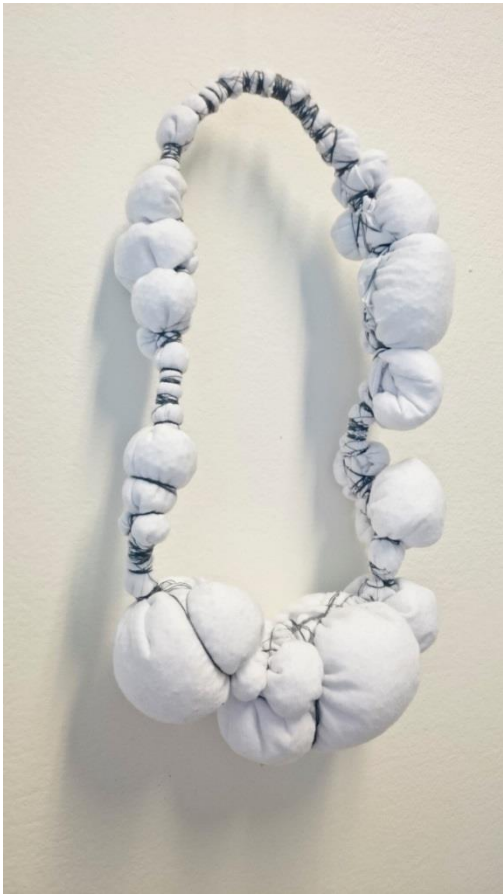
Obr. č. 12. Šperk