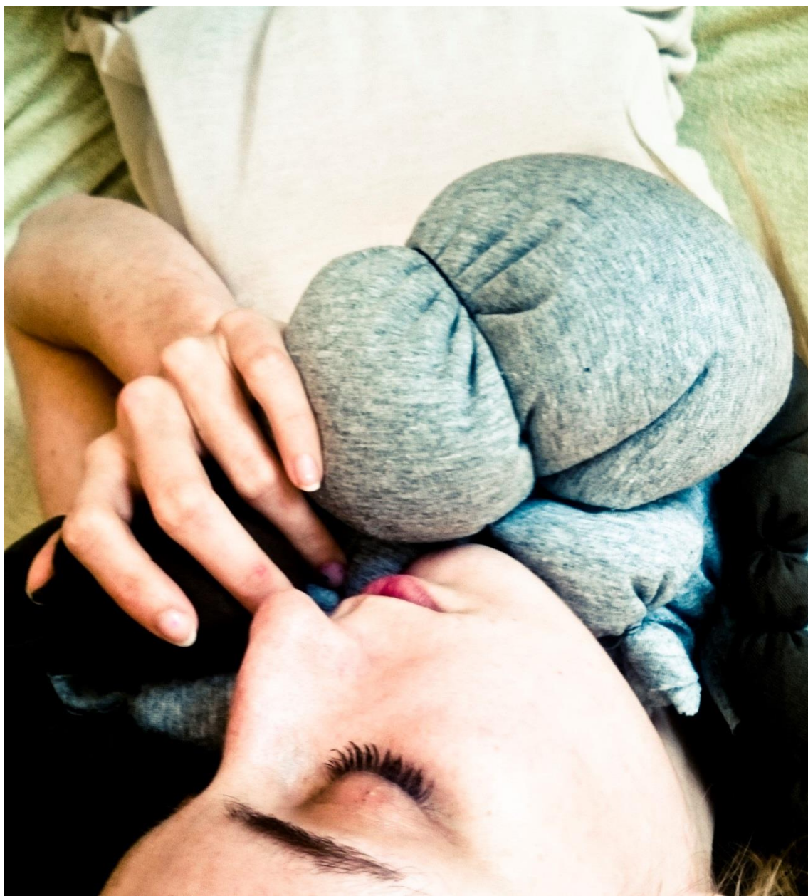
Obr. č. 17. Šperk