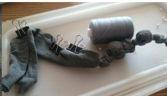
i vůni Obr. č.