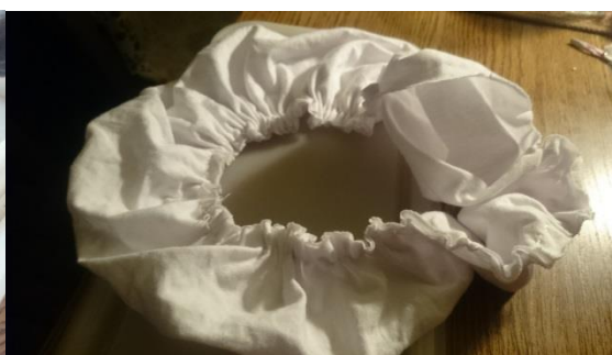
Obr. č. 8. Výroba