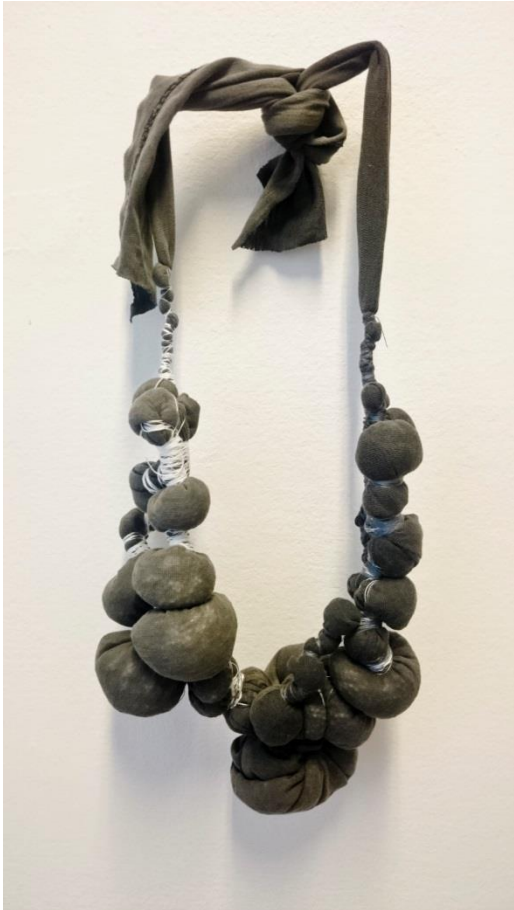
Obr. č. 11. Šperk