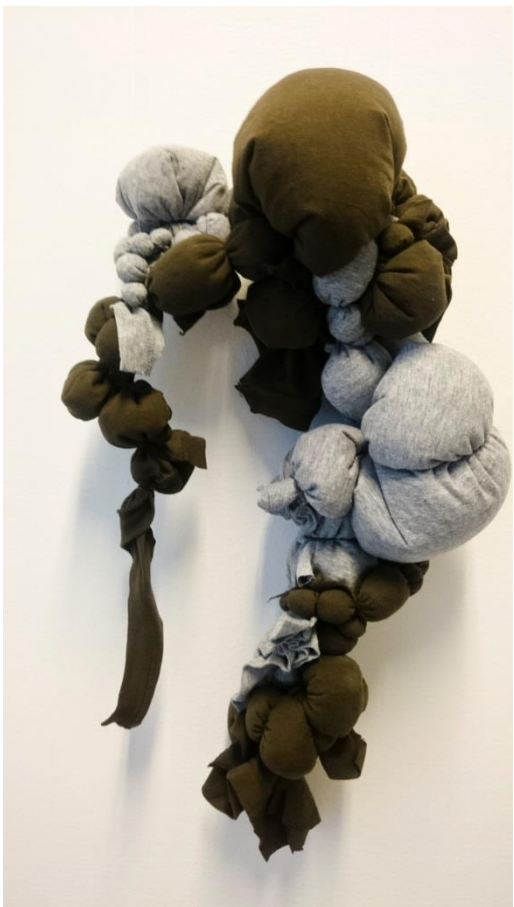
Obr. č. 12. Šperk