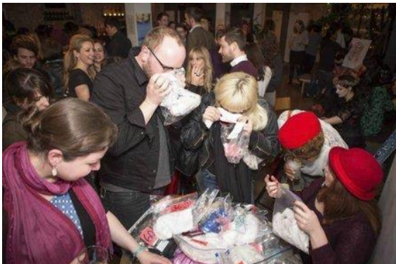
Obr. č. 2. Feromon party