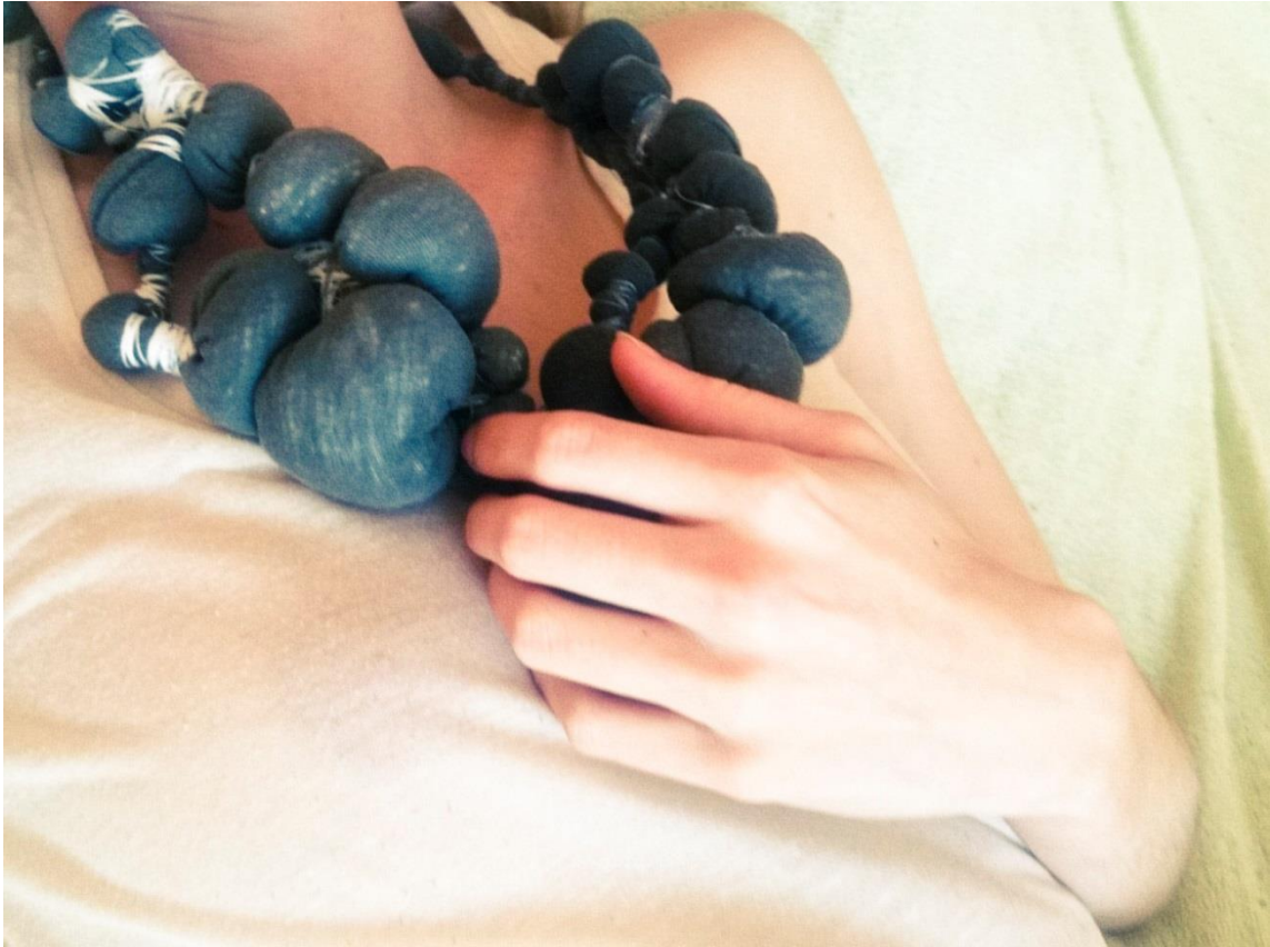
Obr. č. 15. Šperk