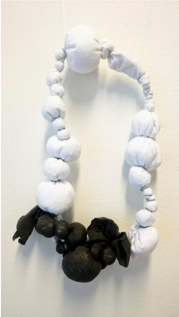
Obr. č. 10. Šperk