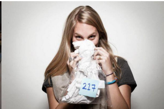
Obr. č. 3. Feromon party