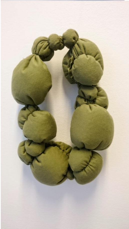
Obr. č. 10. Šperk