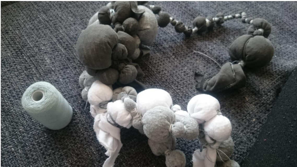
Obr. č. 9. Spojování