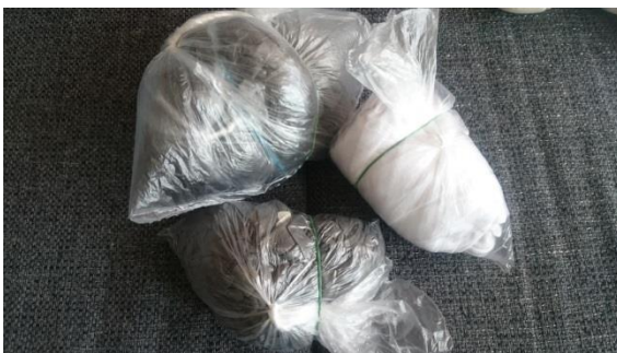
Obr. č. 4. Zabalená trička, aby neztratil