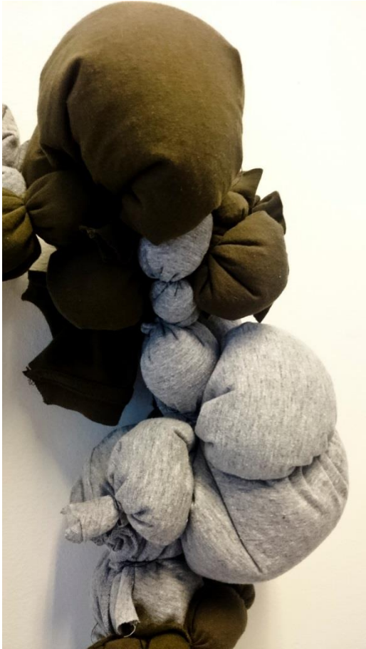
Obr. č. 13. Šperk