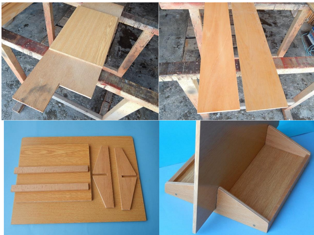
Obrázek 3 - fotografie z průběhu realizace podstavy a zástěny

Podstava je vyrobena z kombinace překližky a sololaku. Spoje jsou lepeny lepidlem Herkules a zajištěny vruty – výrobek se může delší dobu nacházet ve vlhkém prostředí, kde hrozí narušení pouze lepených spojů. Veškeré hrany jsou z důvodu bezpečnosti a pohodlné manipulace zabroušeny smirkovým papírem.