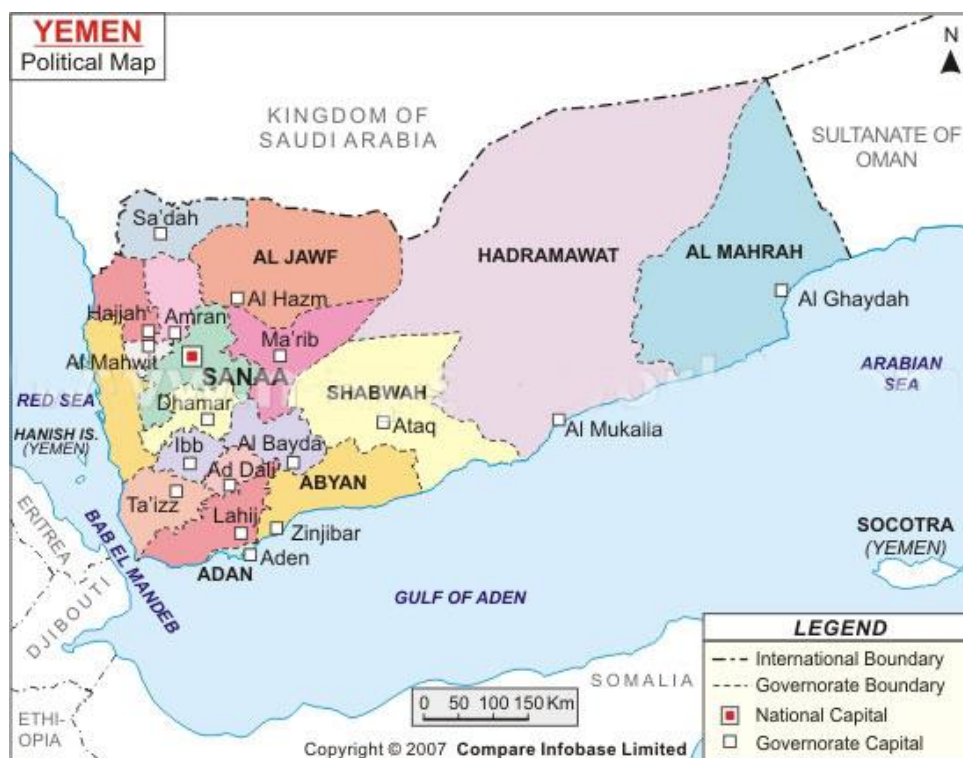
Obr. 2 - Provincie Jemenu

Jemenská republika vznikla roku 1990 sloučením bývalé severní Jemenské arabské republiky a jižní Jemenské lidové demokratické republiky. V Jemenu platí smíšený právní systém složený z islámského práva, zvykového práva, anglického zvykového práva a napoleonského práva. V Jemenu je politický systém tvořen dvoukomorovým parlamentem, soudy a hlavou státu, která má pod sebou předsedu vlády a vládu. Volební právo mají občané od 18 let, 4 které uplatňují ve všeobecných volbách a referendech. Lid také přímo volí svého prezidenta na dalších sedm let. 5 Jemen je rozdělen na 21 správních celků a město Sa ˆ á (viz. obr. 2).