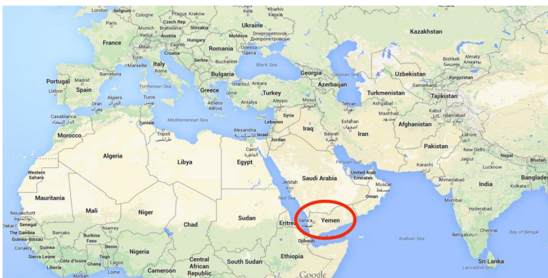
Obr. 1 – Jemen je červeně zakroužkovan

Jemen se nachází v oblasti Blízkého východu na jihu Arabského poloostrova (viz. obr. 1). Sousedí se Saúdskou Arábií na severu a Ománem na severovýchodě. Jemen dělí od afrického kontinentu průliv Báb-al-Mandab, který je jednou z nejdůležitějších přepravních cest světa. Spojuje totiž Suezský průplav a Rudé moře s Adenským zálivem, který je součástí Arabského moře a obklopuje Jemen z jihu. Hlavním městem Jemenu bylo město San c á, avšak od roku 2015 je okupováno, a proto byl dočasně hlavním městem ustanoven Aden. 1