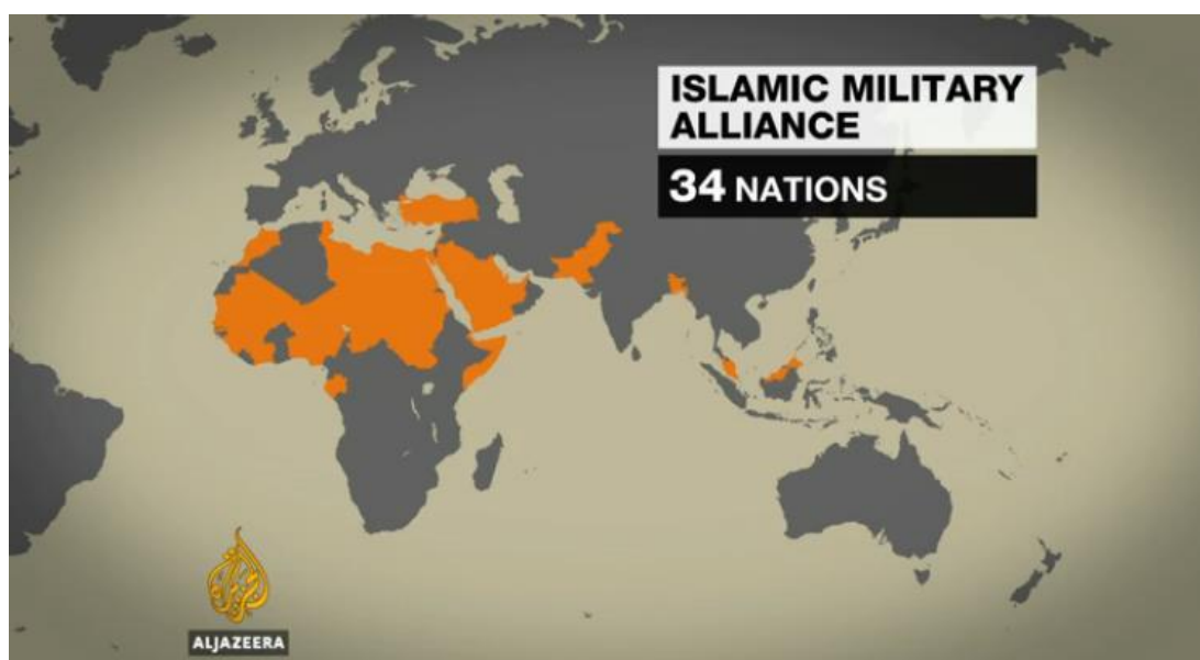
Obr. 1 – Členové Islámské vojenské koalice vedené Saúdskou Arábií

Arabskou koalici zorganizovala Saúdská Arábie. Její vznik oznámil saúdský ministr obrany Muhammad bin Salmán, který je vedle toho také korunním princem Saúdské Arábie. Podle jeho prohlášení se jedná o spojení 34 islámských států, které budou bojovat proti všem teroristickým skupinám na arabském území, nejen proti ISILu. Do koalice se přidali například Spojené arabské emiráty, Katar, Malajsie, Pákistán, Nigérie, Egypt, Maroko a další (viz obrázek níže.) Z možného připojení ke koalici byl vyloučen Írán, Sýrie a Irák. 209