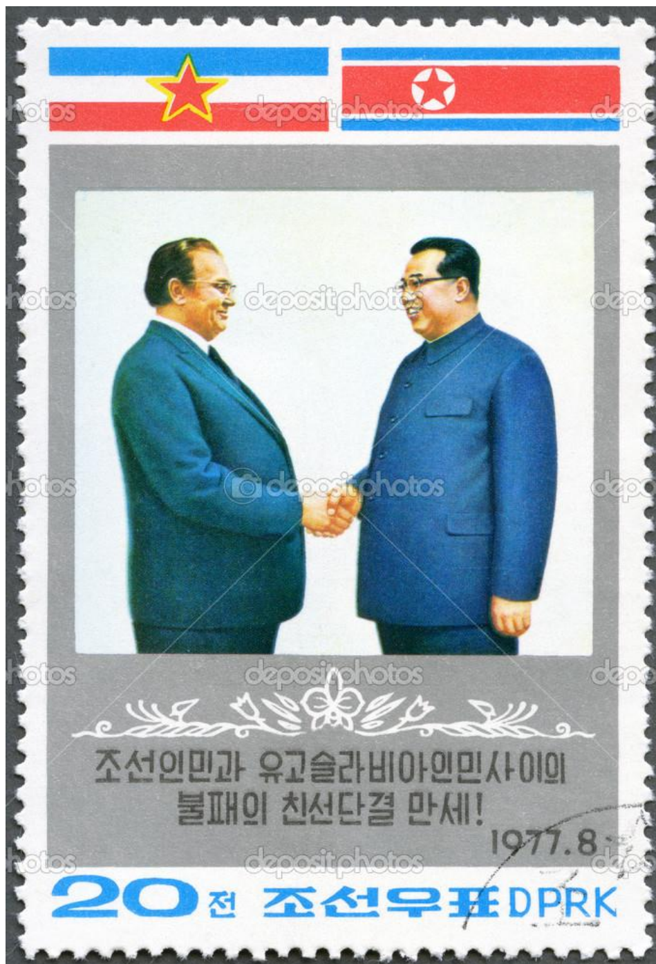
Пříloha č. 4: Josip Broz Tito s vůdcem KLDK Kim Ir Senem na poštovní známce