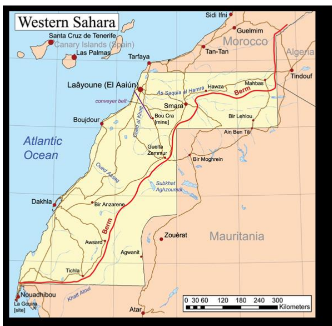
Příloha č. 1: Mapa Západní Sahary