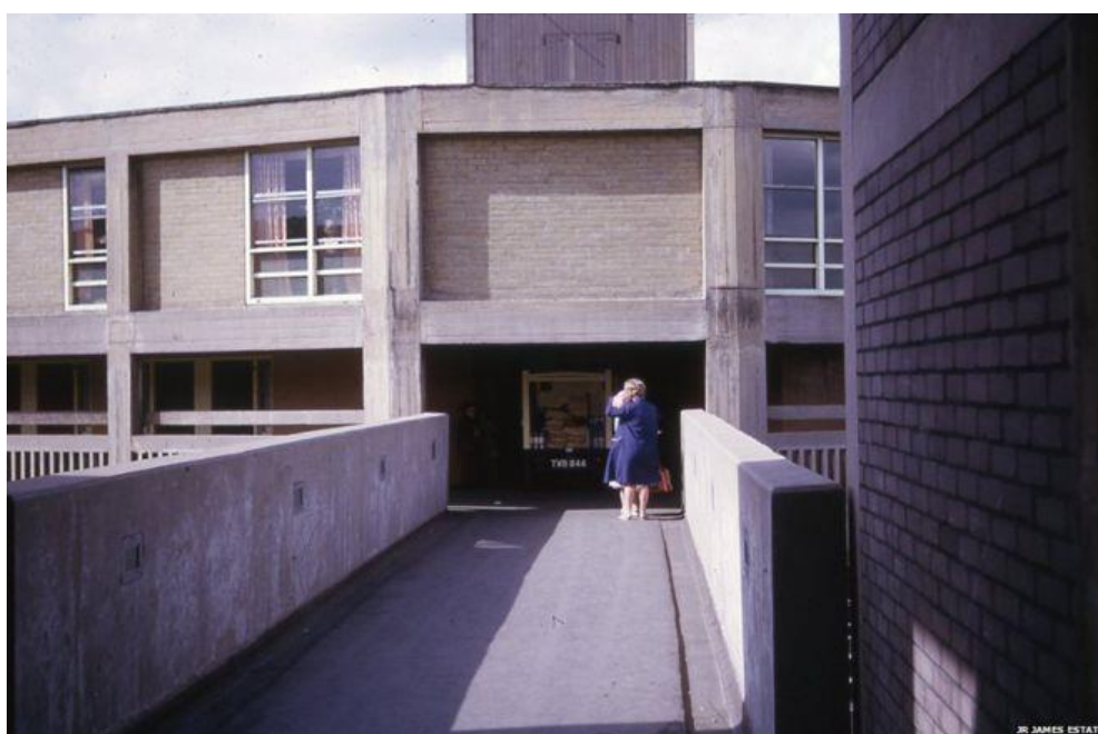
Zdroj: Heyden 2014