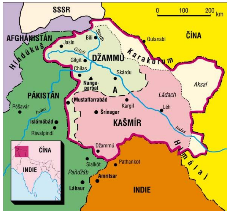
Mapa č. 1 - Oblast Džammú a Kašmír – čerpáno z - Komenskeho66 (nedatováno). Dějepis na internetu ( http://www.komenskeho66.cz/materialy/dejepis/95.html , 20. 3. 2016).