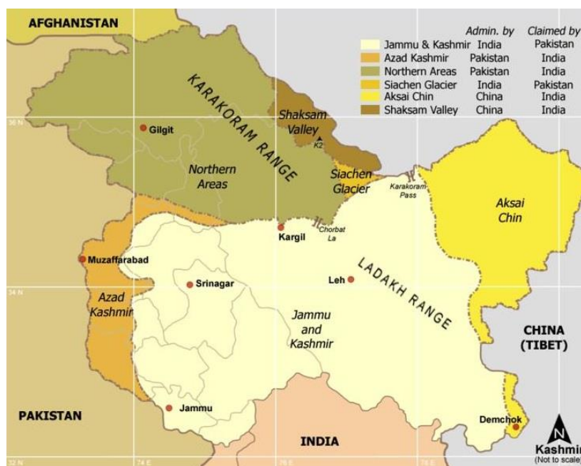
Mapa č. 4 – Ledovec Siachen ( Siachen Glacier ) – čerpáno z - Polgeo (nedatováno). KONFLIKT INDIE – PÁKISTÁN ( http://polgeo.geogr.muni.cz/konlikty-smlouvy-a-organizace/konflikt-indie-pakistan/ , 20. 3. 2016).