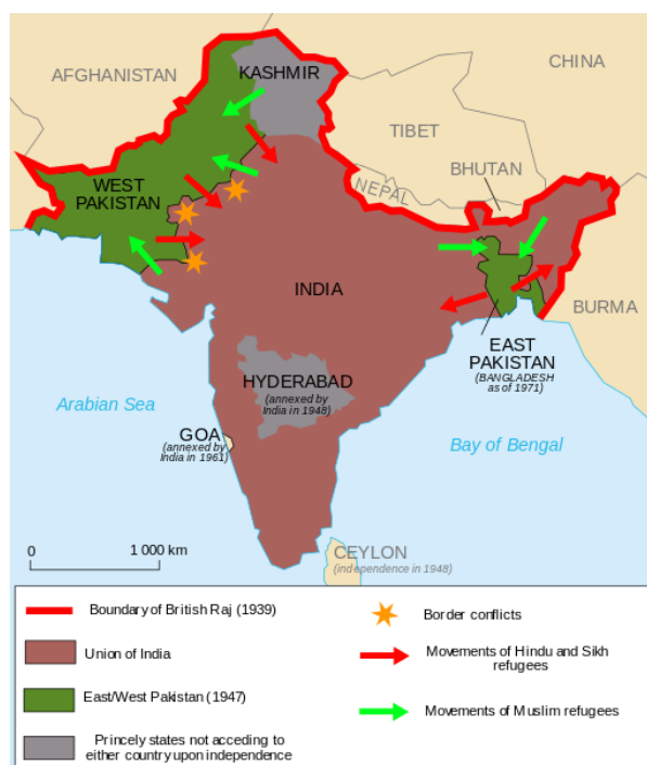
Mapa č. 2 – Fragmentovaný stát – Západní a Východní Pákistán ( West and East Pakistan ) – čerpáno z - Polgeo (nedatováno). KONFLIKT INDIE – PÁKISTÁN ( http://polgeo.geogr.muni.cz/konlikty-smlouvy-a-organizace/konflikt-indie-pakistan/ , 20. 3. 2016).