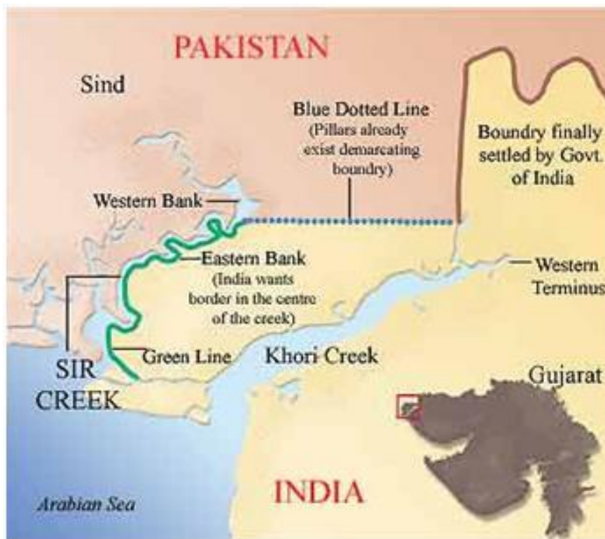
Mapa č. 3 – Oblast Sir Creek – čerpáno z – GK Today (2012). Sir Creek Dispute ( http://www.gktoday.in/sir-creek-dispute/ , 22. 3. 2016).