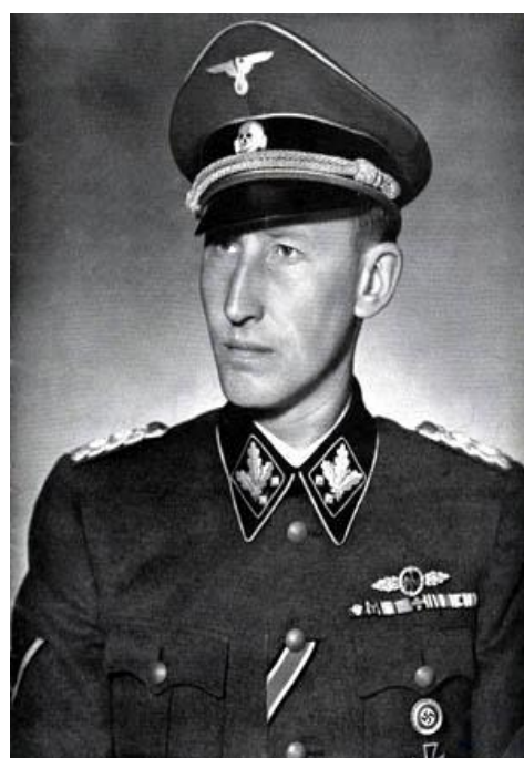
Reinhard Heydrich 337