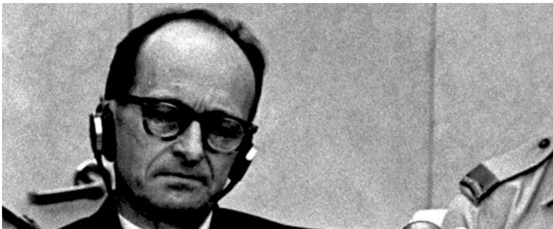
Adolf Eichmann 338