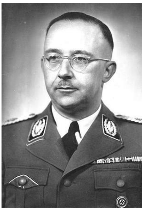
Heinrich Himmler 336