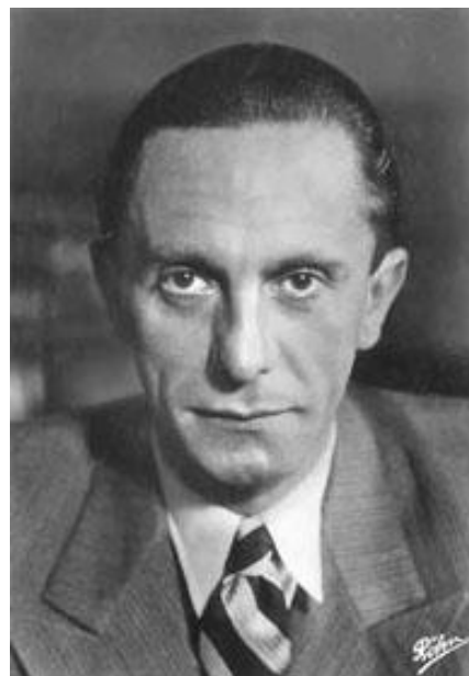
Joseph Goebbels 335