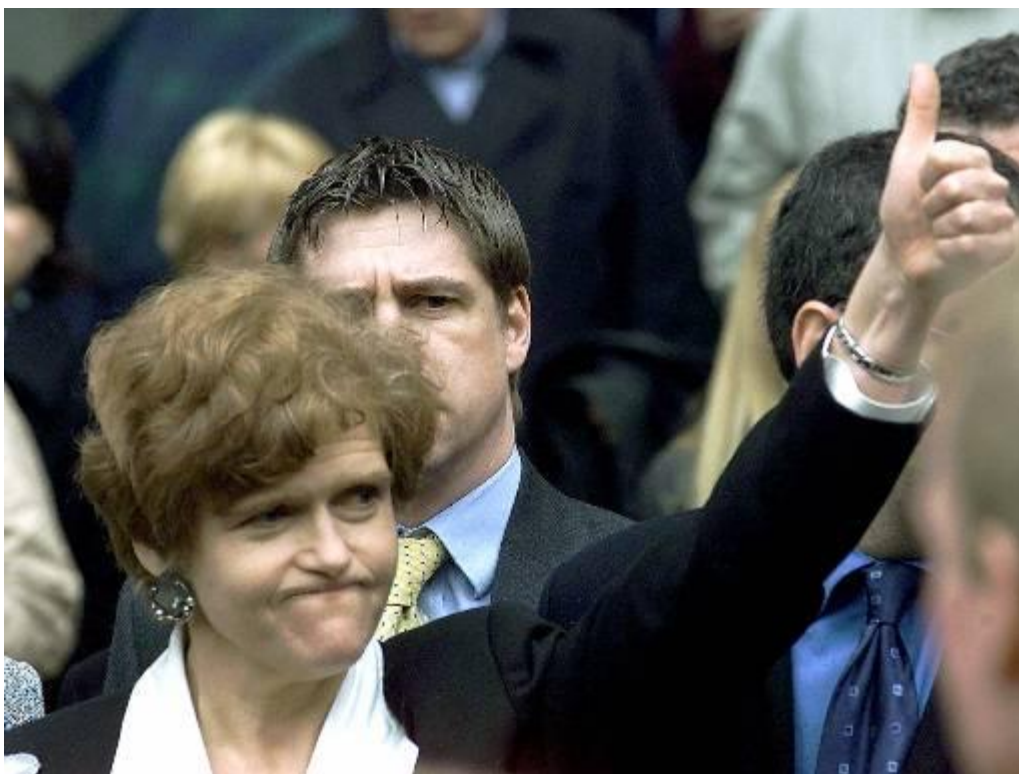
Deborah E. Lipstadtová 339