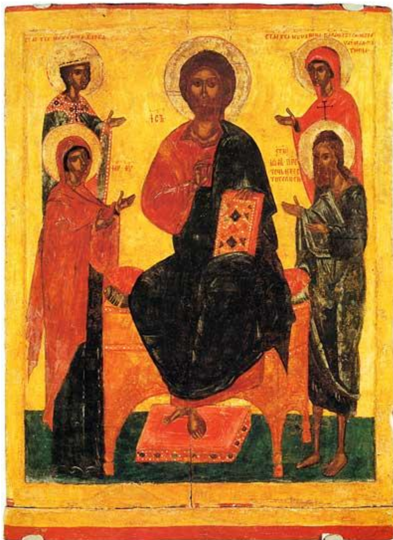
Деисус со святыми Варварой и Параскевой; Псков, последняя четверть XIV в.

( http://www.icon-art.info/masterpiece.php?lng=ru&mst_id=594 )