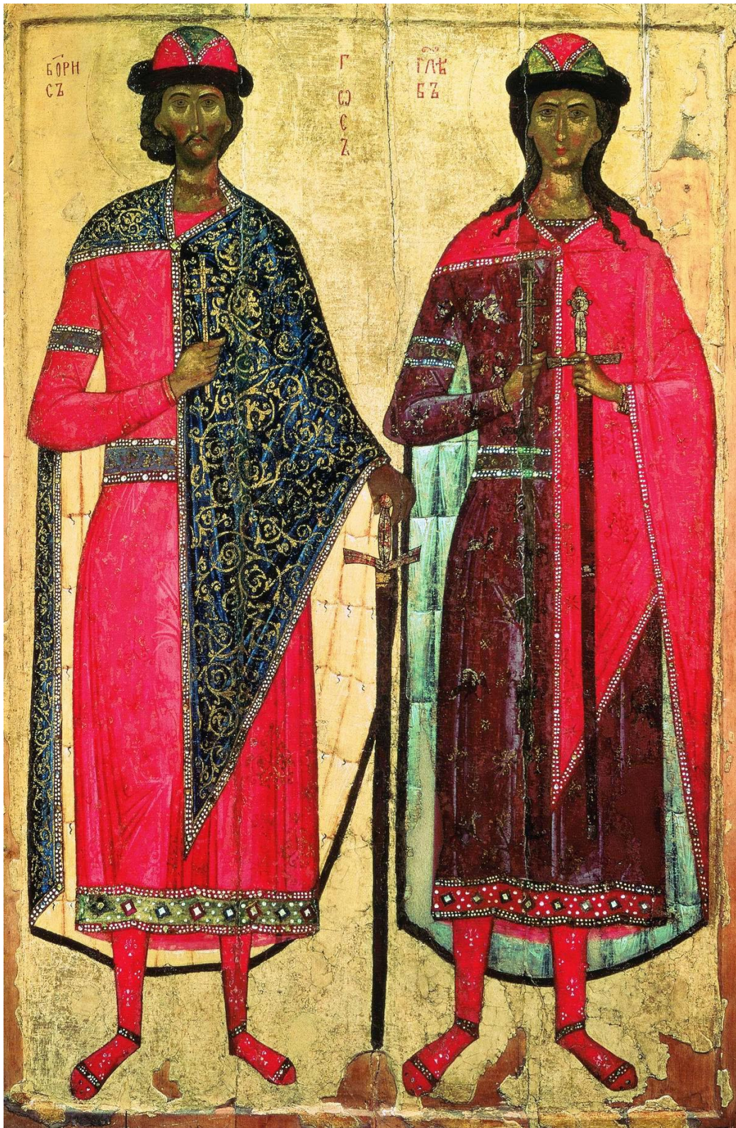
Борис и Глеб; Москва, начало XIV в.

( http://www.icon-art.info/masterpiece.php?lng=ru&mst_id=448 )