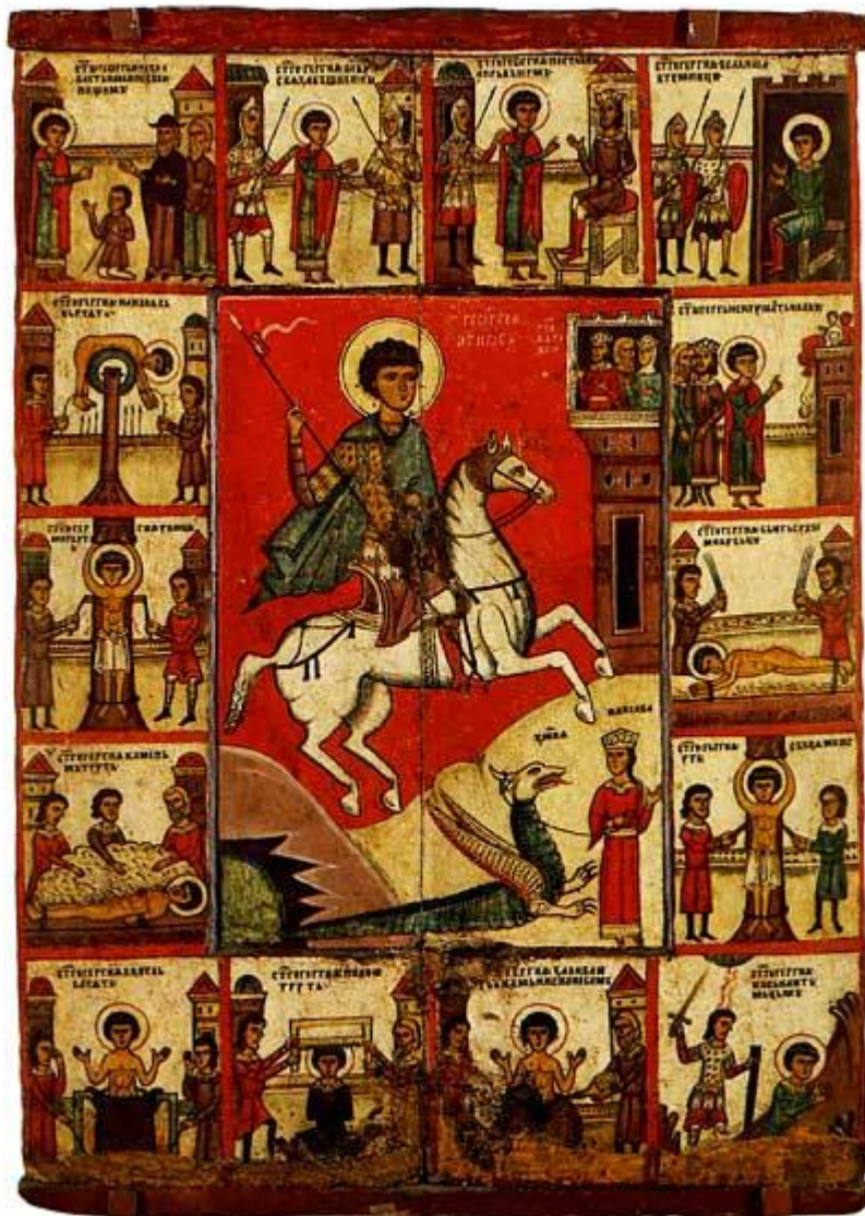
Георгий с житием; Новгород, начало XIV в.

( http://www.icon-art.info/masterpiece.php?lng=ru&mst_id=556 )