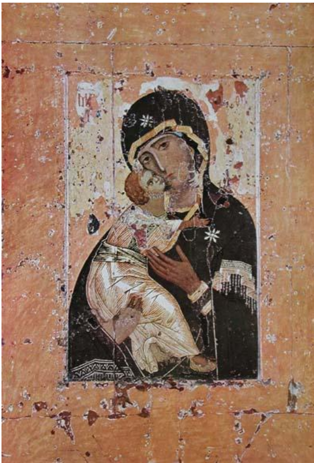
Богоматерь Владимирская; Византия, первая треть XII в. ( http://www.icon-art.info/masterpiece.php?lng=ru&mst_id=174 )