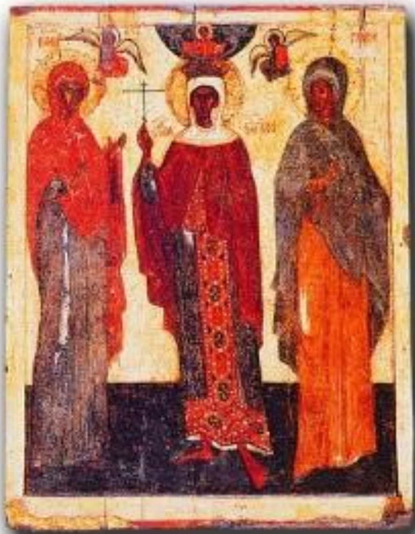
Параскева Пятница, Варвара и Ульяна; Псков, последняя четверть XIV в.