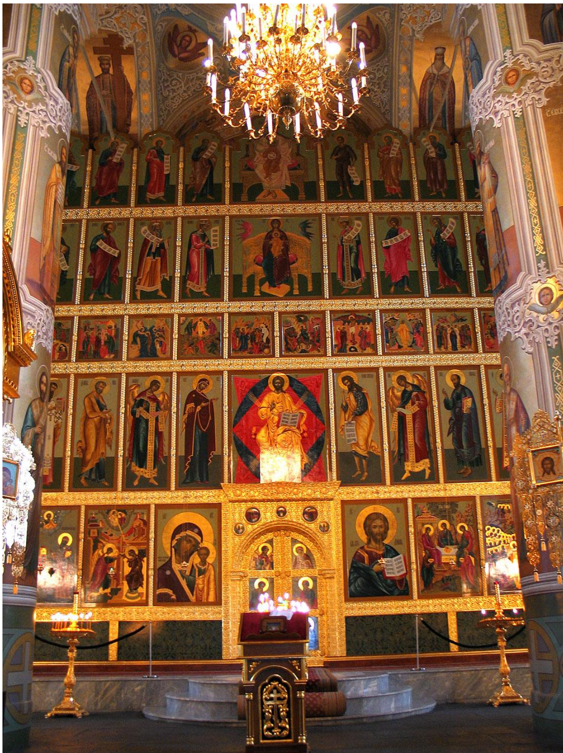
Иконостас Благовещенского собора; Москва, XIV – XIX вв.

(Костикова, Р. С. Святые Московского Кремля. Москва, 2001. с.73.)