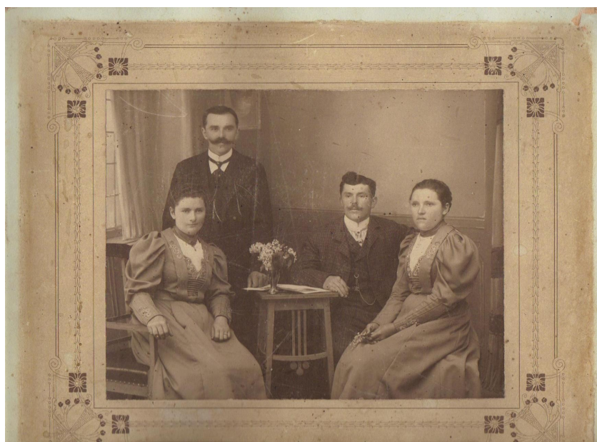
Obr. č. 5. Nalevo praprababička se sourozenci v 1906, Velké Meziříčí

Současná moderní společnost přeje individualitám ve vztahu k tržnímu systému s důrazem na racionální jednání. Tato změna postupného odstraňování náboženských a mytologických představ a předsudků sice osvobozuje, avšak jejím důsledkem je charakteristická anonymita velkých měst. Současná společnost se potýká s rychlostí a nekoordinovaností sociálních změn. 26 Lidé, kteří jsou sociálně velmi mobilní, však trpí osamělostí a mají snahu někam patřit. Právem se ohlížejí do minulosti, hledají svůj původ a zamýšlí se nad svou existencí, nad životním naplněním.