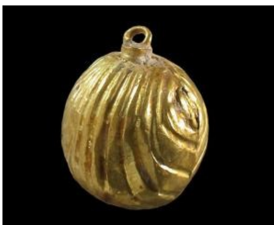
Obr. č. 2. Rolnička z počátku našeho letopočtu, Jeruzalém.

Rolničky se hodně používaly i pro děti. Měly praktický význam, poněvadž dítě bylo slyšet a rodiče měli přehled o jeho pohybu.