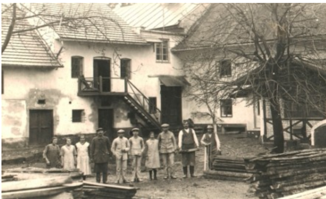
Obr. č. 4. Vodní mlýn v roce 1932.

vazbami, rody měly generačně stejný zájem na udržení rodinné tradice a jejího předání potomkům podle přesných pravidel. Dlouhodobě žili ve stejné lokalitě s velkým respektem k přírodě. Jejich existence byla založena na naprosté samostatnosti a soběstačnosti. Generačně si předávali zkušenosti, které je zvýhodňovaly v tehdejší společnosti a vytvářeli kontinuitu života předků a potomků.