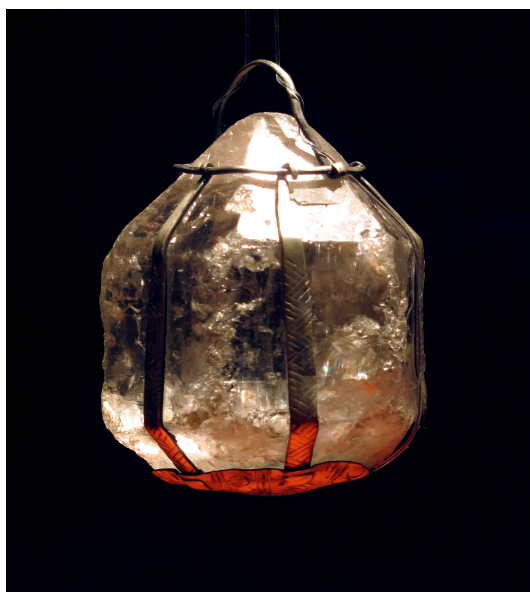
Obr. 1. Amulet ze stříbra a horského křišťálu, východní Evropa 6. st.

Rolničky se hodně používaly i pro děti. Měly praktický význam, poněvadž dítě bylo slyšet a rodiče měli přehled o jeho pohybu.