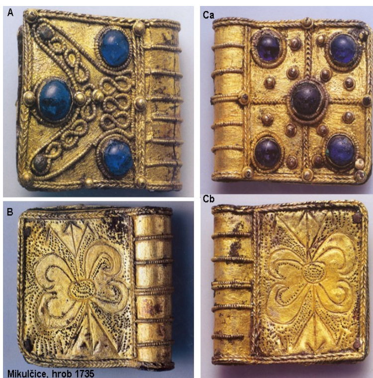
Obr. 3. Zlaté kaptorgy z 10. st., Mikulčice na Moravě.

Mezi typy amuletů těchto svátostí patřily i kaptorgy (obr. č. 3). To byly schránky různých tvarů, často opět srdcovitého ale i kulatého nebo oválného tvaru. U nás se objevily v 9. století a obvykle měly na povrchu nějakou výzdobu. Uvnitř byly vystlané látkou a sloužily k ukládání různých maličkostí. 23 V křesťanském období se kaptorga nosila zavěšená na náhrdelníku, byla zhotovená ze stříbra i zlata.