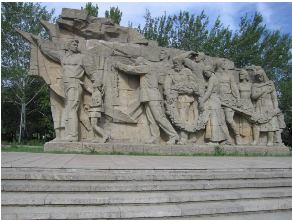
Příloha č. 9 Náměstí „Postav se smrti“