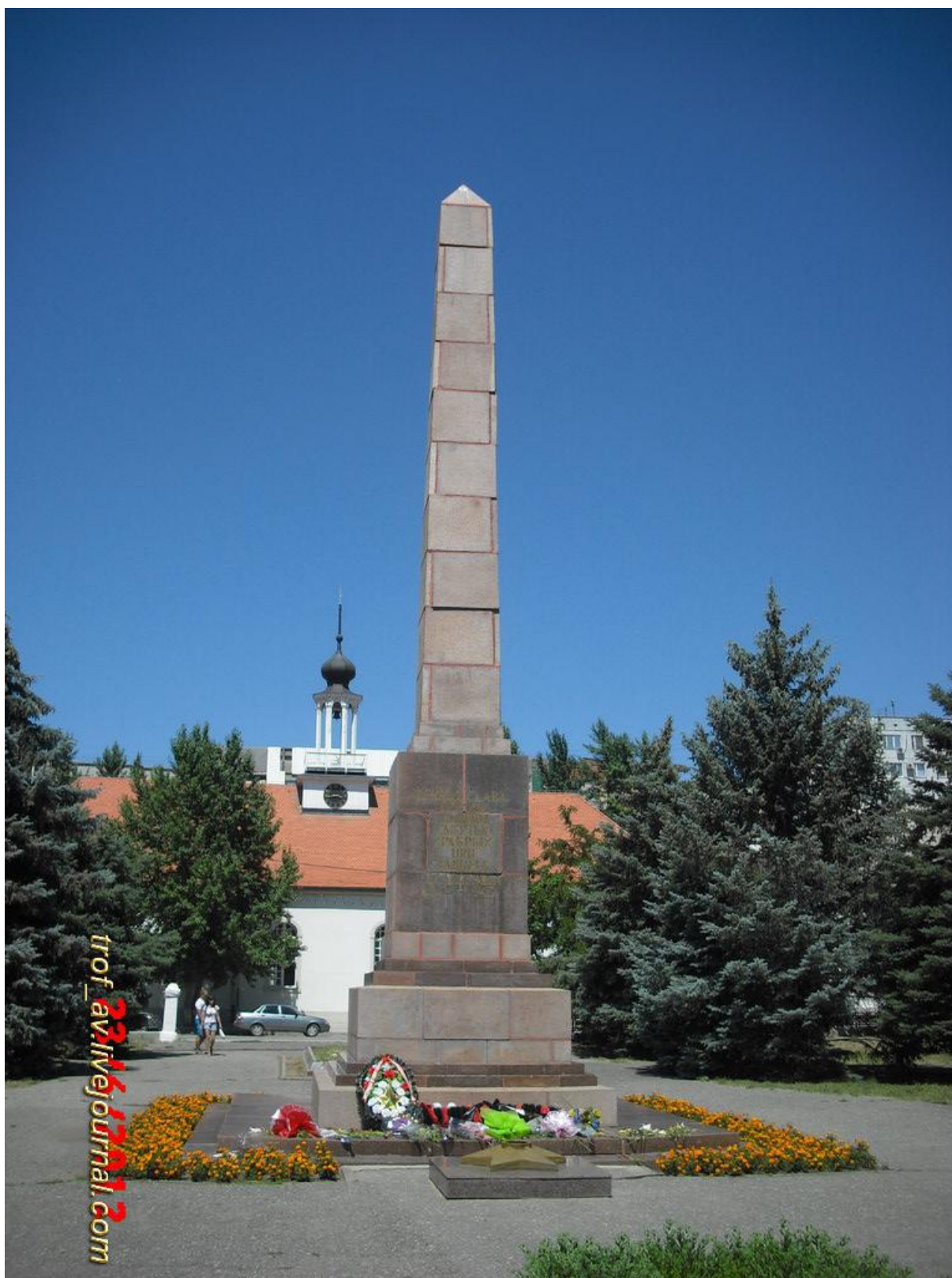
Obrázek č. 3. Stará Sarepta