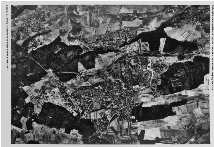
Obr. 3 - Kladno, 1951