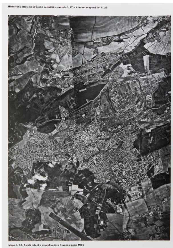
Obr. 4 - Kladno, 1993