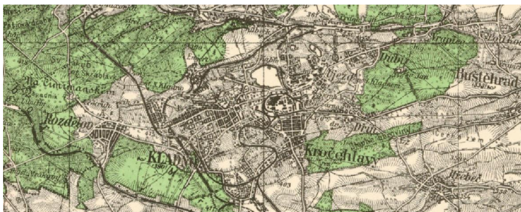
Obr. 2 - Kladno, 1877-80