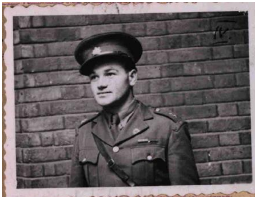
Fotografie č. 4 - Jan Kubiš, ANTHROPOID, zdroj: VHA, sign. 37 – 308 – 2.