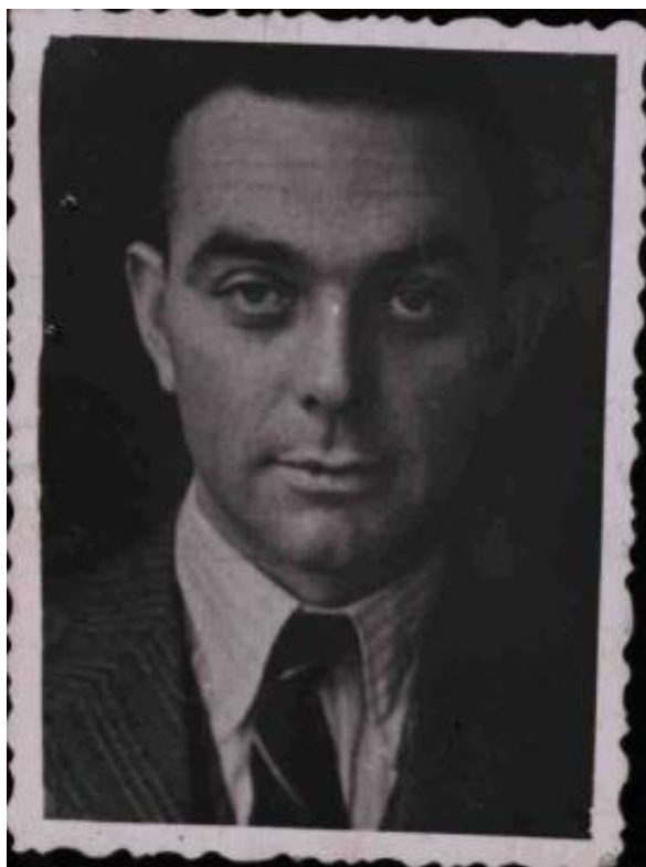
Fotografie č. 11 - Pechal, Oldřich, ZINC, zdroj: VHA, sign. 37 – 351 – 1.