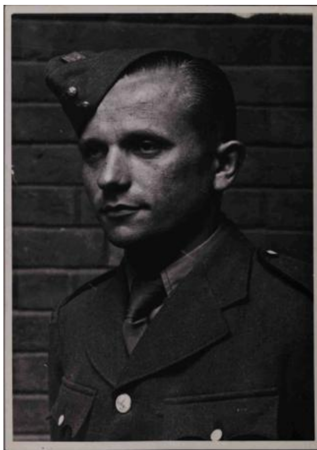
Fotografie č. 3 - Jozef Gabčík, ANTHROPOID