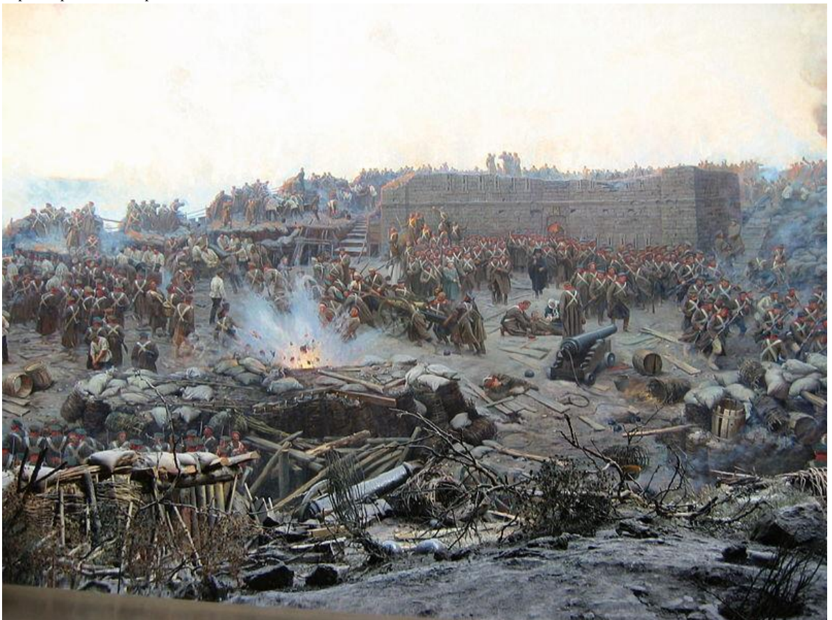
Příloha č. 4. Obležený Sevastopol

https://cz.pinterest.com/pin/322077810828933019/