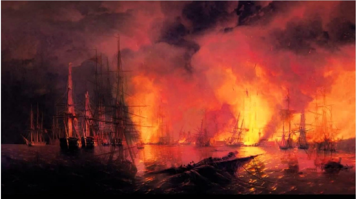
Příloha č. 1. Bitva u Sinopu

https://cs.wikipedia.org/wiki/Bitva_u_Sinopu