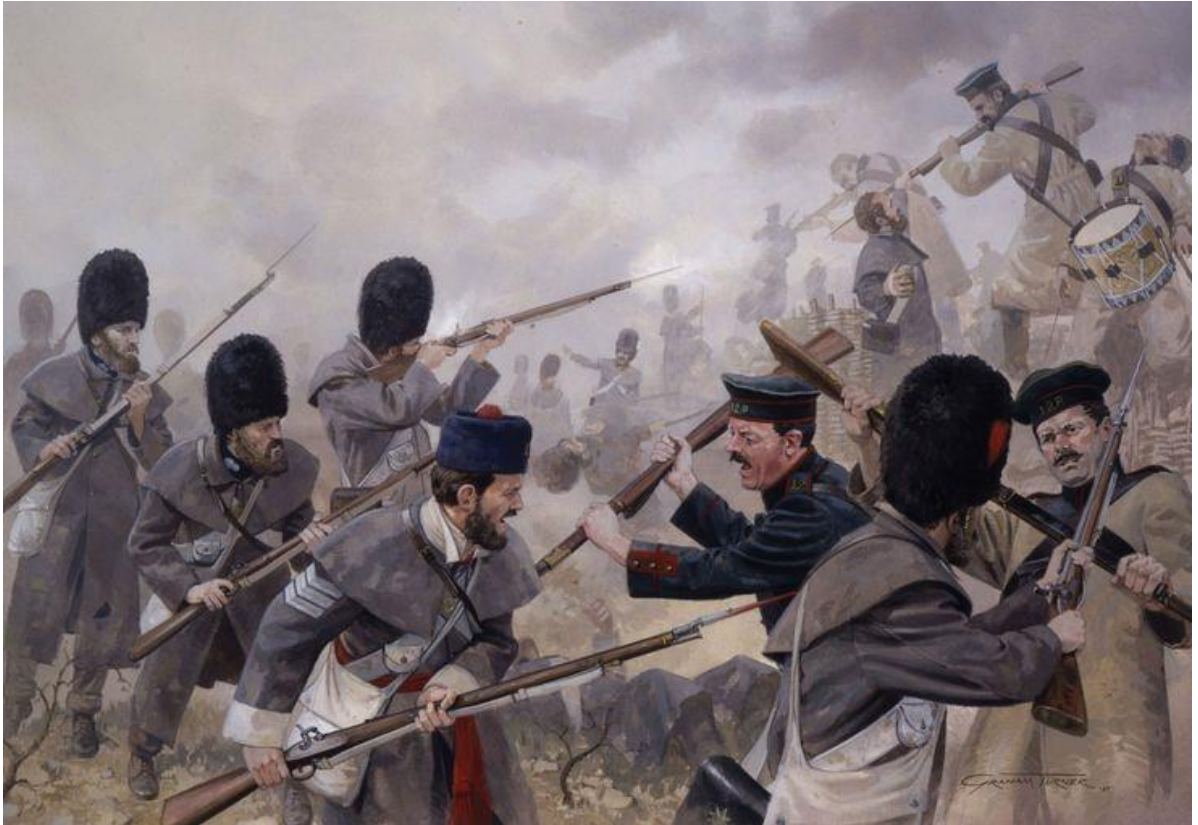
Příloha č. 3. Střet spojeneckých a ruských vojáků u Inkermanu roku 1854.

https://cz.pinterest.com/pin/322077810828933019/