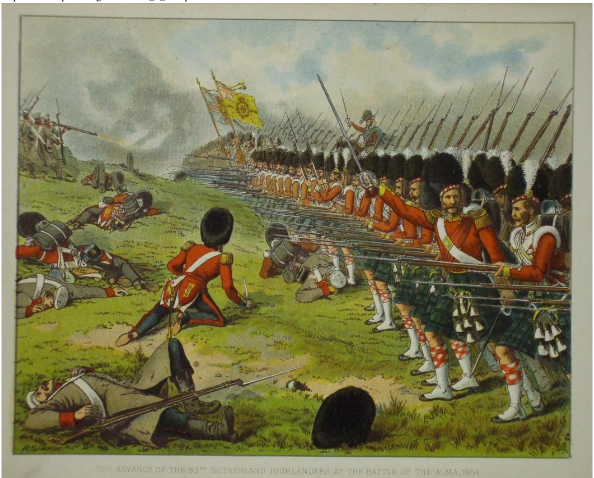
Příloha č. 2. Skotští horalé v bitvě na řece Almě

https://cs.wikipedia.org/wiki/Bitva_u_Sinopu