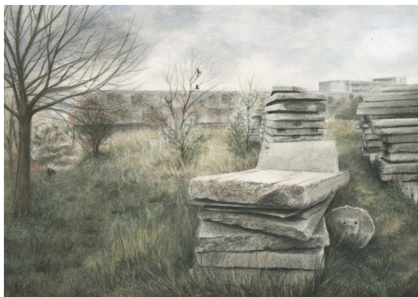
Ukázka finální kresby, Západočeská univerzita 2