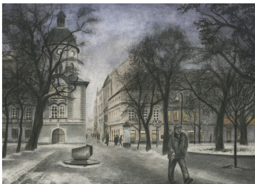
Ukázka finální kresby, Smetanova ulice 2