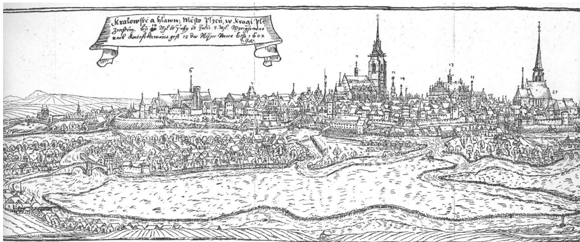
Velký pohled na Plzeň 1