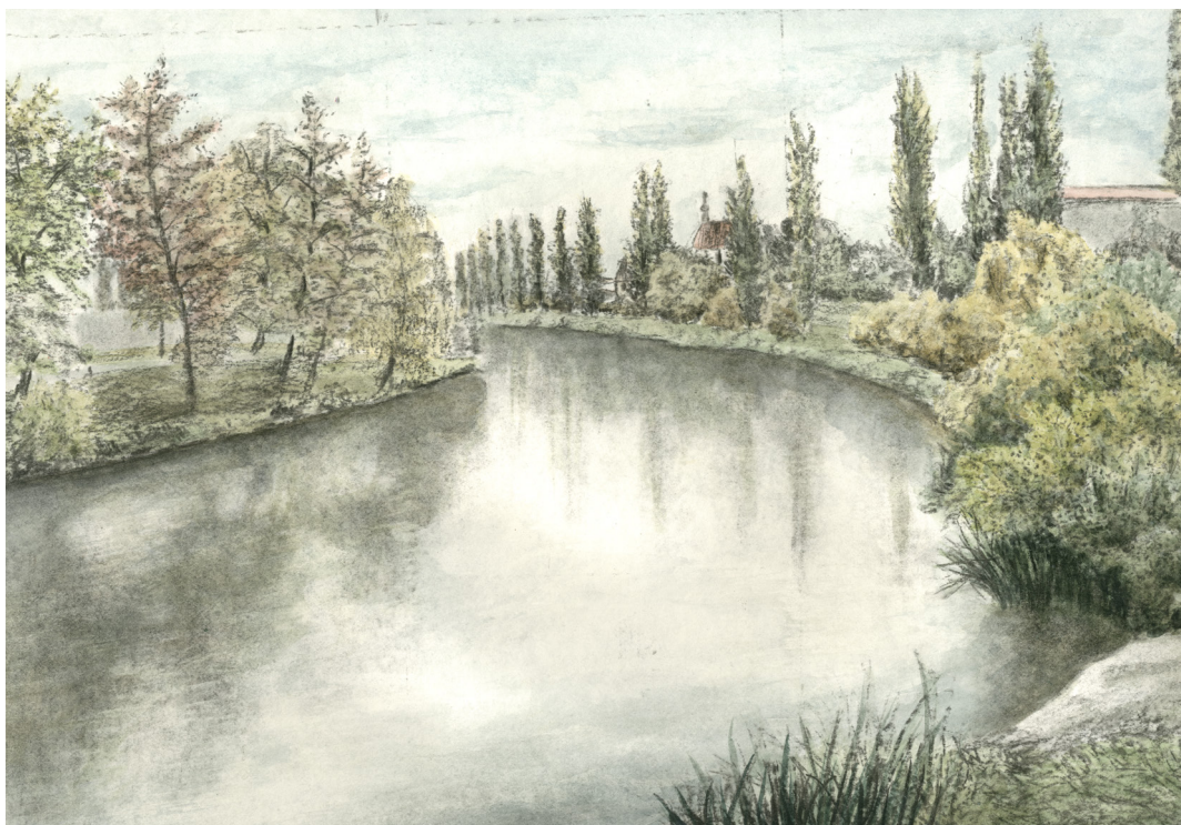
Přípravná verze, akvarel a uhl 2