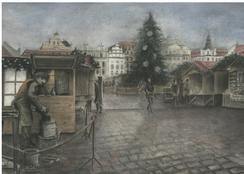
Ukázka finální kresby, Vánoční trhy 1