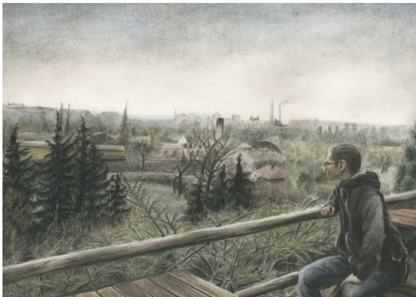
Ukázka finální kresby, Zoologická a botanická zahrada 2