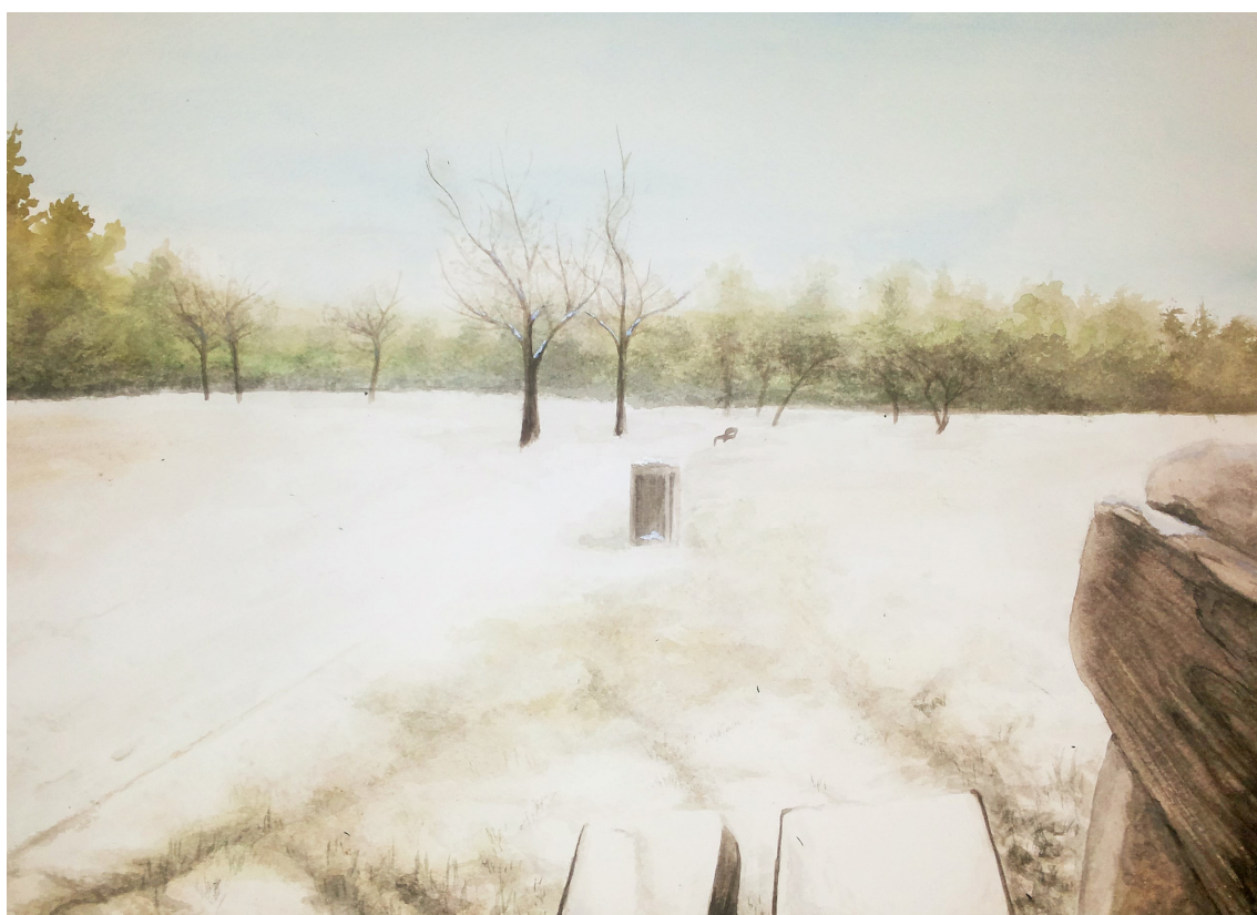
Semestrální práce 1. ročník LS - Park v toku času 2