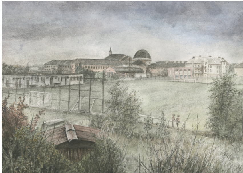
Ukázka finální kresby, Plzeňská věznice 1