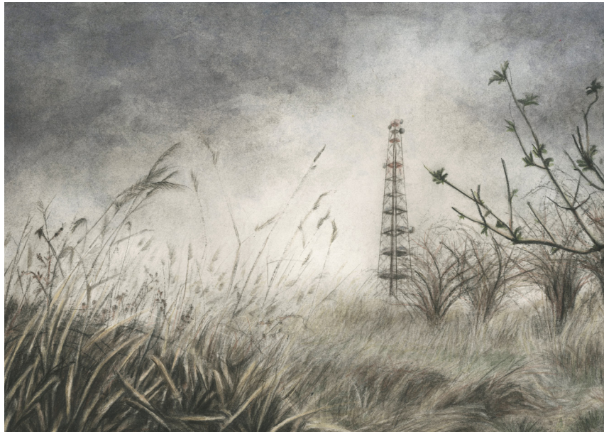
Ukázka finální kresby, Rozhledna Sylván 1