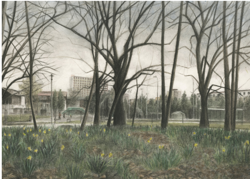
Ukázka finální kresby, Borský park 1