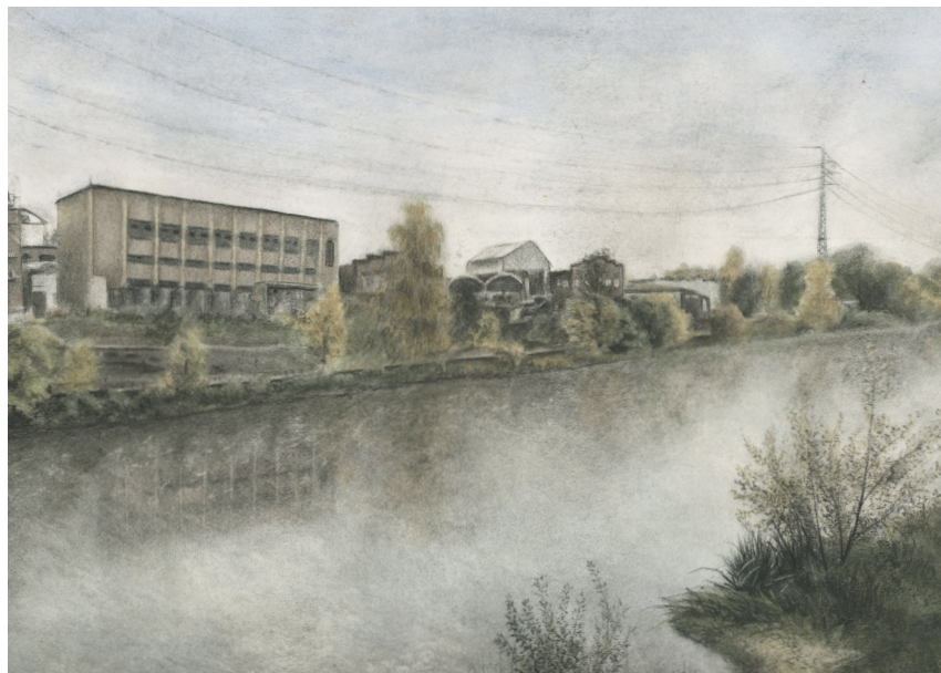
Ukázka finální kresby, Budova staré papírny nad řekou 2