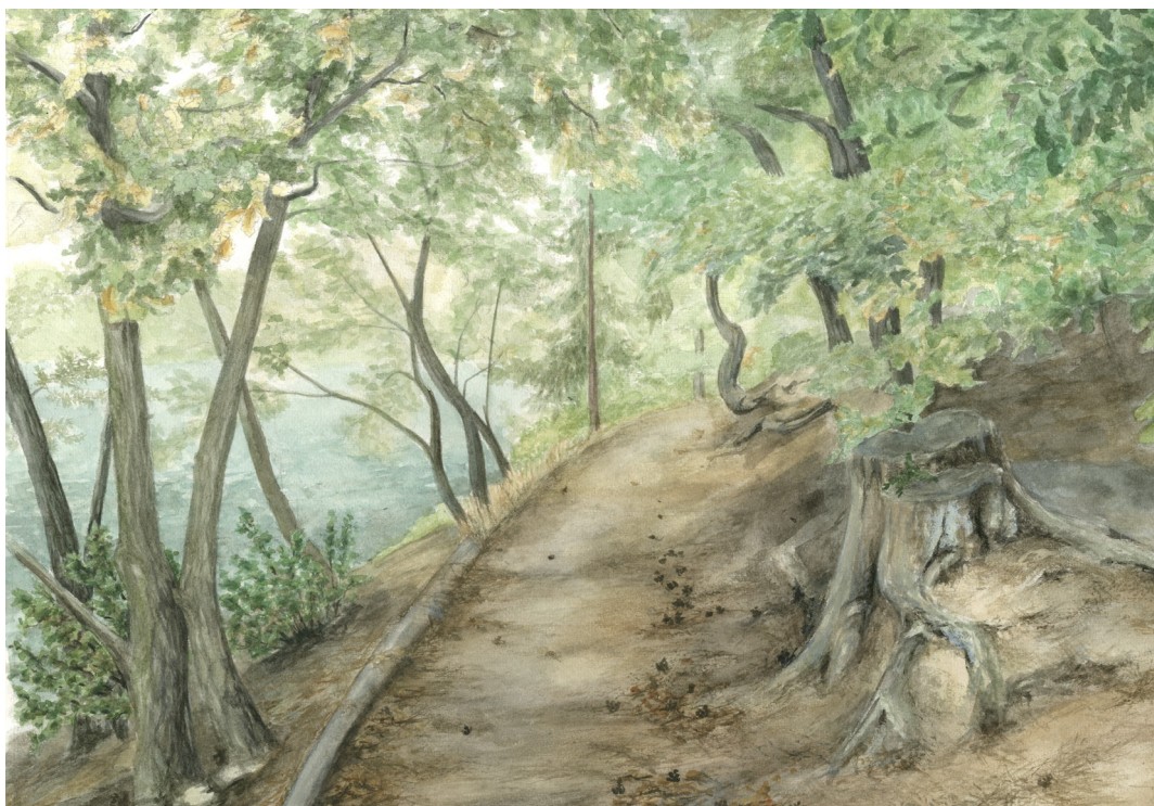
Přípravná verze, akvarel a tužka 1