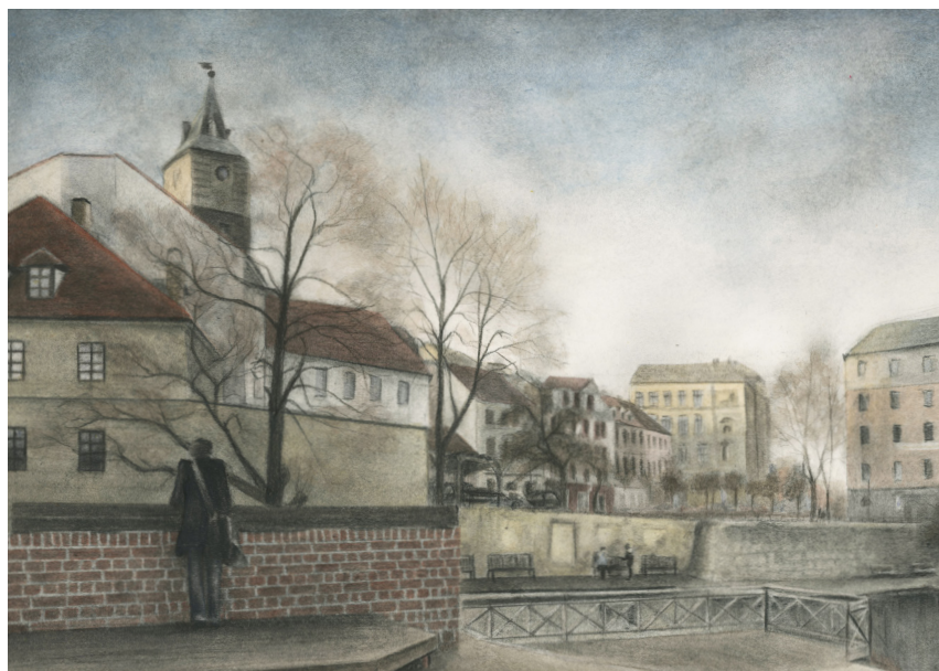
Ukázka finální kresby, Mlýnská strouha 1