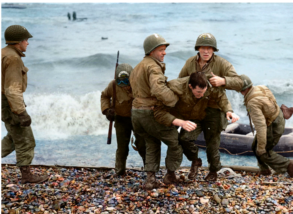
Marina Amaral, Zdravotníci z USA pomáhají szraněným vojákům na pláži Omaha 2