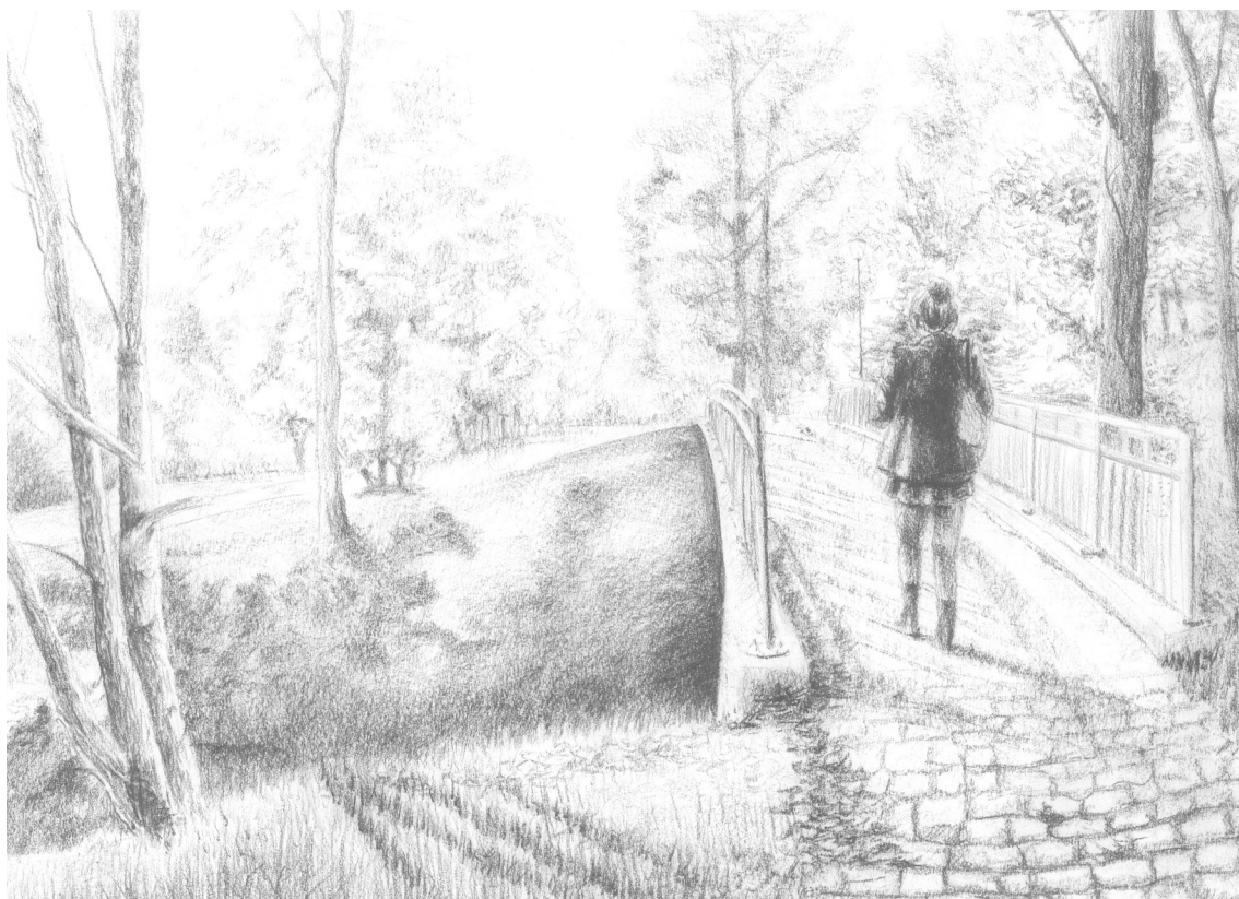
Semestrální práce 1. ročník ZS - Městské parky 1