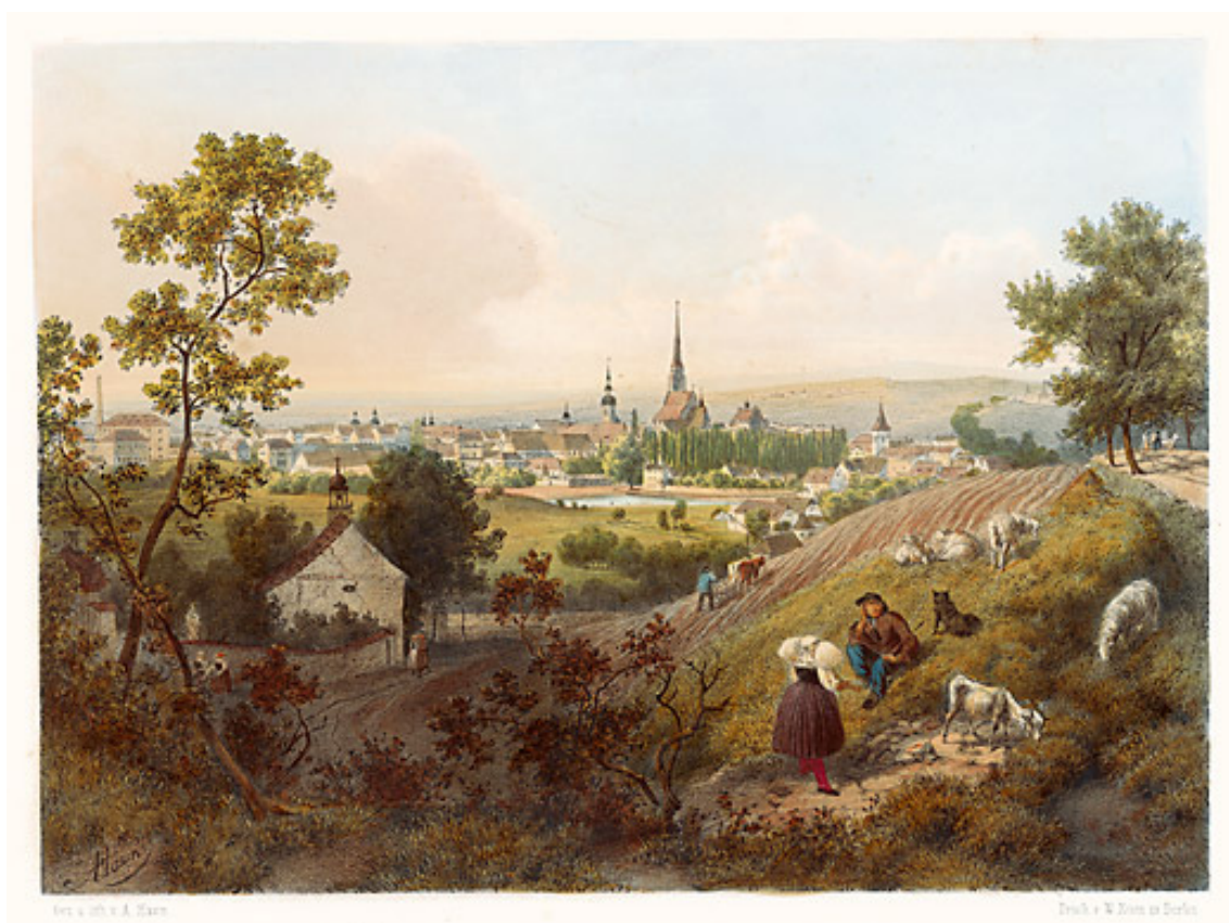
A. Haun, Plzeň, 1860 2