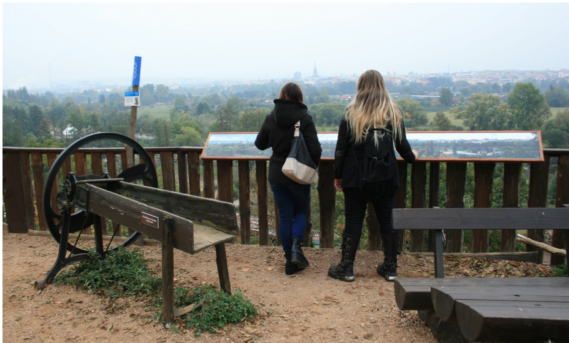
Výhled z Plzeňské Zoologické a botanické zahrady 1