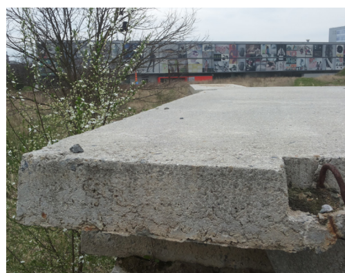
Detail betonového bloku u budovy školy 3