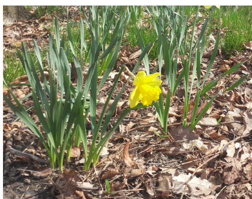
Detail narcisu v Borském parku 2