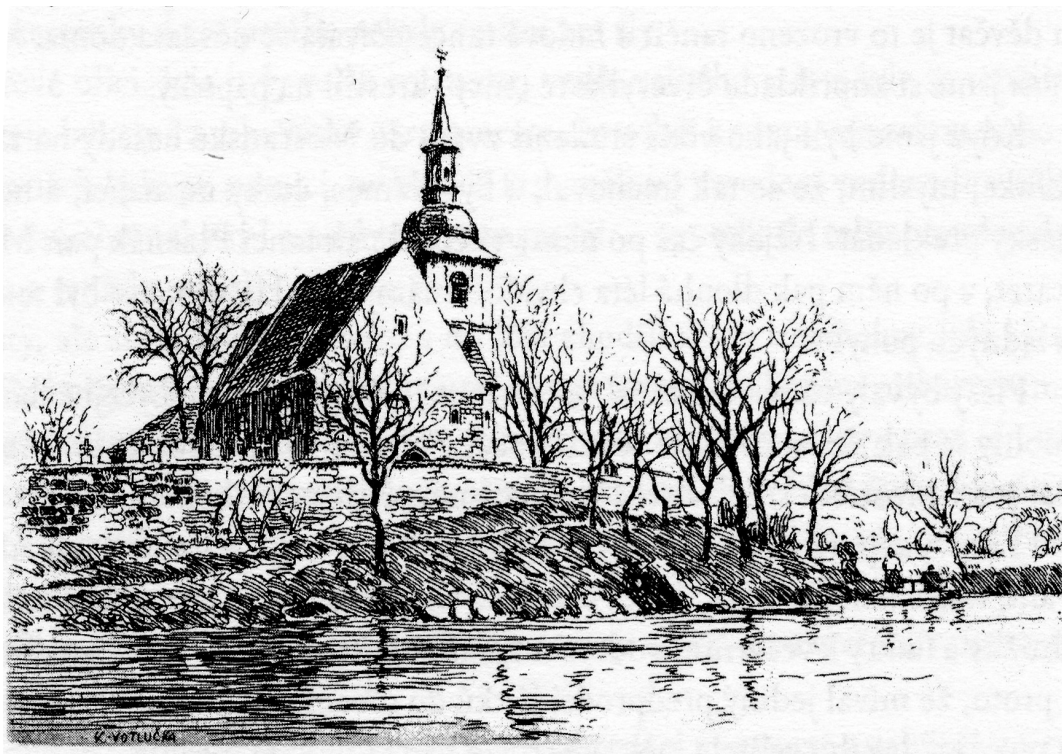
Karel Votlučka, Plzeňské pomněnky 3