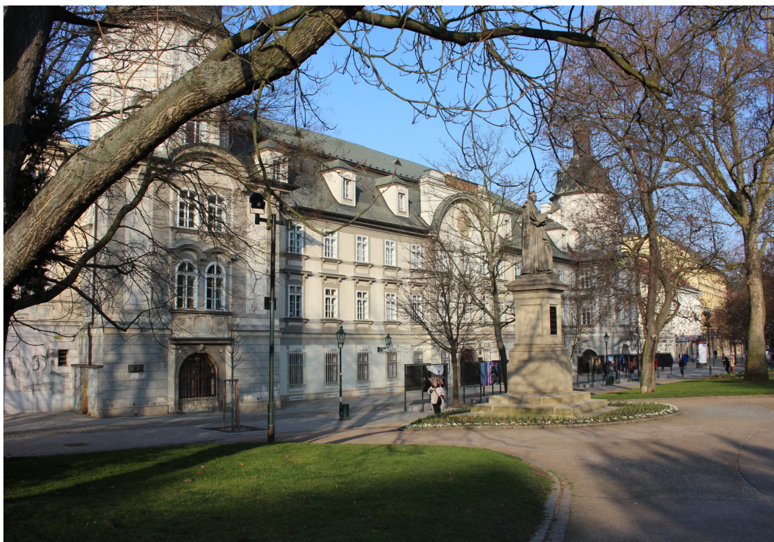
Pohled na městskou knihovnu 1