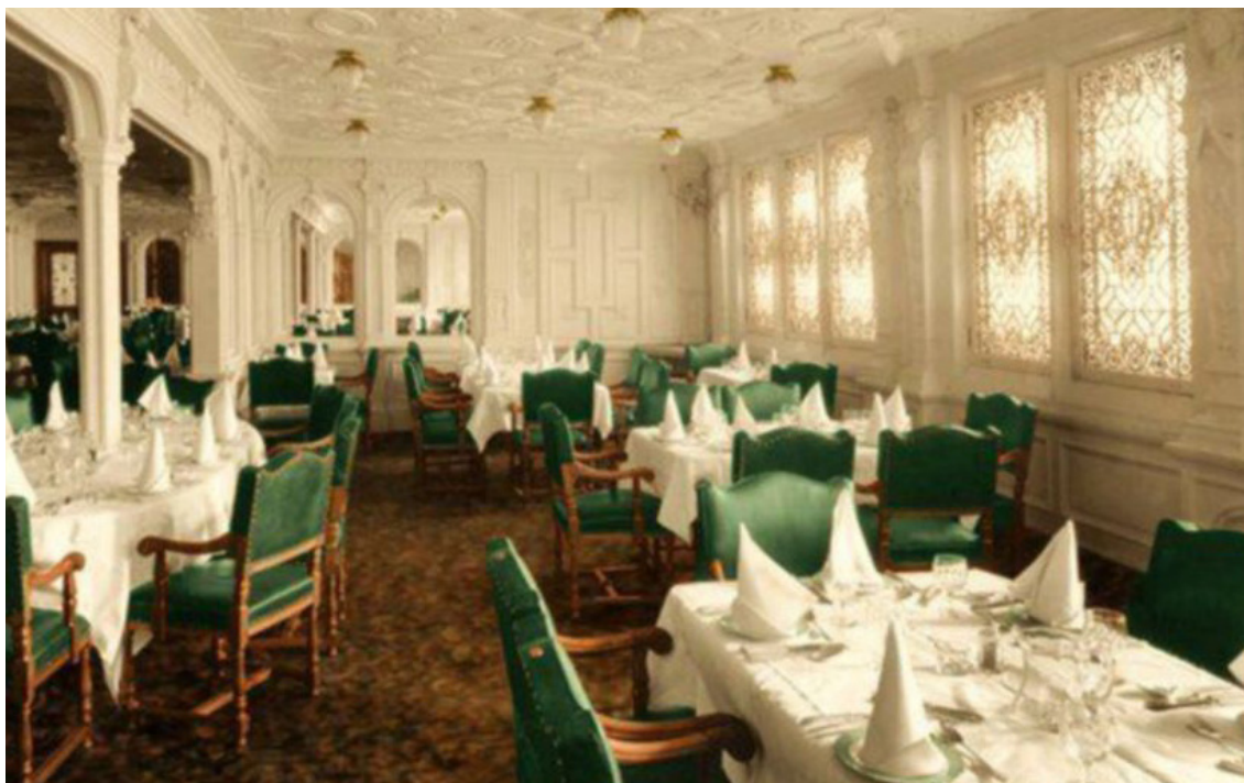
Anton Logvynenko, Jídelsna na Titaniku 1