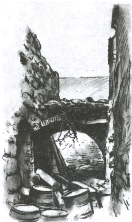
Karel Votlučka, Plzeňské pomněnky 1