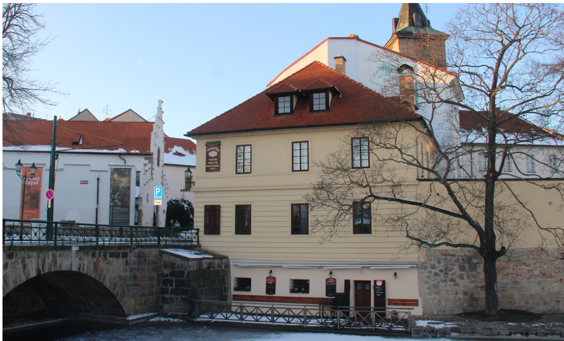
Výhled na Mlýnskou strouhu 2