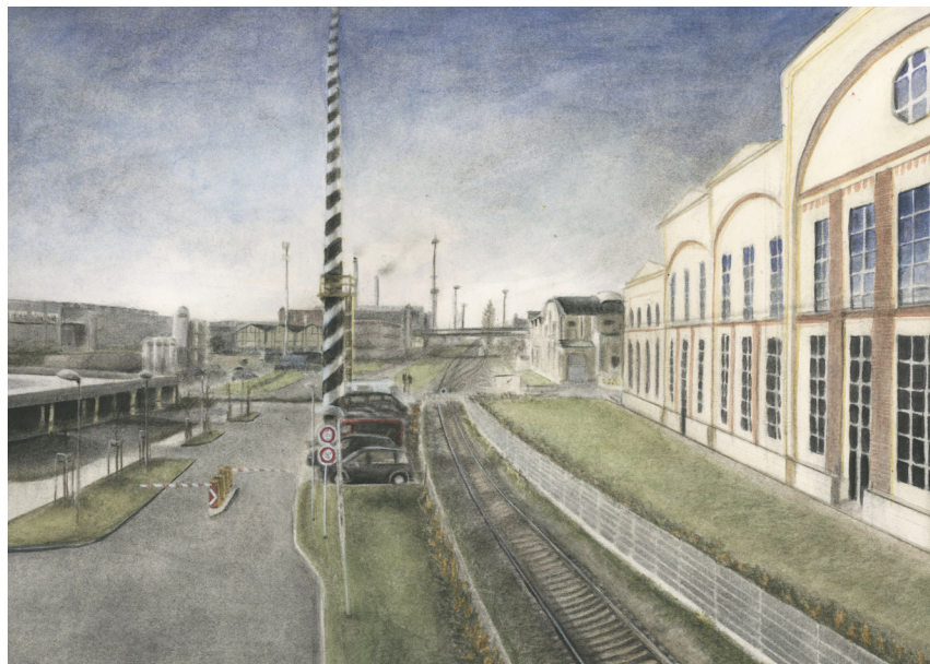
Ukázka finální kresby, Techmania Science Center 2