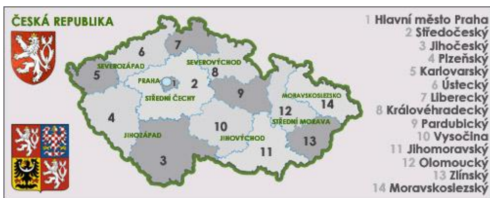
Obrázek č. 1: Uspořádání krajů v České republice

kompetencí krajů, jelikož ústavní zákon pouze upravoval územní určení krajů, ale ne jejich kompetence. Vytvořeny byly nové zákony o obcích a krajích a o volbách do jejich zastupitelstev. První volby do zastupitelstev krajů se konaly 12. listopadu 2000. Vznik krajů přispěl k posílení demokratičnosti veřejné správy a k posílení prvků územní samosprávy v České republice. 27 Kraje svoji činnost zahájily k 1.1.2001 v rámci 1. fáze reformy územní veřejné správy. Tímto byl vytvořen další stupeň samosprávy a byl to další posun k zahájení decentralizace státní správy. Do přenesené nebo samostatné působnosti krajů byly převedeny některé činnosti ústřední státní správy a krajům byla zákonem umožněna zákonodárná iniciativa. Na kraje byl také převeden majetek státu a některé zřizovatelské funkce. Nyní tedy v České republice existuje dvoustupňový systém územní veřejné správy a první etapa reformy veřejné správy byla završena. 28