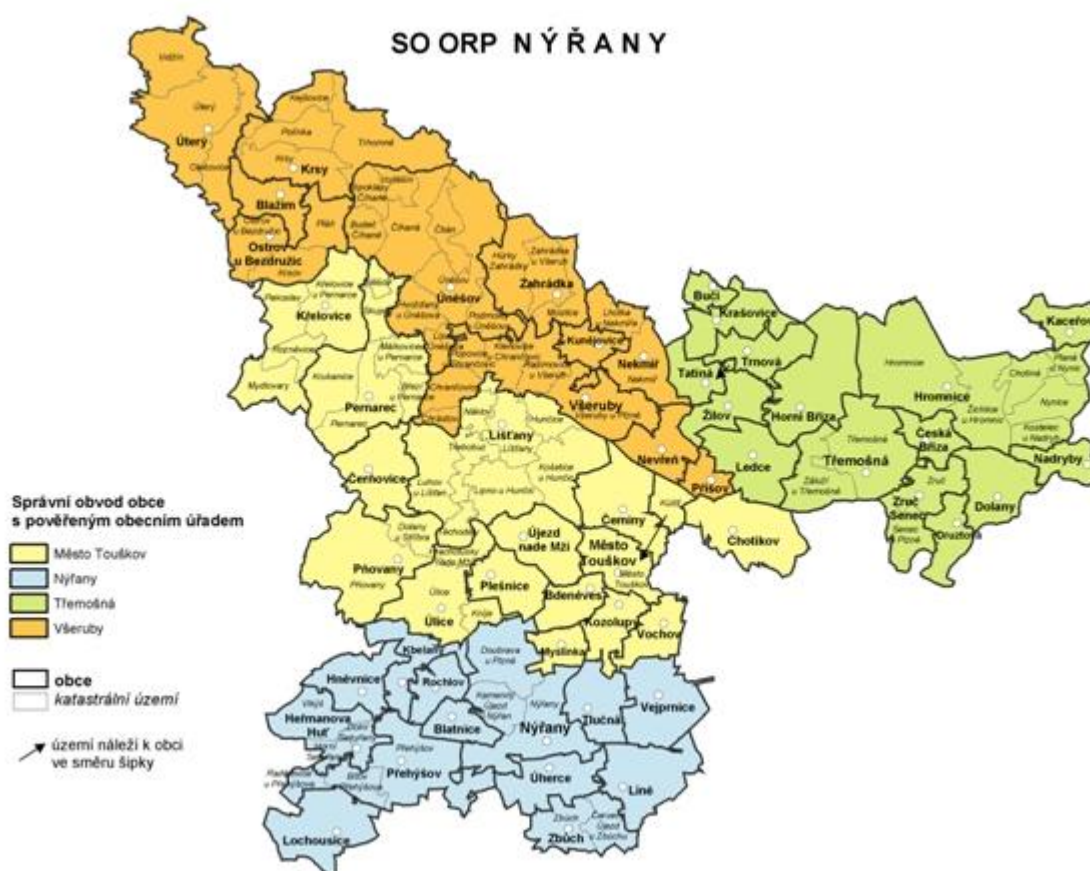
Obrázek č. 5: Správní obvod ORP Nýřany 85

Čtyři z těchto obcí – Třemošná, Nýřany, Všeruby a Město Touškov jsou obcemi s pověřeným obecním úřadem. Obcí se statutem města je v tomto správním obvodu celkem pět. 84