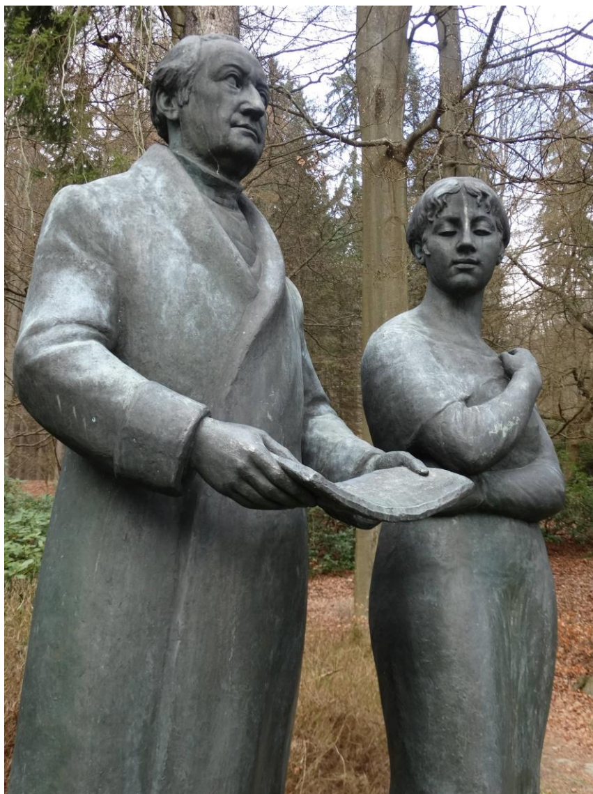
Obrázek č. 1 Goethe a Múza