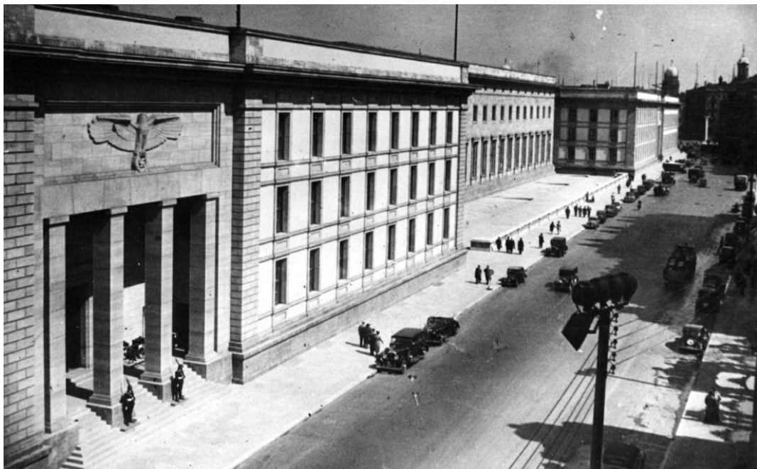
Příloha č. 6: Nové Říšské kancléřství