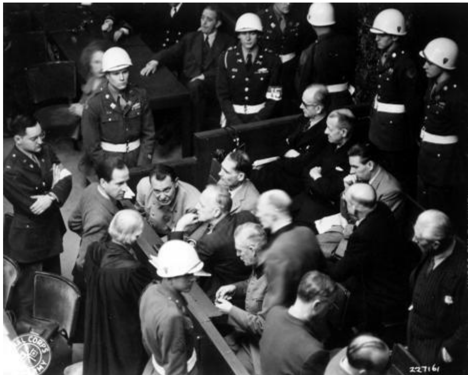
Příloha č. 9: Vězeňský psycholog G.M. Gilbert (na obrázku vlevo) pečlivě naslouchá rozhovorům v lavici obžalovaných