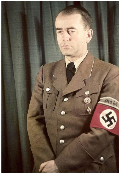
Příloha č. 1: Albert Speer