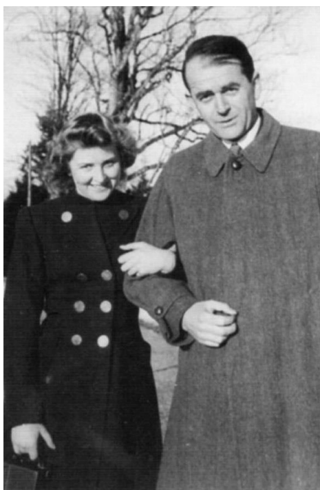
Příloha č. 3: Speer a Eva Braunová