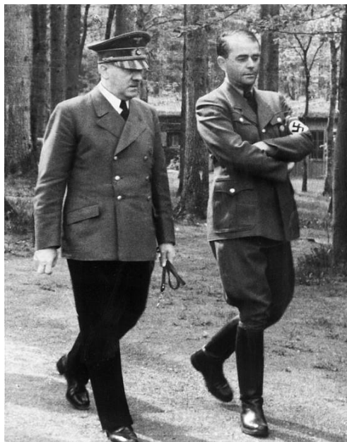
Příloha č. 2: Albert Speer při jedné z procházek s Adolfem Hitlerem