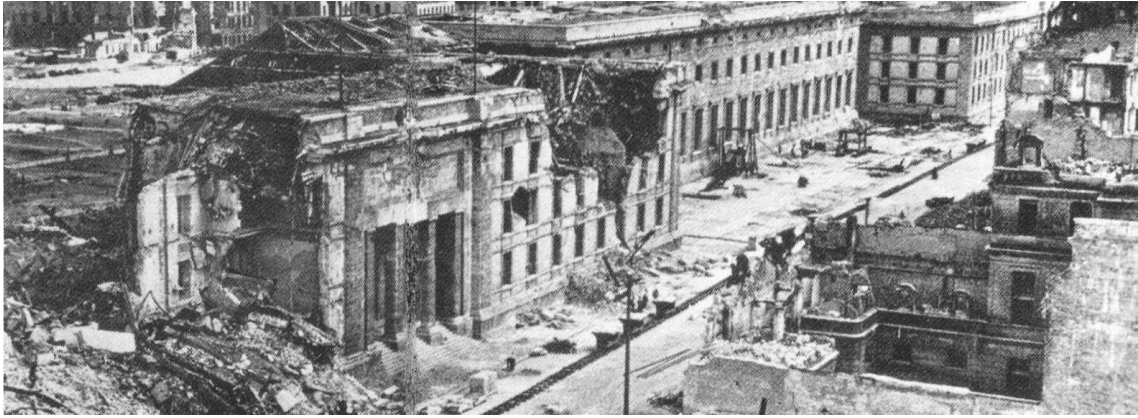
Příloha č. 6: Podoba Říšského kancléřství v průběhu jeho demolic