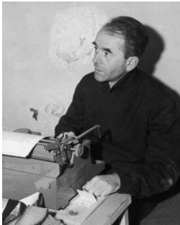
Příloha č. 15: Albert Speer ve věznicí Spandau

https://www.usarmygermany.com/Units/Berlin%20Brigade/USAREUR_Berlin%20Brigade.htm [02-04-2017]