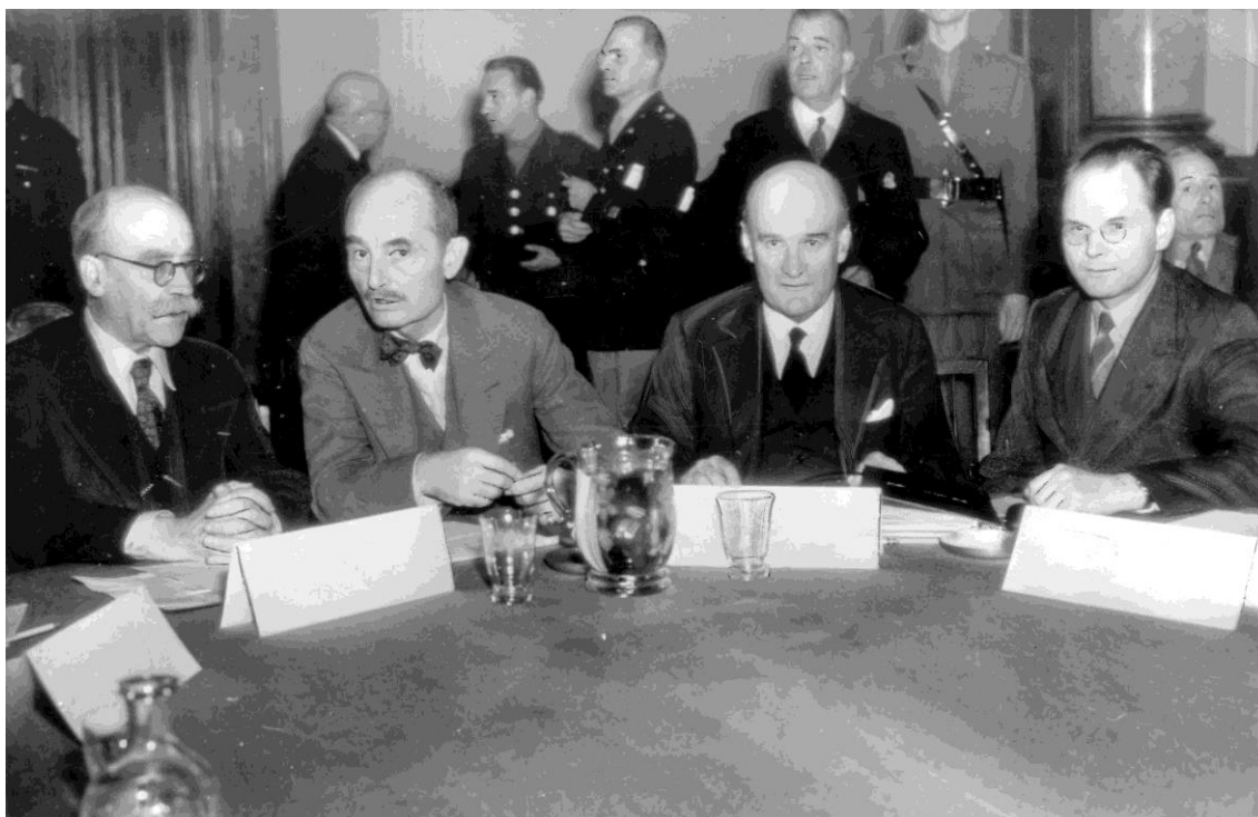
Příloha č. 10: Soudci vítězných mocností H. Donnedieu de Vabres, F. Biddle, G. Lawrence a I. Nikitčenko

Zdroj: http://www.ihr.org/jhr/v17/v17n1p38_michaels.html [02-04-2017]