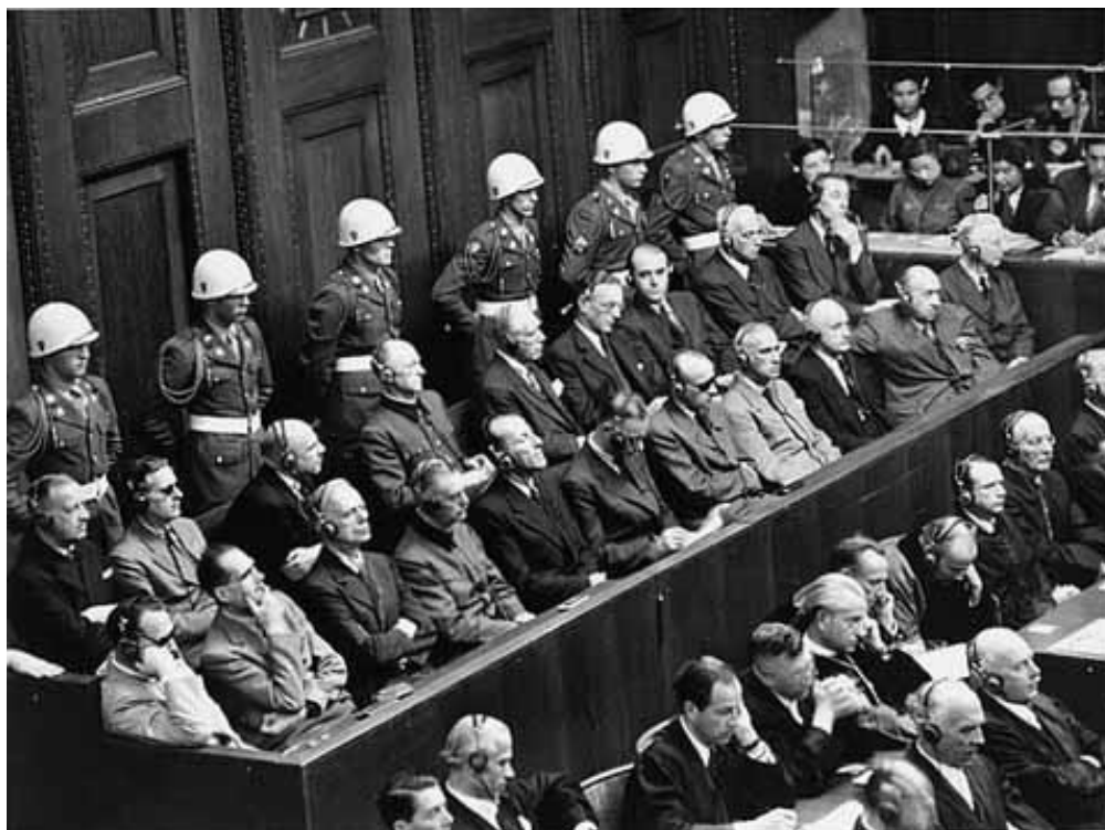
Příloha č. 11: Lavice obžalovaných