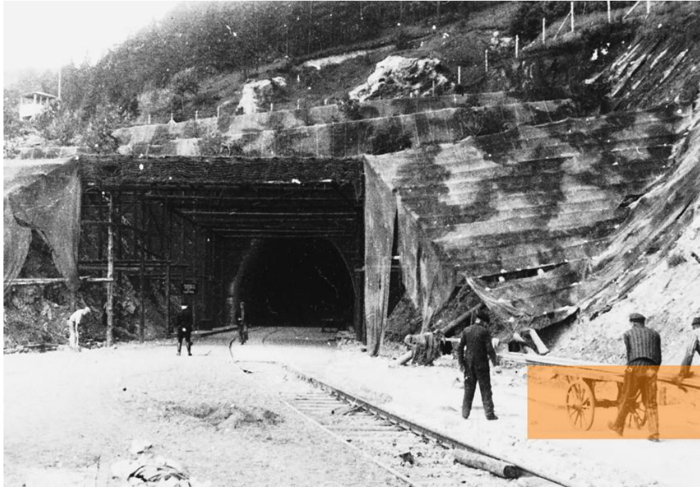
Příloha č. 8: Vchod do podzemní továrny s krycím názvem Dora