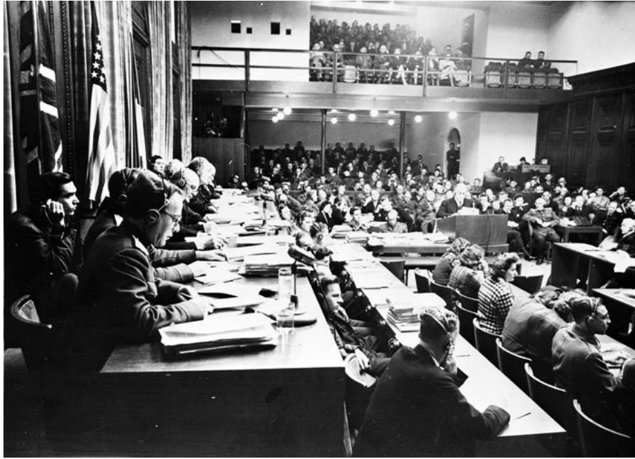
Příloha č. 12: Pohled do soudní síně