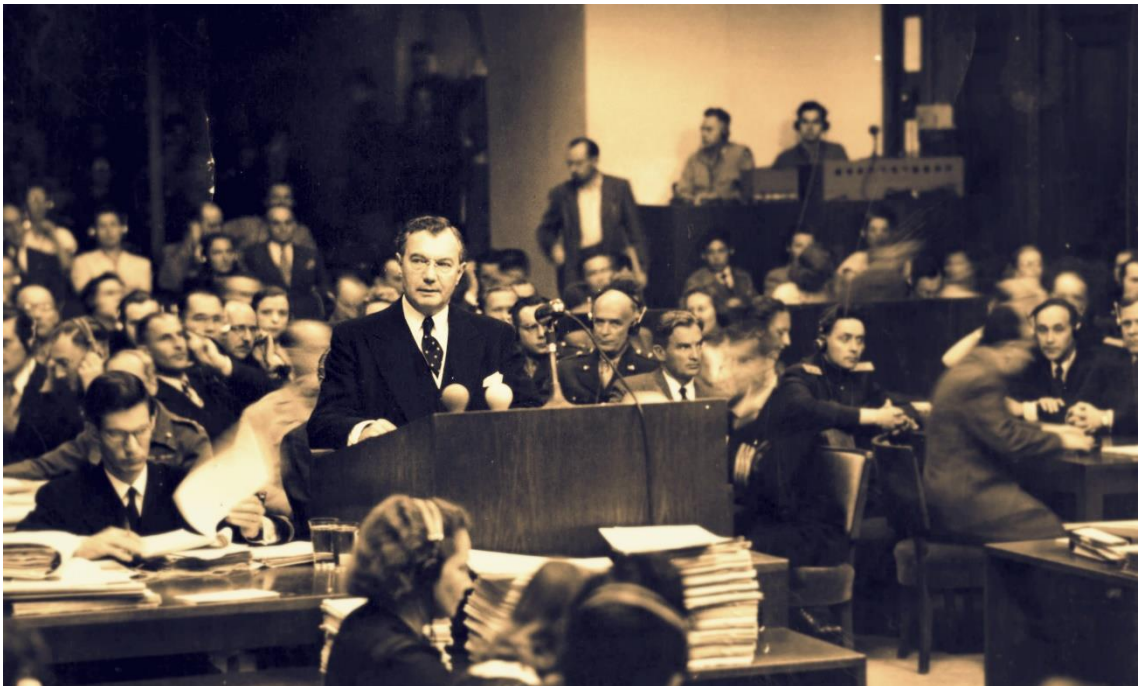
Příloha č. 7: Hlavní americký žalobce Robert H. Jackson při Norimberském procesu