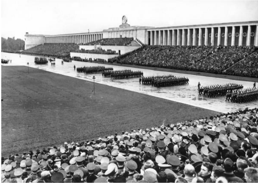
Příloha č. 5: Speerova norimberská tribuna