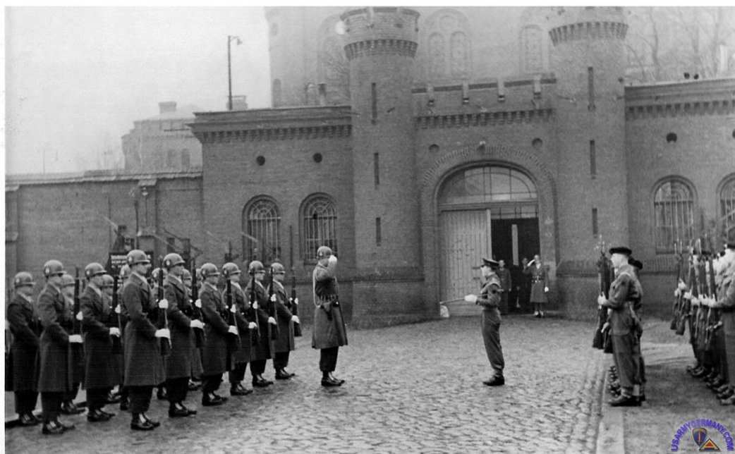
Příloha č. 14: Střídání stráží před věznicí ve Spandau