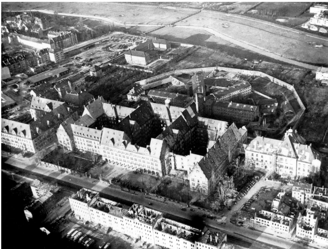
Příloha č. 13: Justiční palác v Norimberku s přiléhajícím vězením