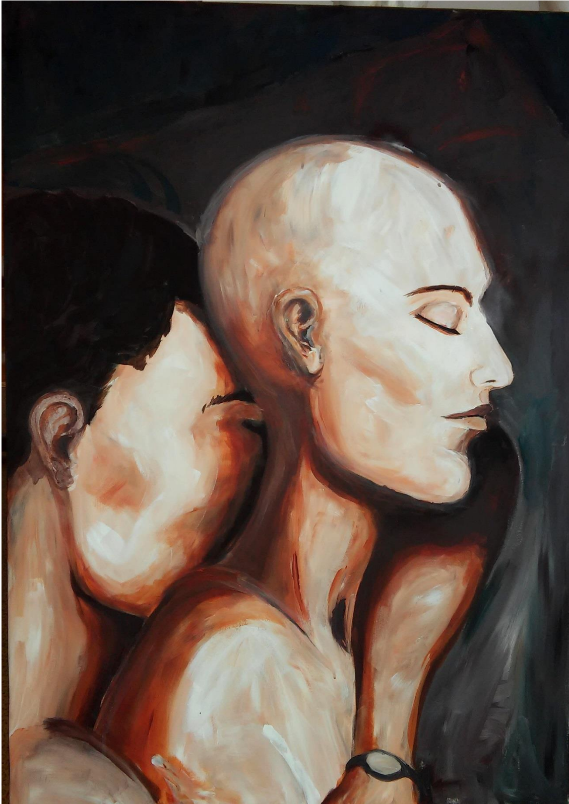
5.4 spánek aneb říše snů, 100x70 cm, akryl na plátně