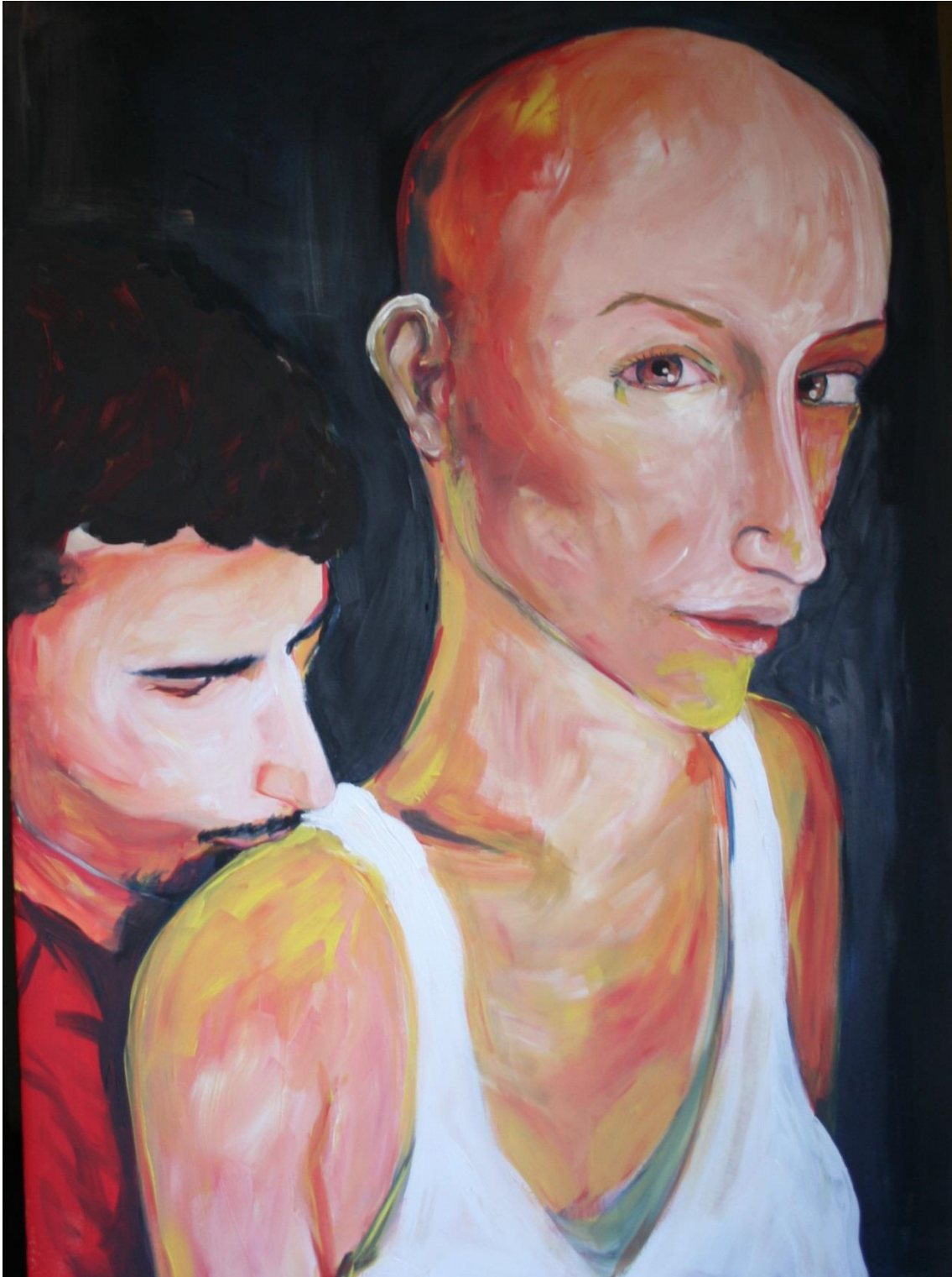
5.6 Právo na lásku, 100x70 cm, akryl na plátně