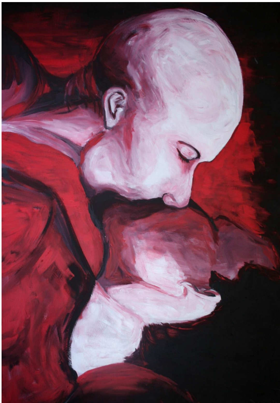
5.1 Polibek, 100x70 cm, akryl na plátně