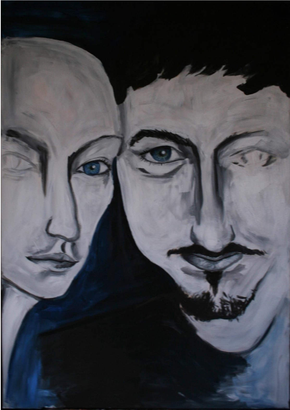
5.5 Brána do duše, 100x70 cm, akryl na plátně