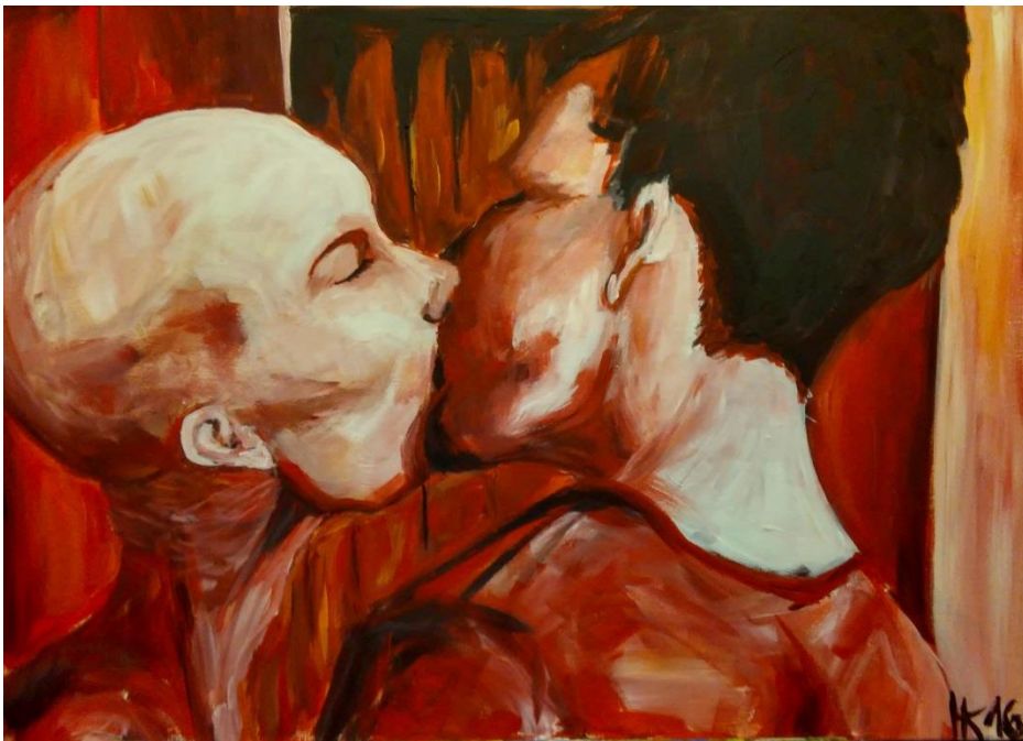
Polibek barevná skica