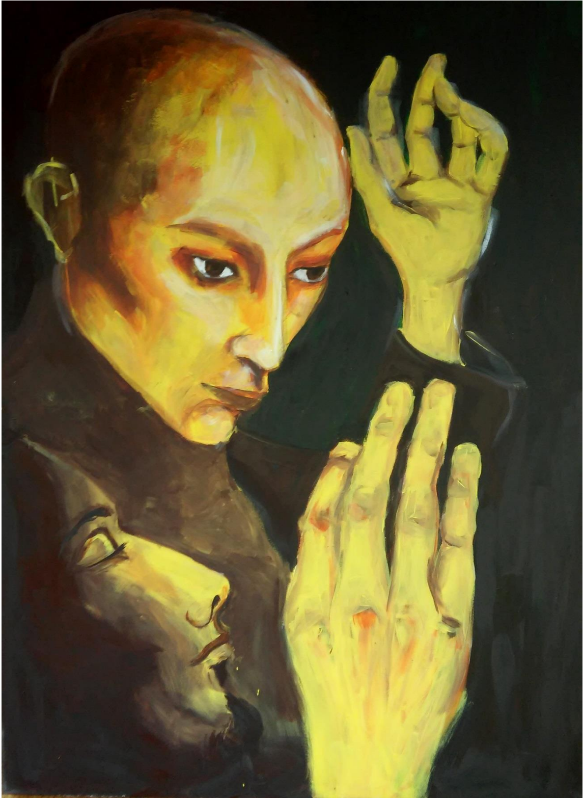
5.7 Podání ruky, 100x70 cm, akryl na plátně