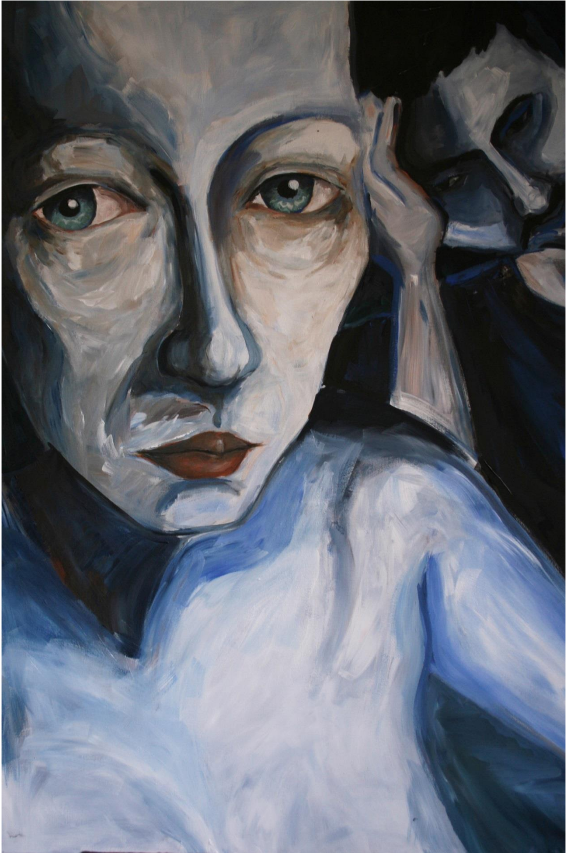
5.2 Beznaděj, 100x70 cm, akryl na plátně