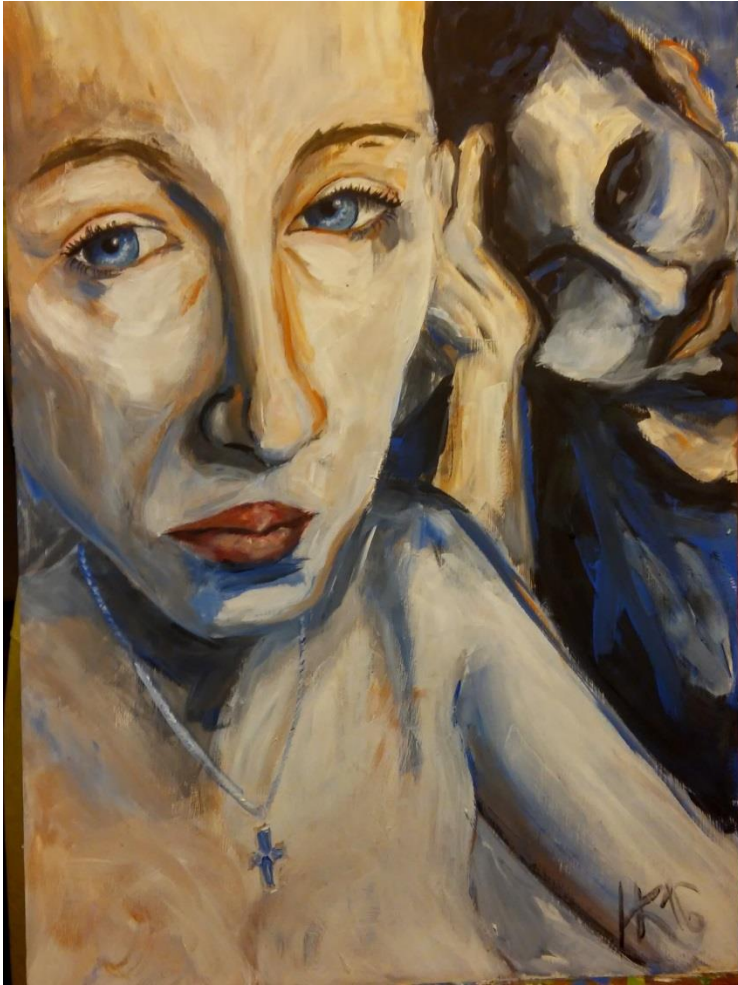
Beznaděj barevná skica