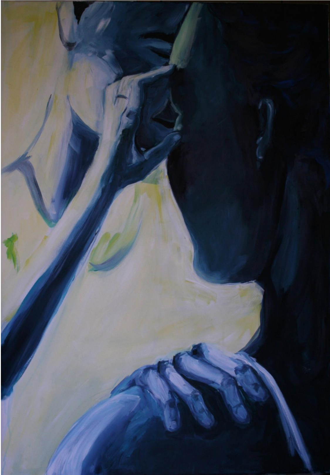
5.3 Dotek srdce 100x70 cm, akryl na plátně