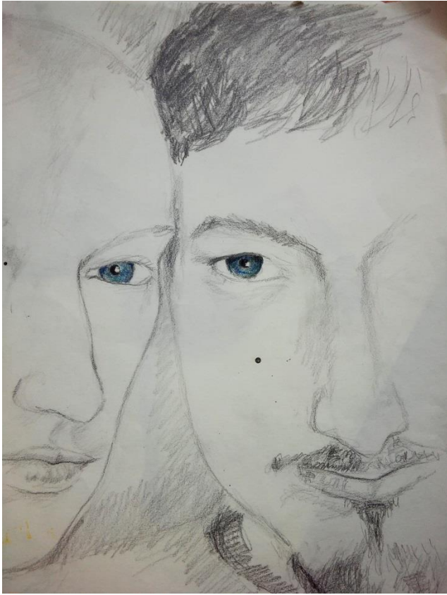
Brána do duše – skica tužka/pastelka