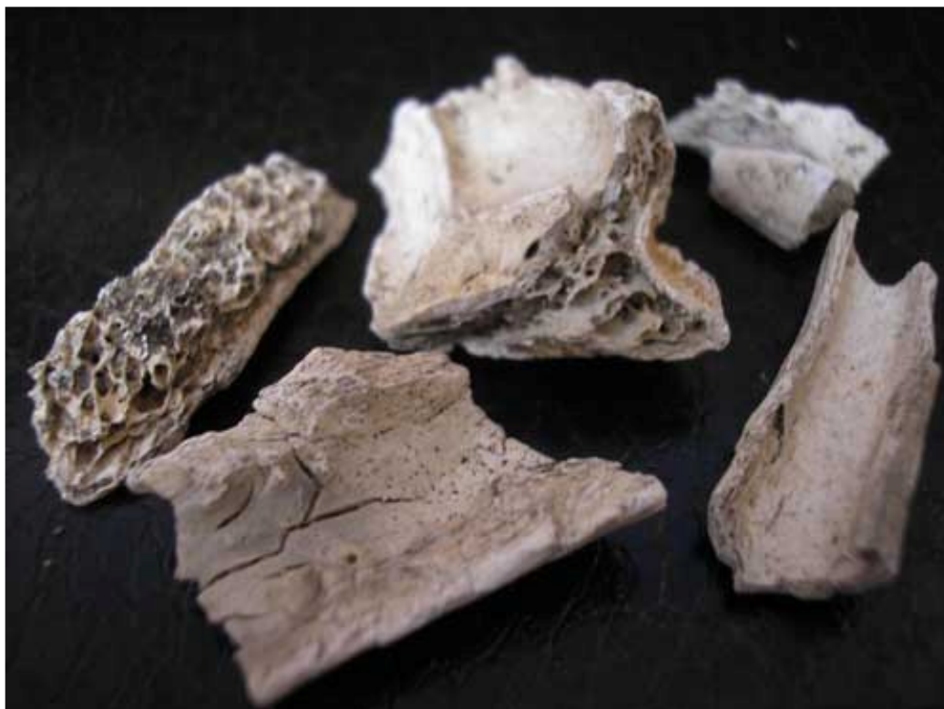
Obr. 16) Kosterní pozůstatky po obětech vyhlazovacího tábora Kulmhof am Ner (Chełmno nad Nerem), které byly posbírány během návštěvy vyhlazovacího sektoru tohoto tábora. Při procházce po rozlehlé pláni stačilo sehnout se a nabrat hrst půdy, která byla (ještě v roce 2002!) takřka vždy promísena s lidskými ostatky. Z archivu M. Chocholatého.