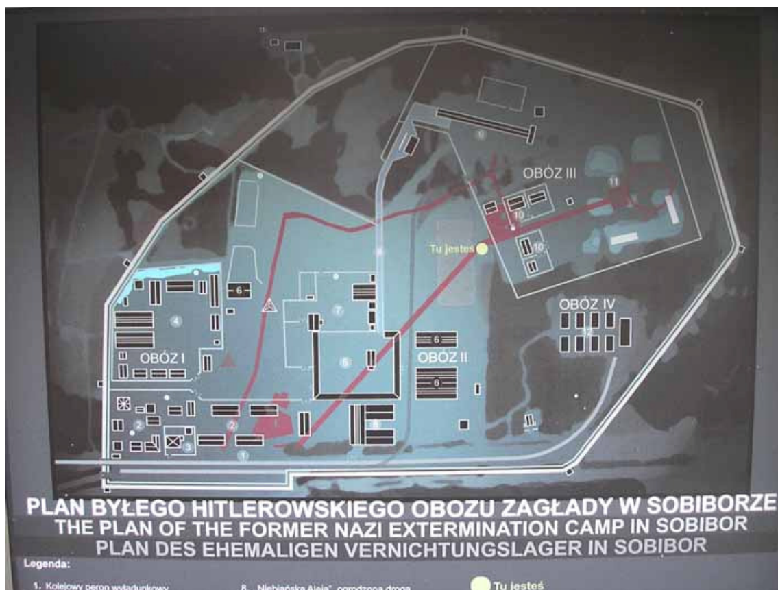
Obr. 4) Plán bývalého vyhlazovacího tábora Sobibor na informační tabuli sobiborského památníku. Sobibor, 4/2008.