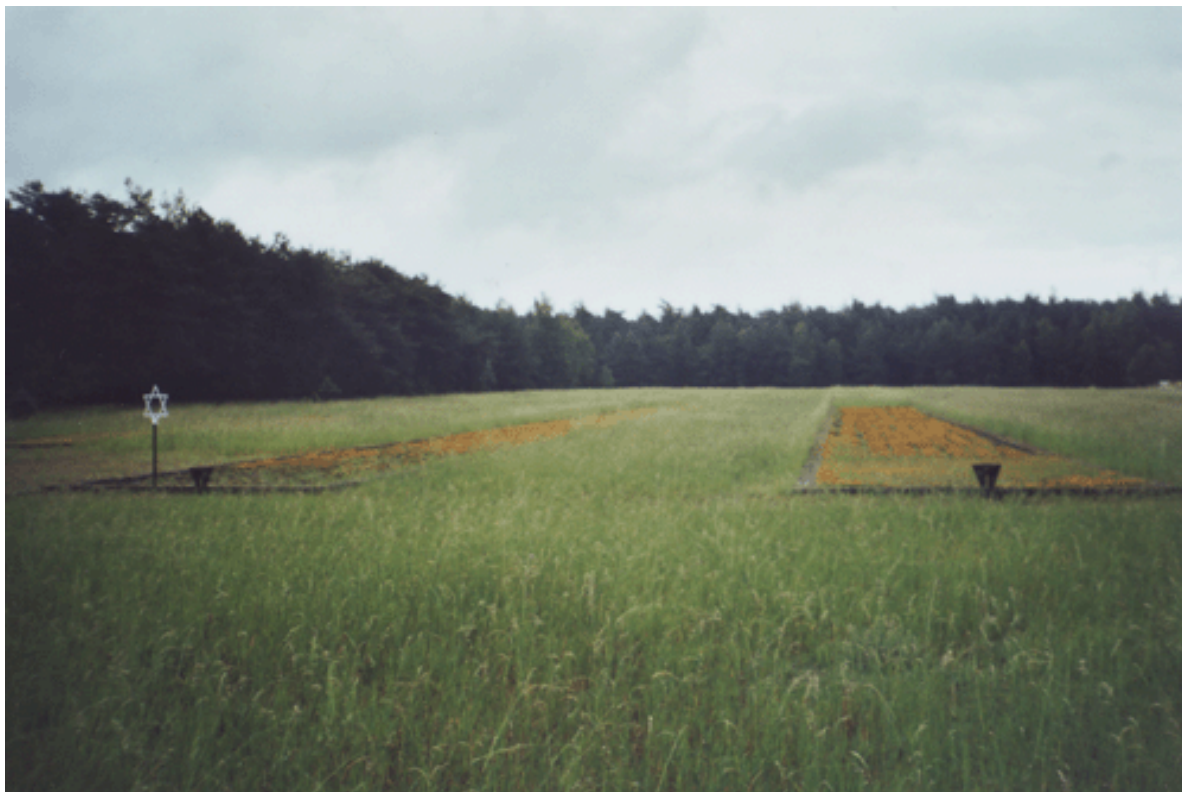
Obr. 6) Symbolické spalovací hranice na planině Žuchovského lesa, součásti vyhlazovacího tábora Chełmno nad Nerem, 5/2002.