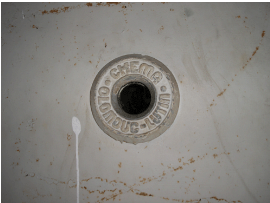
Obr. 10) Průzor ve dveřích plynové komory bývalého koncentračního tábora Mauthausen. Mauthausen, 11/2007.