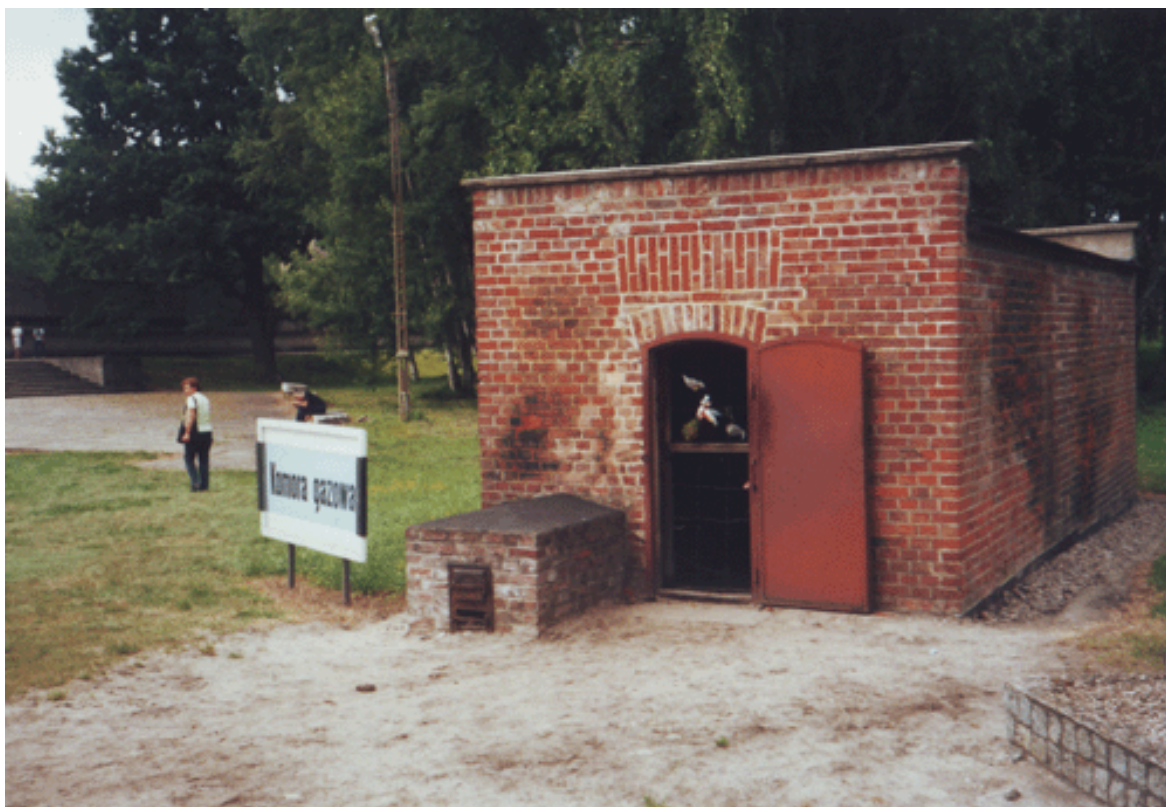
Obr. 12) Plynová komora v bývalém koncentračním táboře Stutthof. Sztutowo, 8/2001.