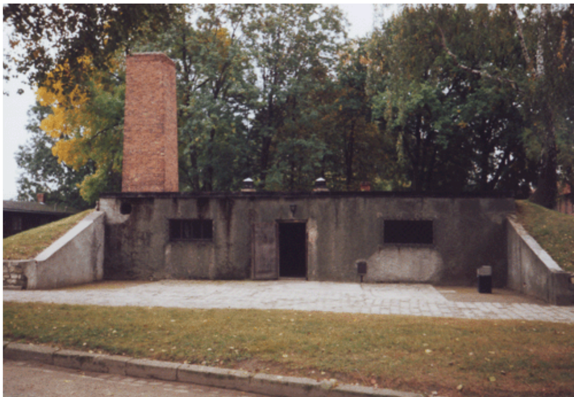
Obr. 9) Krematorium č. 1 v kmenovém táboře Osvětim. Zdejší márnice byla přestavěna na první osvětimskou plynovou komoru. Osvětim, 9/2000.