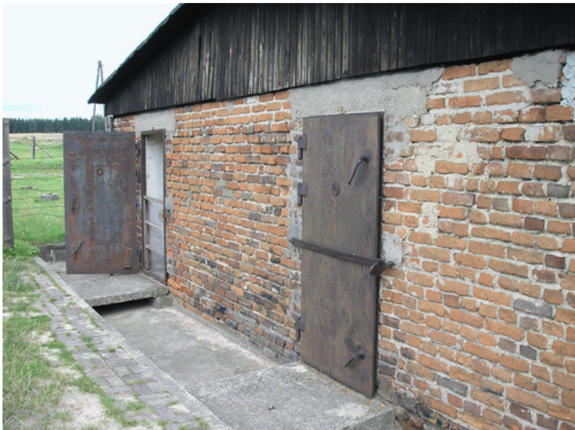
Obr. 8) Plynové komory v koncentračním táboře Lublin (Majdanek), 8/2005.