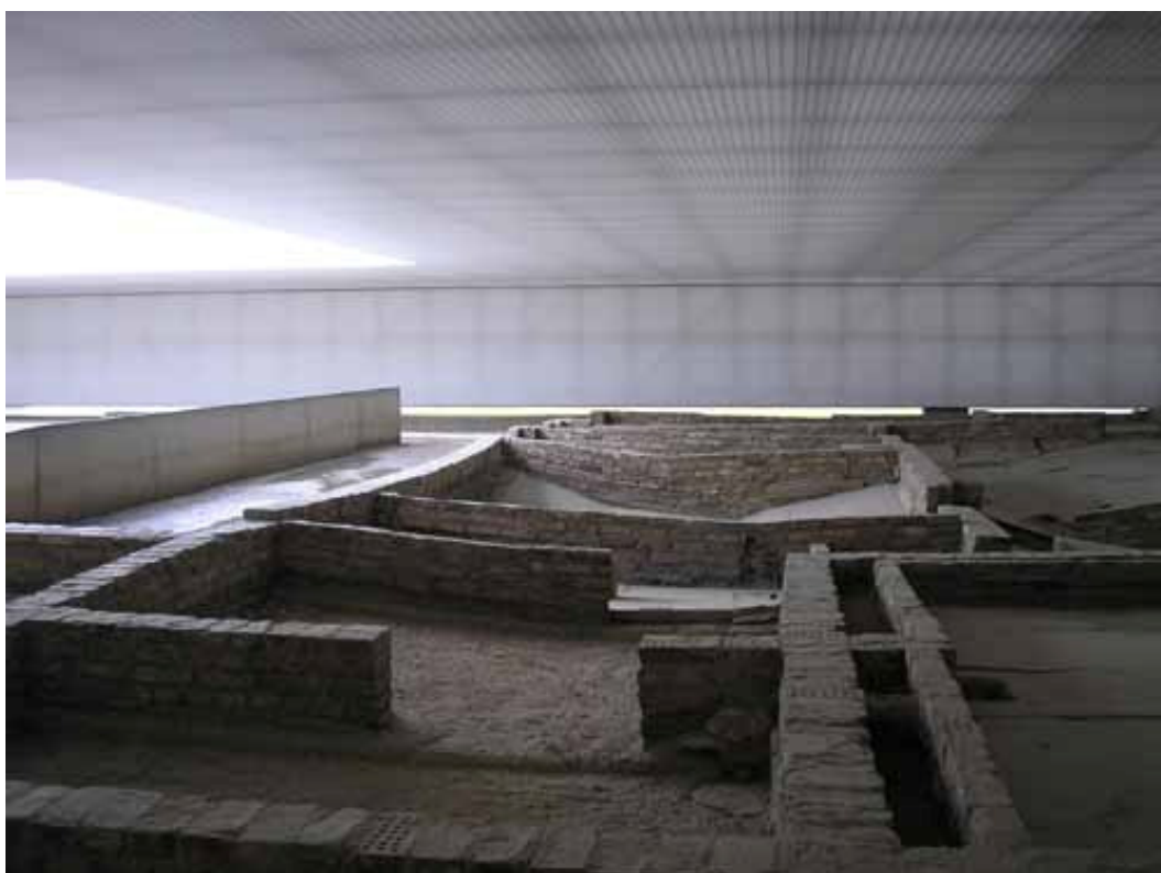
Obr. 15) „Stanice Z“, součást bývalého koncentračního tábora Sachsenhausen. Zde se nacházela táborová plynová komora. Oranienburg-Sachsenhausen, 4/2010.