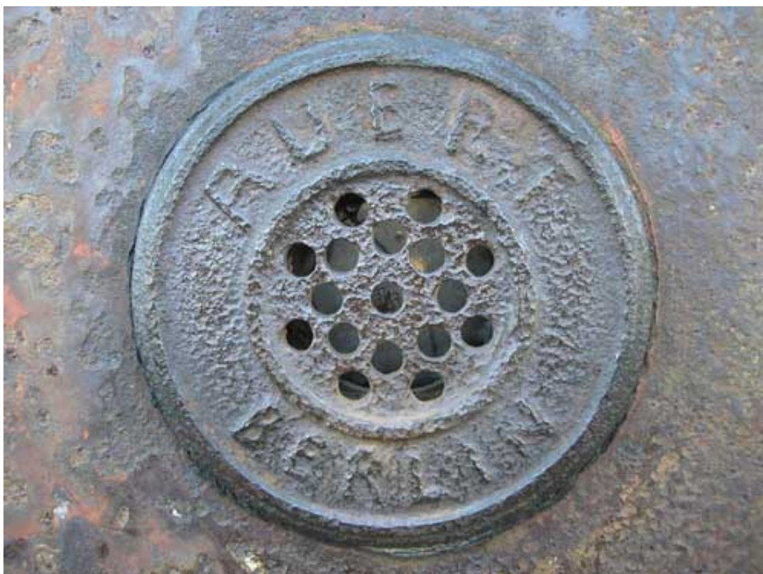
Obr. 11) Průzor ve dveřích plynové komory bývalého koncentračního tábora Lublin (Majdanek). Lublin, 3/2007.