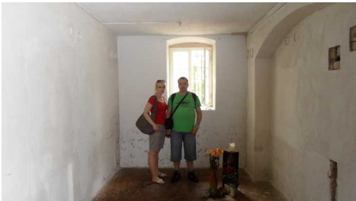
Obr. 2) Autorka v plynové komoře střediska „eutanázie“ v Sonnensteinu na Pirně.