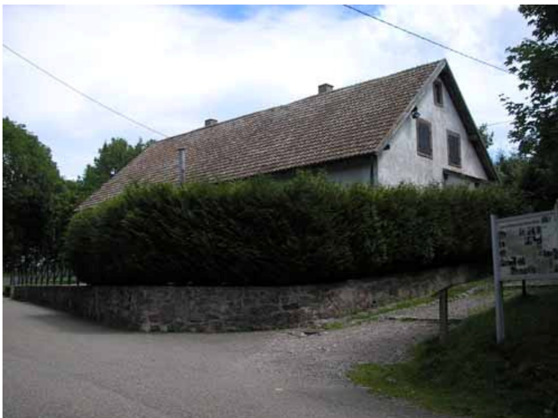
Obr. 13) Plynová komora, která patřila ke koncentračnímu táboru Struthof. Natzweiler, 7/2011.