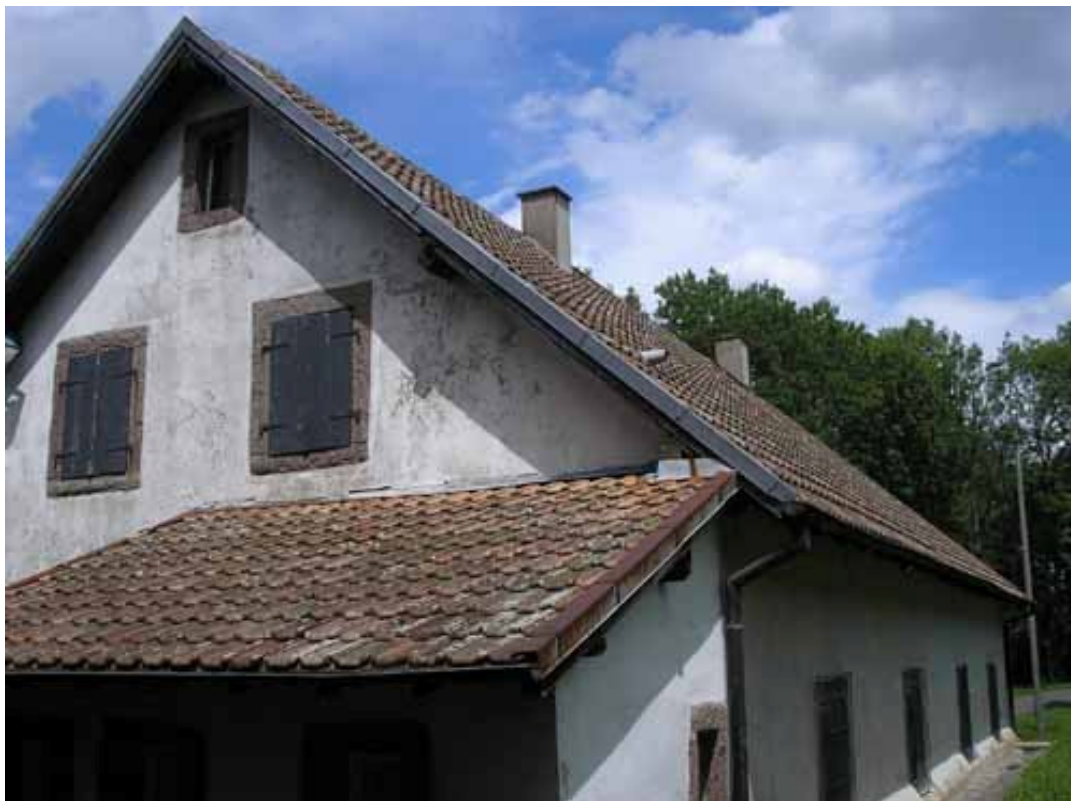
Obr. 14) Jiný pohled na dům s plynovou komorou KL Struthof. Natzweiler, 7/2011. Z archivu M. Chocholatého.