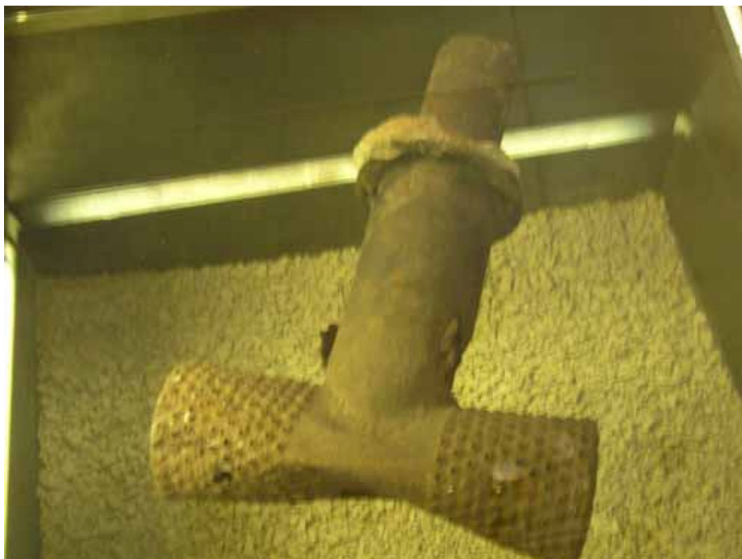
Obr. 5) Ústí plynovacího aparátu používaného ve vyhlazovacím táboře Bežec. Součást expozice bežeckého památníku. Bežec, 8/2005.