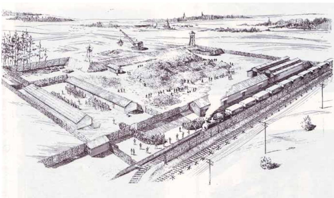
Obr. 7) Část vyhlazovacího tábora Treblinka z ptačí perspektivy. Nákres Samuela Willenberga z jeho knihy „Revolt in Treblinka“.