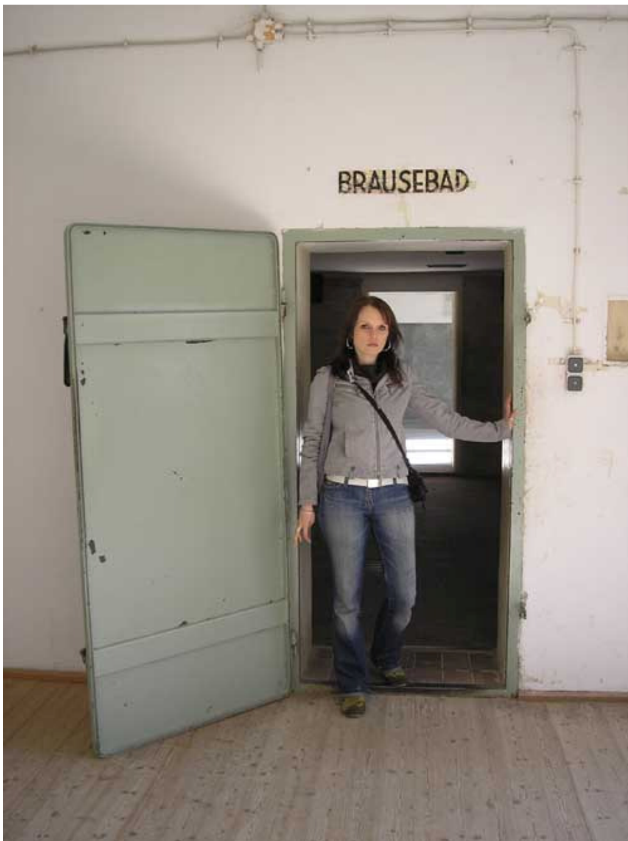
Obr. 1) Autorka ve vchodu do plynové komory koncentračního tábora Dachau.