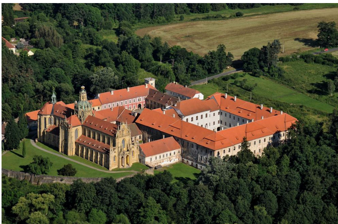
Obr. 4. Kladrubský klášter.