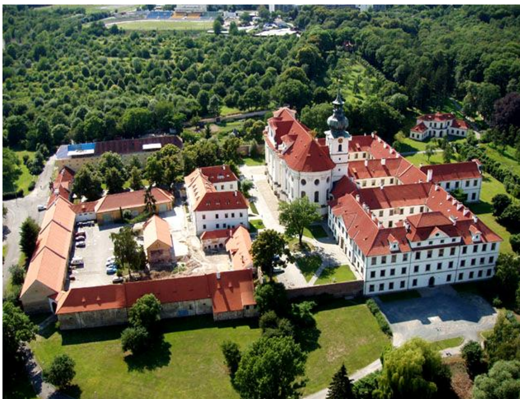
Obr. 1. Břevnovský klášter. Zdroj:

http://cokdyvpraze.cz/nimages/4d5bc9910525f35dd89b403c678f1b3bfc557f70.jpeg .