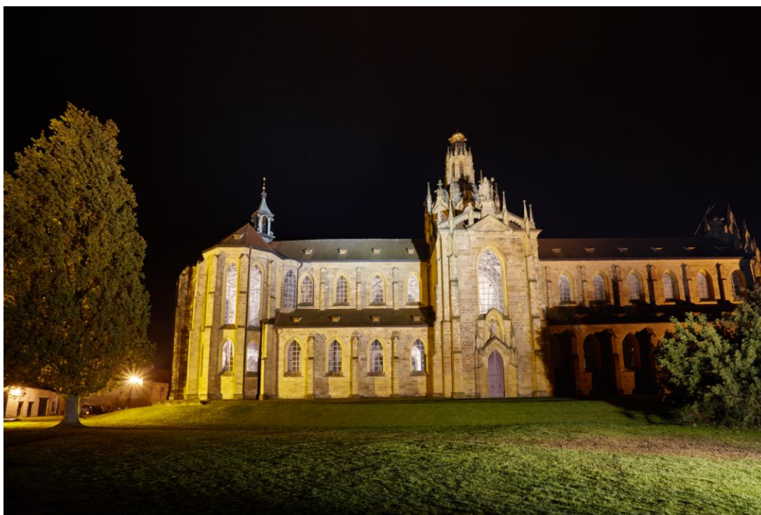
Obr. 5. Kostel Nanebevzetí Panny Marie v Kladružech.