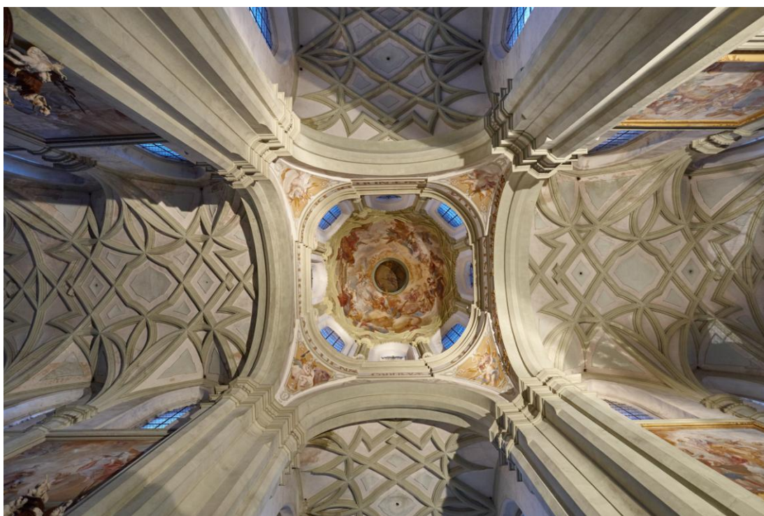
Obr. 6. Pohled do kupole kostela Nanebevzetí Panny Marie v Kladružech.