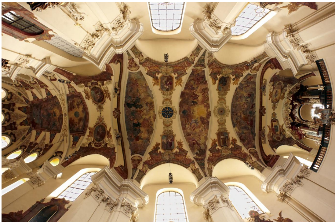
Obr. 3. Klenba stropu kostela sv. Markéty.