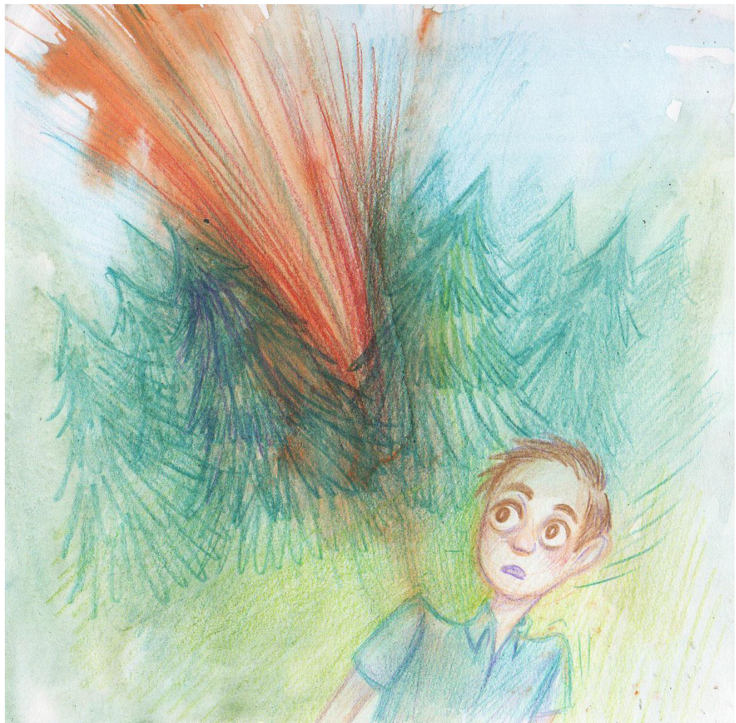
Pokusy různých technik a jejich kombinace