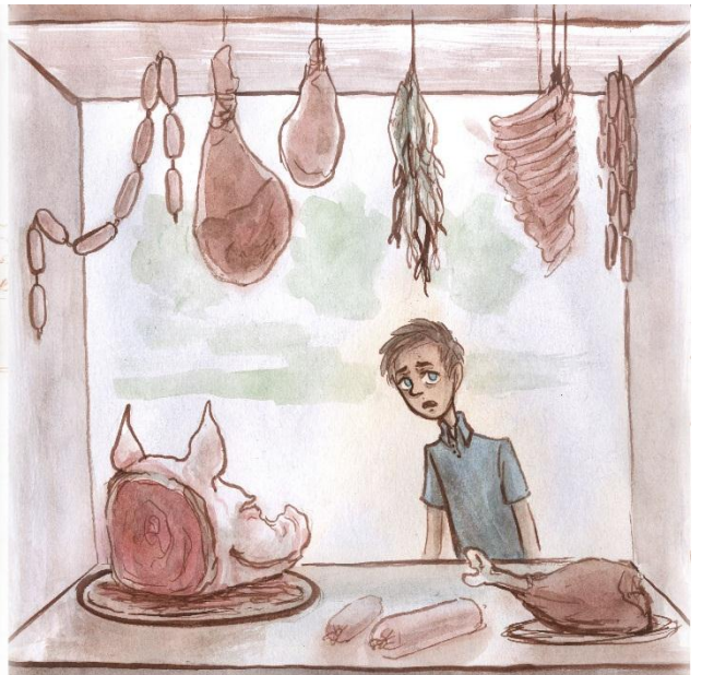
Ukázky hotových ilustrací