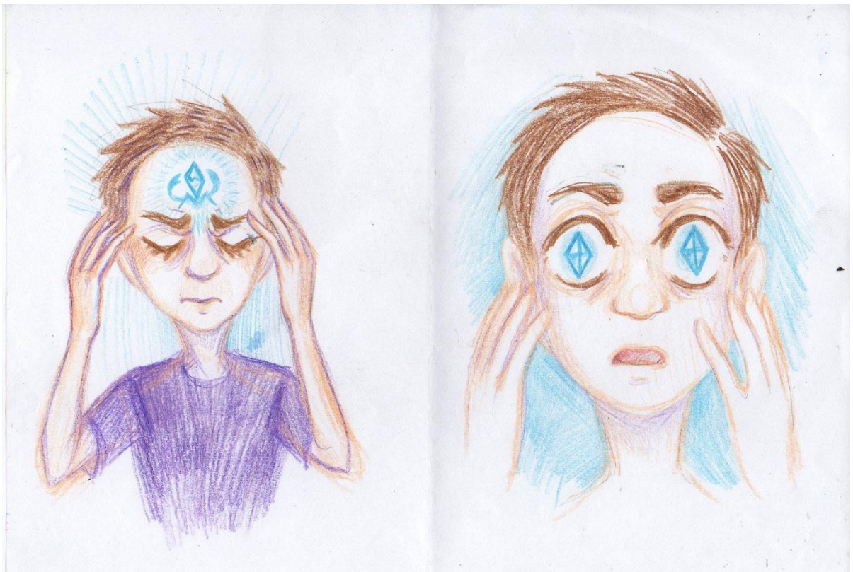
Pokusy různých technik a jejich kombinace