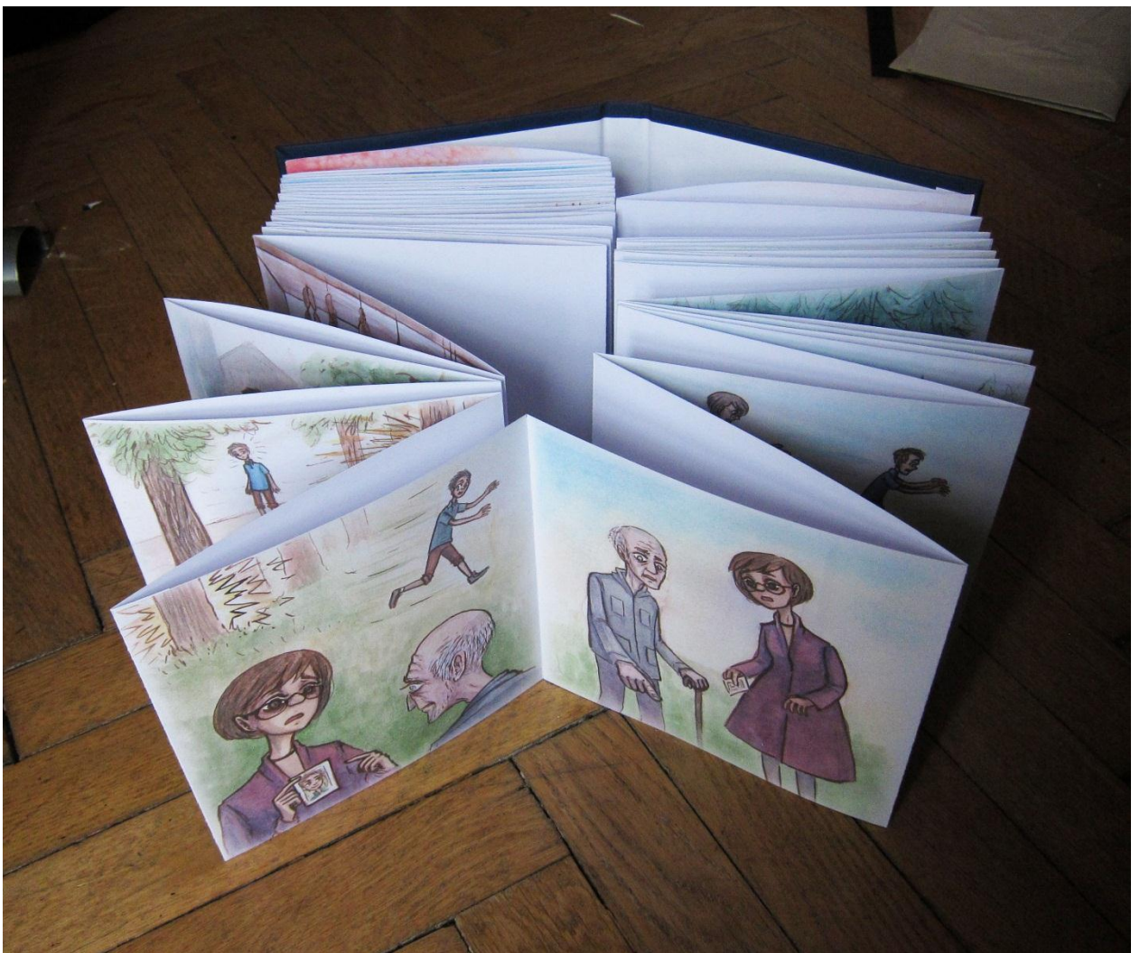
Finální podoba knihy