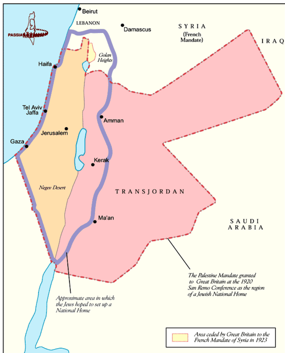
Příloha č. 1: Palestina v období Britského mandátu