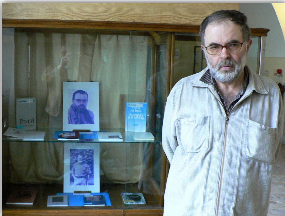
9. 2010 - Studijní a vědecká knihovna města Plzně.