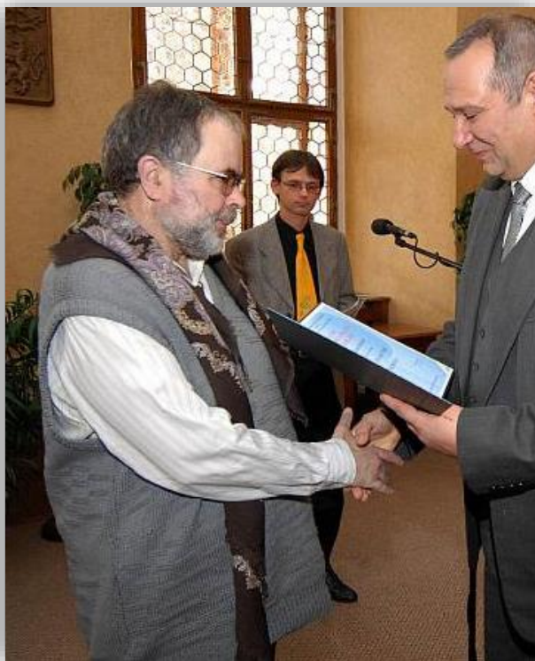
4. Předání Ceny Bohumila Polana na plzeňské radnici za básnické sbírky Zvolání do mlhy a Insomnia.