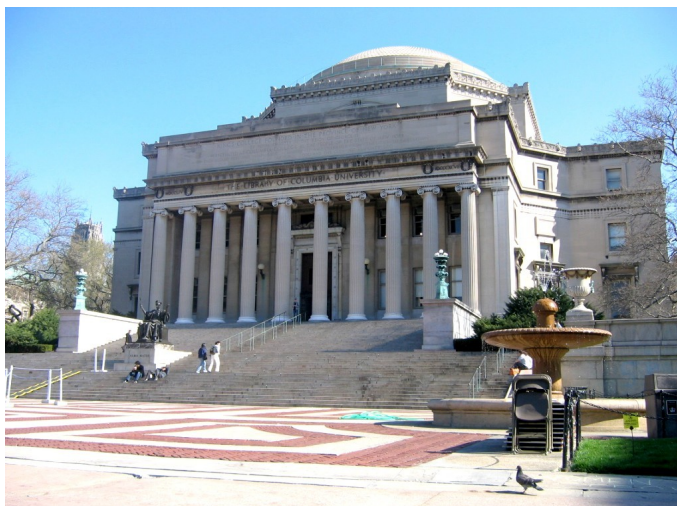
Obrázek č. 4: Knihovna Kolumbijské univerzity