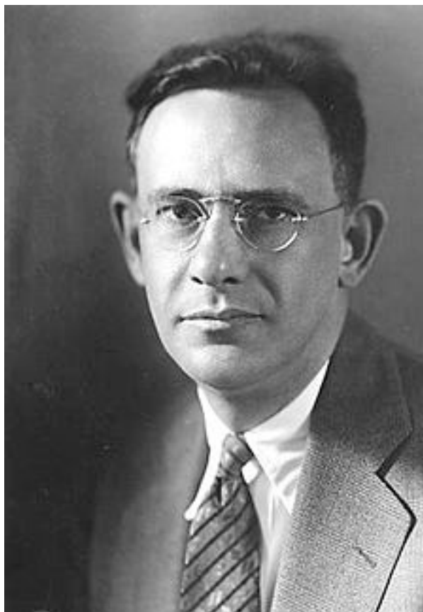
Obrázek č. 10: Edward Sapir