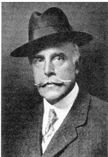
Obrázek č.5: Madison Grant