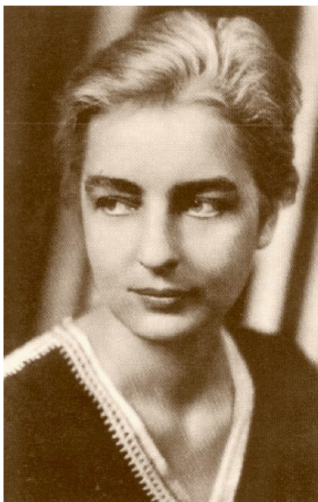
Obrázek č. 7: Ruth Benedictová