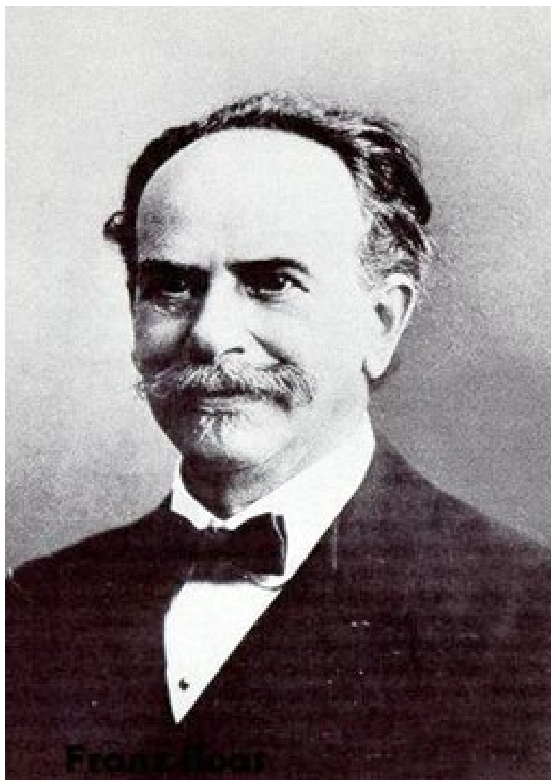
Obrázek č.1: Franz Boas