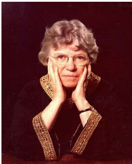
Obrázek č. 8: Margaret Meadová