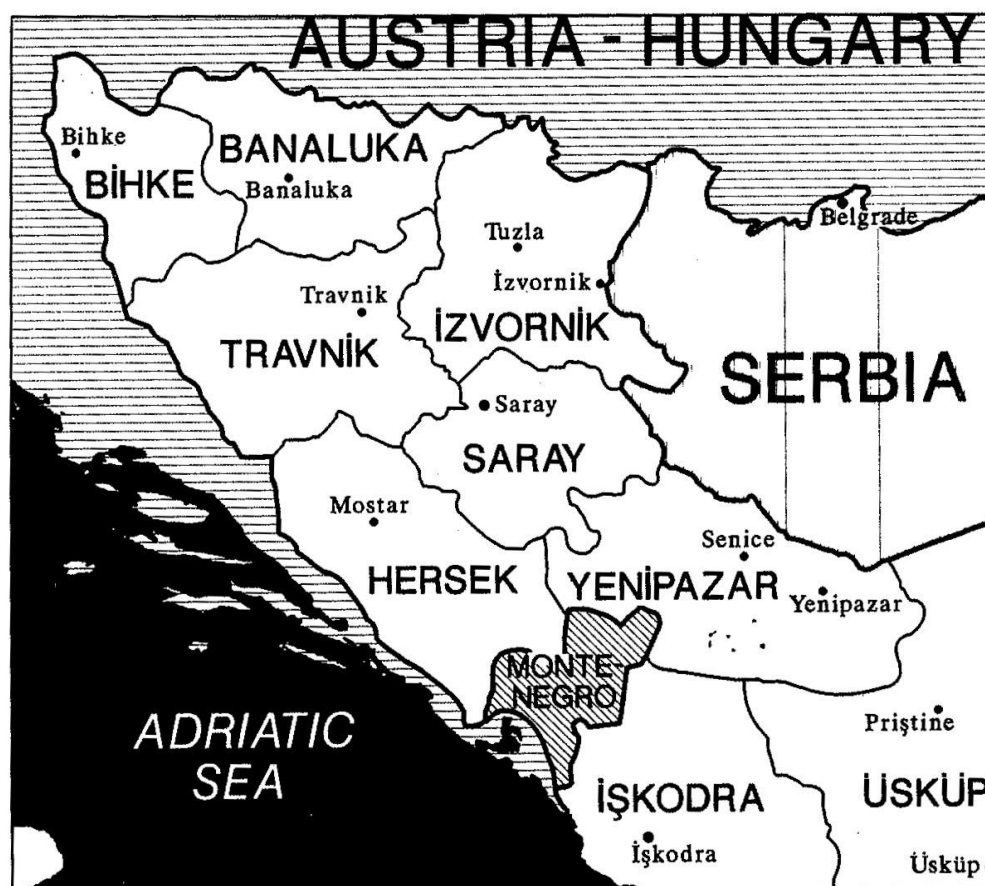
Ottoman Bosnia, Borders in 1870