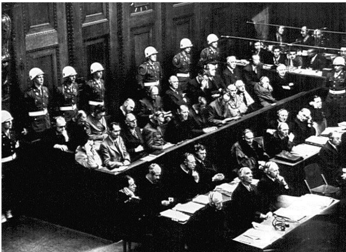
Obraz č. 6 Norimberský tribunál. Pohled na lavice obžalovaných