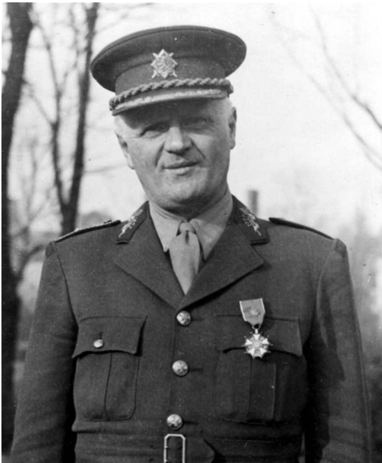
Obraz č. 2 Generál JUDr. Bohuslav Ečer