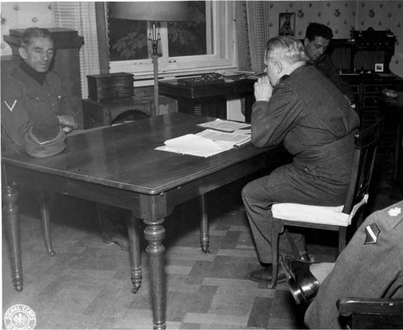
Obraz č. 3 Bohuslav Ečer vyslýchá K. H. Franka