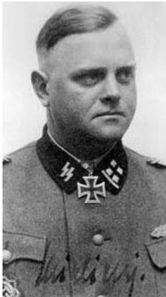
Obraz č. 5 Dieter Wysliceny jako Eichmannův zmocněnec