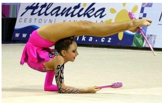
Obrázek č. 3 (Rovnováha na loktech)

Rovnováhy jsou dle platných pravidel FIG 2017 hodnocené od 0,1 do 0,6 bodů, podle jejich obtížnosti a jsou zaznamenány v tabulce i s přiřazenou značkou.