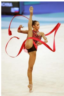
Obrázek č. 5(Rotace s vysokým přednožením)

Rotace jsou dle pravidel FIG 2017 hodnocené od 0,1 do 0,5 bodů, podle jejich obtížnosti a jsou zaznamenány v tabulce i s přiřazenou značkou.