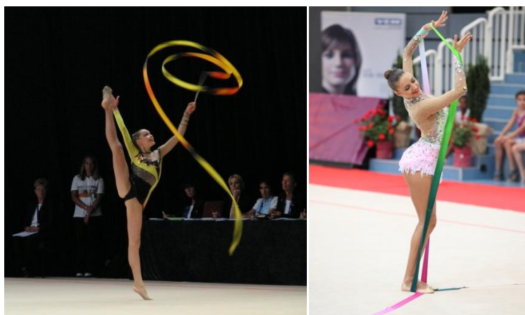
Obrázek č. 2 (z leva: Červenková, Kanaeva)

Nejúspěšnější světovou gymnastkou se stala Ruska Kanaeva (Obrázek č. 1), která jako první v historii obhájila titul z OH (2008, 2012).