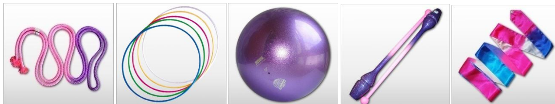
Obrázek č. 6 (z leva: švihadlo, obruč, míč, kužele, stuha)

V moderní gymnastice se využívá švihadlo, obruč, míč, kužele a stuha (obrázek č. 6). Každé náčiní má předepsané normy, které musí gymnastka dodržet. V případě, že normy nejsou v pořádku, může být závodnice diskvalifikována.