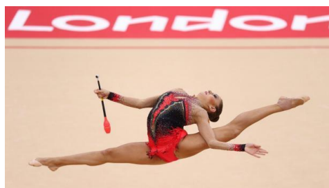
Obrázek č. 4 (Dálkový skok)

Skoky jsou dle pravidel FIG 2017 hodnocené od 0,1 do 0,6 bodů, podle jejich obtížnosti a jsou zaznamenány v tabulce i s přiřazenou značkou.